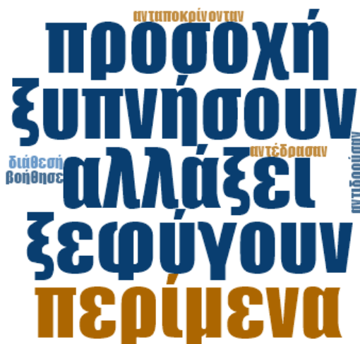
Εικόνα 5: Word Frequency - Ποιες ήταν οι προσδοκίες σας σχετικά με την υλοποίηση των ολιγόλεπτων σωματικών δραστηριοτήτων στην τάξη;

Στη συνέχεια με χρήση του εργαλείου word frequency count του λογισμικού NVivo δημιουργήσαμε την παρακάτω προεπισκόπηση των 10 πιο συχνά εμφανιζόμενων λέξεων με ελάχιστο μήκος επτά χαρακτήρων. Το αποτέλεσμα, και