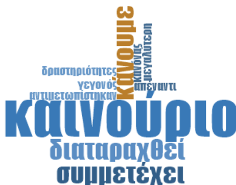
Εικόνα 6: Word Frequency - Τι προκλήσεις αντιμετωπίσατε και πως τις ξεπεράσατε;

Φαίνεται ξεκάθαρα στην εικόνα, ότι αυτό που θεωρούσαν πρόκληση οι εκπαιδευτικοί, ήταν από τη μία το καινούριο του πράγματος που είχαν να αντιμετωπίσουν και από την άλλη πως θα το δεχτεί η τάξη. Αν θα υπάρξει αναστάτωση και διαταραχή κατά την εφαρμογή του.