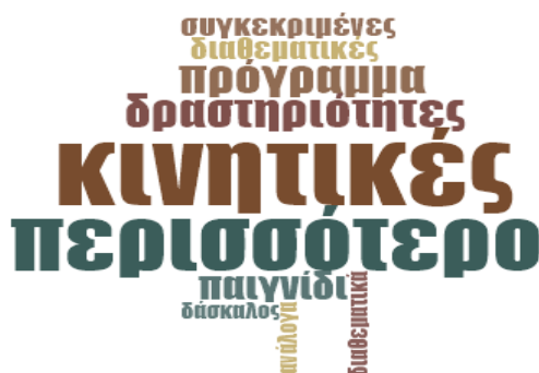
Εικόνα 7: Word Frequency - Τώρα που έχετε κάποια εμπειρία από την εφαρμογή των ΟΣΔ, τι θα αλλάζατε;

Επιπλέον, ένας από τους εκπαιδευτικούς και συγκεκριμένα η Γ4 έθεσε εκ νέου το θέμα της ένταξης των δραστηριοτήτων εντός του ωρολογίου προγράμματος, ενώ ο Α2 μας δήλωσε ότι θα διαμόρφωνε την εφαρμογή τους ανάλογα με το επίπεδο της τάξης.