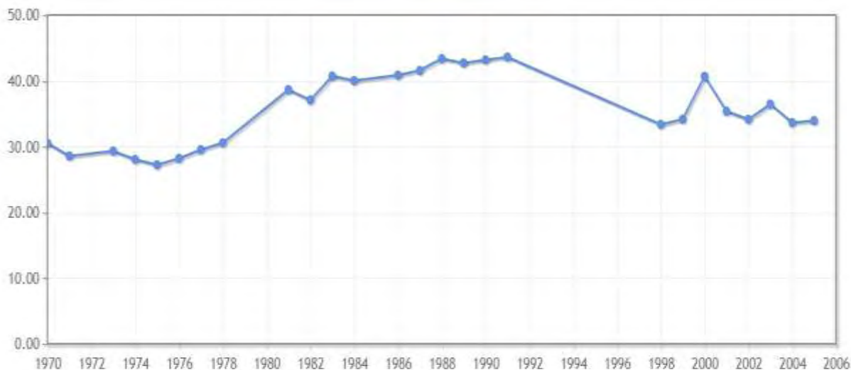
Εικόνα 1: Δαπάνες για τη δευτεροβάθμια εκπαίδευση 1970-2006.

Οι δαπάνες εκπαίδευσης αφορούν τις τρέχουσες δαπάνες λειτουργίας στην εκπαίδευση, συμπεριλαμβανομένων των μισθών και των μισθών και εξαιρουμένων των κεφαλαιουχικών επενδύσεων σε κτίρια και εξοπλισμό.