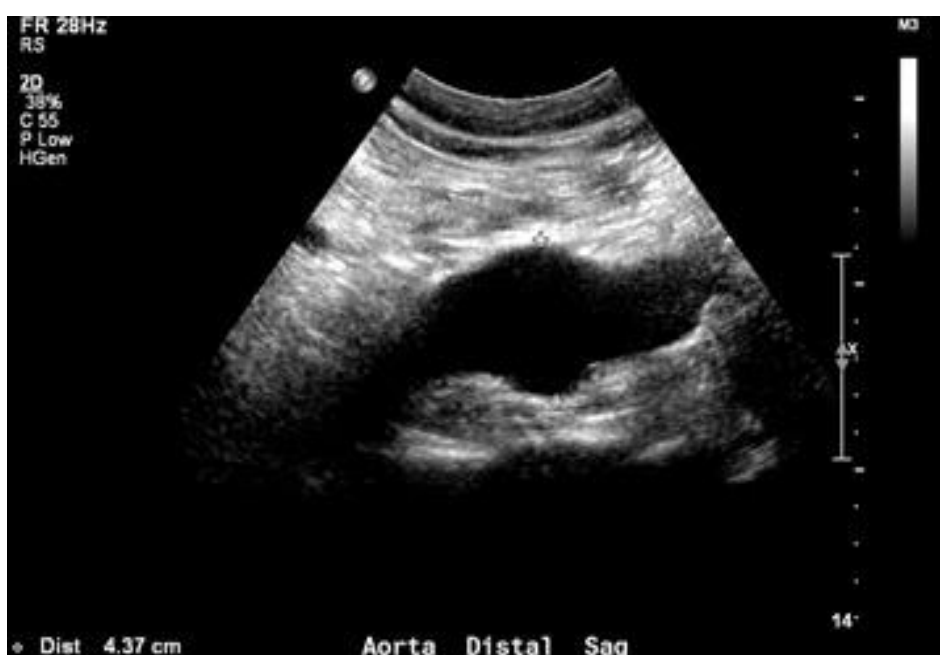
Εικόνα 3. Ανεύρυσμα της κοιλιακής αορτής και της κοινής λαγόνιας αρτηρίας (Kostun & Malik, 2016)

Υπάρχουν αντιφατικές απόψεις σχετικά με τους κινδύνους και τα οφέλη από την καθιέρωση προγραμμάτων υπερηχογραφικής εξέτασης ΑΚΑ λόγω των ποσοστών θνητότητας που συνδέονται με τη χειρουργική αποκατάσταση, ιδιαίτερα για τις περιπτώσεις ΑΚΑ που ποτέ δεν θα είχαν διαρρηχθεί αν δεν είχαν ανιχνευθεί μέσω του ελέγχου ή είχαν αφεθεί χωρίς να θεραπευθούν. Ωστόσο, ο έλεγχος υπερήχων είναι λογικά φθηνός και μη επεμβατικός, ενώ τα ΑΚΑ μπορεί να προκαλέσουν σημαντικό αριθμό θανάτων (Medical Advisory Secretariat, 2006).