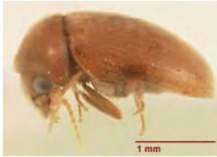
Εικόνα 1. Ενήλικο του είδους Lasioderma serricornis .