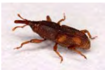
Εικόνα 8. Ενήλικο του είδους Sitophilus oryzae .

Το S. oryzae είναι πιο κοσμοπολίτικο από το συγγενικό του είδος S. granarius και απαντάται κυρίως σε υποτροπικές και τροπικές περιοχές, όπως Ινδία, Αυστραλία, Η.Π.Α, τα παράλια της Β. Αφρικής και κάποια μέρη της Κίνας (Σταμόπουλος, 2013). Μορφολογικά είναι παρόμοιο με το S. granarius . Το σώμα των ενηλίκων έχει μήκος 2,5 - 4,5 mm και χρώμα σκούρο καστανό. Κύρια διαφορά με το συγγενικό του είδος είναι ότι στα έλυτρά του έχει 4 ανοιχτόχρωμες κηλίδες, δυο σε κάθε έλυτρο, όπως επίσης και το ότι έχει ανεπτυγμένες τις μεμβρανώδεις πτέρυγες και μπορεί να πετά (Εικόνα 7). Η pronύμφη είναι ευκέφαλη, άποδη, λευκού χρώματος με καστανόχρωμη κεφαλή. Σε υψηλές θερμοκρασίες μπορεί να ξεπεράσει και τις 4 γενεές το έτος. Φτάνει στην αποθήκη πετώντας από τον αγρό, όπου το θηλυκό εναποθέτει τα αυγά του σε βοθρία που ανοίγει σε κάθε σπόρο. Κατά την διάρκεια της ζωής του ένα θηλυκό μπορεί να γεννήσει μέχρι και 500 αυγά. Η pronύμφη αναπτύσσεται μέσα στον σπόρο, από τον οποίο και τρέφεται. Βγαίνει από το σπόρο όταν ενηλικιωθεί και πετά προσβάλλοντας νέο προϊόν, ακόμα και στον αγρό. Προσβάλλει κυρίως ρύζι και σπόρους δημητριακών, αλλά και αλευρώδη προϊόντα, όσπρια, βαμβακόσπορο, ξηρούς καρπούς και ζωοτροφές.