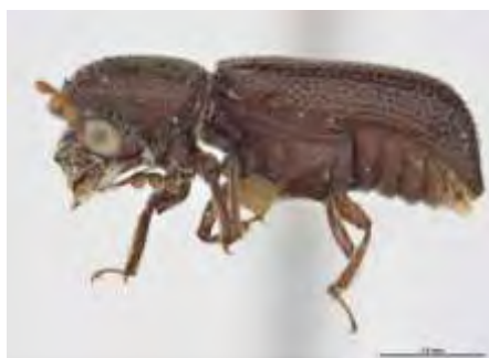
Εικόνα 5. Ενήλικο του είδους Prostephanus truncatus .

Το Prostephanus truncatus (Horn) προέρχεται από την Κεντρική και Νότια Αμερική (Lesne, 1897; Chittenden, 1911). Την δεκαετία του 1970 υπάρχουν αναφορές για προσβολές στο αποθηκευμένο καλαμπόκι από το P. truncatus σε πολλά μέρη ανά τον κόσμο, ιδιαίτερα στις τροπικές και υποτροπικές περιοχές (Shires, 1979; Howard, 1983). Το ενήλικο φτάνει σε μήκος τα 3 mm, έχει σχήμα κυλινδρικό και χρώμα καστανό. Η κεφαλή του καλύπτεται από τον θώρακα, ο οποίος φέρει χαρακτηριστικά εξογκώματα και τα έλυτρα φέρουν ευκρινείς κατά μήκος γραμμές από μικρά κοιλώματα (Εικόνα 5). Τα θηλυκά εναποθέτουν τα αυγά σε ομάδες των 20 εντός των σπερμάτων του αραβοσίτου (Hodges, 1982; Howard, 1983). Σε θερμοκρασία 32°C, ο βιολογικός του κύκλος διαρκεί 24-25 ημέρες (Bell and Watters, 1982). Ωστόσο, ζημιές μπορεί να προκαλέσει και σε καλλιέργειες καλαμποκιού στο χωράφι, πρώιμα όταν το σπέρμα έχει 40-50% υγρασία (Giles, 1975).