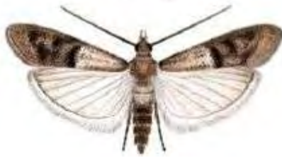
Εικόνα 15. Ενήλικο του είδους Plodia interpunctella .