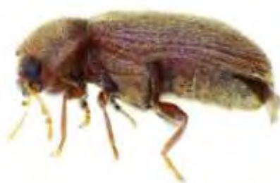
Εικόνα 3. Ενήλικο του είδους Stegobium paniceum .

βομβύκιο μέσα στο οποίο νυμφώνεται. Τα ενήλικα μπορεί να παραμείνουν στο βομβύκιο για ποικίλα χρονικά διαστήματα και δεν τρέφονται. Ζημιά στα αγροτικά προϊόντα προκαλεί η προνύμφη του είδους, η οποία είναι πολυφάγος. Προσβάλλει κυρίως αρτοσκευάσματα και ζυμαρικά αλλά και σπόρους, προϊόντα σπόρων, ελαιούχους πλακούντες, ξερά φρούτα και μπαχαρικά.