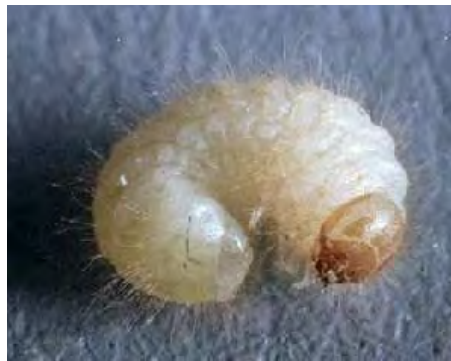
Εικόνα 2. Προνύμφη του είδους Lasioderma serricornis .