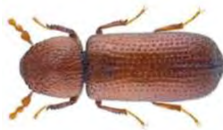
Εικόνα 4. Ενήλικο του είδους Rhizophorthera dominica .

°C) ο βιολογικός του κύκλος μπορεί να διαρκέσει μόλις 30 ημέρες, κατά μέσο όρο όμως ολοκληρώνεται σε 58 ημέρες (Koehler and Pereira, 1994).