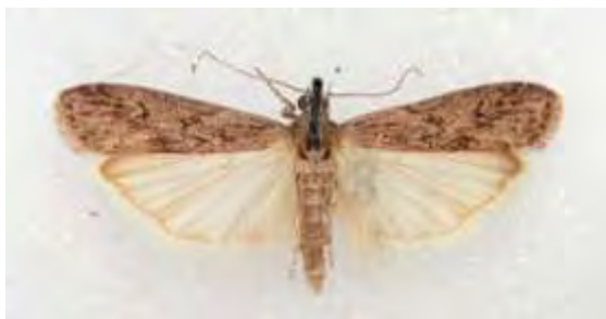
Εικόνα 14. Ενήλικο του είδους Ephestia kuehniella .

επιφάνεια των αλεύρων. Οι προνύμφες αφού τραφούν λίγο, υφαίνουν θήκες με μετάξινα νήματα μέσα στις οποίες αναπτύσσονται. Η διάρκεια του βιολογικού κύκλου του εντόμου αυτού διαφοροποιείται αναλόγως με το είδος του αλεύρου. Σύμφωνα με έρευνα του Balachowski (1972) όσες προνύμφες είχαν τραφεί με καλαμποκόλευρο συμπλήρωσαν τον βιολογικό τους κύκλο σε 83 ημέρες, όσες τράφηκαν με άλευρο κριθαριού σε 123 και όσες τράφηκαν με ρυζάλευρο σε 217 ημέρες.