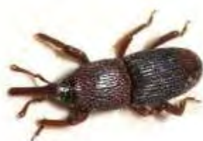
Εικόνα 7. Ενήλικο του είδους Sitophilus granarius .

Το S. granarius είναι κοσμοπολίτικο είδος, συναντάται σε εύκρατα αλλά και σε ψυχρά κλίματα, ενώ σε υποτροπικά η ανάπτυξή του είναι σχεδόν αδύνατη. Τα ενήλικα έχουν μήκος σώματος 3 - 5 mm και χρώμα σκούρο κάστανο έως μαύρο. Η κεφαλή καταλήγει σε ένα κυρτό ρύγχος, το οποίο αποτελεί τα 2/3 του πρόνωτου. Ο θώρακας είναι διάστικτος και έχει μήκος σχεδόν ίσο με αυτό των ελύτρων, τα οποία έχουν κατά μήκος ραβδώσεις (Εικόνα 6). Οι οπίσθιες μεμβρανοειδείς πτέρυγες δεν είναι ανεπτυγμένες και γι' αυτό τον λόγο δεν πετά. Η προνύμφη έχει μήκος 3 - 4 mm και είναι κοντόχοντρη με κιτρινωπό χρωματισμό. Έχει 4 - 5 γενεές τον χρόνο. Διαχειμάζει ως προνύμφη μέσα στους αποθηκευμένους σπόρους ή ως ενήλικο στους σωρούς σπόρων ή σε διάφορα σημεία της αποθήκης. Τα θηλυκά συνευρίσκονται με τα αρσενικά αμέσως μετά την έξοδο τους από τους σπόρους. Μετά από 2 εβδομάδες, αρχίζουν να τοποθετούν τα αβγά τους μεμονωμένα σε βοθρία που ανοίγουν στους σπόρους (ένα βοθρίο σε κάθε σπόρο). Ένα θηλυκό μπορεί να γεννήσει μέχρι και 400 αυγά, ανάλογα με την θερμοκρασία του χώρου και την σκληρότητα των σπόρων (Σταμόπουλος, 2013). Ζημιές στα αποθηκευμένα προϊόντα προκαλούν τόσο τα ενήλικα όσο και οι προνύμφες του είδους. Προσβάλλουν κυρίως σπόρους σιτηρών (σιτάρι, κριθάρι, σίκαλη κ.α.) αλλά και συμπαγή αμυλούχα προϊόντα (ξερό ψωμί, φρυγανιές, ζυμαρικά κ.α.).