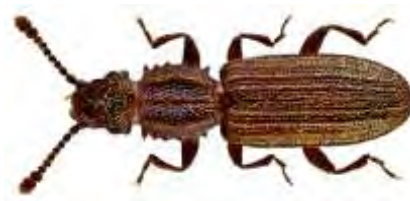
Εικόνα 10. Ενήλικο του είδους Oryzaephilus surinamensis .

Προσβάλλει κυρίως σιτηρά και προϊόντα αυτών, όπως ζυμαρικά, ψωμί και μπισκότα. Ζημιές ωστόσο μπορεί να προκαλέσει και σε ξηρά όσπρια, σταφίδες, κακάο, καφέ, σοκολάτα, αποξηραμένα φυτά και ελαιούχους σπόρους. Τα ενήλικα έχουν λεπτό, πεπλατυσμένο σώμα καστανού χρώματος, με μήκος 3 mm. Στο πάνω μέρος του θώρακα υπάρχουν δυο κατά μήκος αυλακώσεις, ενώ στα πλάγια αυτού υπάρχουν από 6 οδοντοειδείς προεξοχές σε κάθε πλευρά του (Εικόνα 9). Οι προνύμφες είναι νηματοειδείς, πεπλατυσμένες με υποκίτρινο χρώμα και φτάνουν σε μήκος τα 4mm. Είναι ευκέφαλες και σε κάθε τμήμα του σώματος φέρουν από μια σκουρόχρωμη ραχιαία κηλίδα. Σε άριστες συνθήκες περιβάλλοντος, δηλαδή θερμοκρασία 30 - 35 °C και σχετική υγρασία 70 - 90%, ολοκληρώνει τον βιολογικό του κύκλο σε 20 ημέρες περίπου. Η βέλτιστη θερμοκρασία για την ωοτοκία είναι 25 °C και η υγρασία των κόκκων πρέπει να είναι άνω του 10% (Brich, 1944). Τα θηλυκά τοποθετούν τα αυγά μέσα στον σπόρο από μια μικρά οπή που δημιουργούν και στη συνέχεια την σφραγίζουν με τις εκκρίσεις τους. Η εκκόλαψη τους γίνεται σε θερμοκρασίες μεταξύ 17,5 - 40 °C, ωστόσο σε θερμοκρασίες κάτω των 20 °C και πάνω από τους 37,5 °C και όταν η σχετική υγρασία είναι σε χαμηλά επίπεδα παρουσιάζουν υψηλή θνησιμότητα (Howe, 1956). Η νύμφωση γίνεται στο εσωτερικό του σπόρου και το ενήλικο εξέρχεται από αυτόν τρώγοντας το εσωτερικό του.