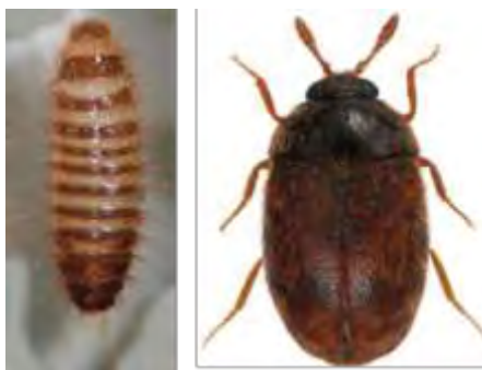
Εικόνα 9. Pronύμφη (αριστερά) ενήλικο (δεξιά) του είδους Trogoderma granarium .

Το T. granarium , θεωρείται από τα πλέον επιζήμια έντομα αποθηκών στις θερμές χώρες, ενώ στις ψυχρές περιοχές οι προσβολές του περιορίζονται σημαντικά. Σε πολλές χώρες θεωρείται έντομο-καραντίνας. Το σώμα των ενηλίκων φτάνει σε μήκος τα 2-3 mm και είναι ωσειδές με καστανό χρώμα. Οι προνύμφες φτάνουν σε μήκος τα 4-6 mm, έχουν ανοιχτό καστανό χρώμα, και το σώμα τους φέρει μακριές και λεπτές κοκκινωπές τρίχες, με εμφανή θύσανο τριχών στο τελευταίο κοιλιακό τμήμα (Εικόνα 8). Δραστηριοποιείται σε θερμοκρασίες μεταξύ 21 - 40 °C, με άριστη εκείνη των 35 °C, ενώ η χαμηλή σχετική υγρασία δεν το επηρεάζει σημαντικά. Τα ενήλικα δεν τρέφονται και την ζημιά προκαλεί εξ' ολοκλήρου η προνύμφη. Η αναπαραγωγή γίνεται στον σωρού του προϊόντος, με την προσβολή να μην είναι ορατή. Το θηλυκό μπορεί να γεννήσει μέχρι 125 αυγά, αραιά στην επιφάνεια των σπερμάτων. Σε ευνοϊκές συνθήκες ο βιολογικός κύκλος μπορεί να διαρκέσει μέχρι 30 ημέρες. Οι προνύμφες δεν διαχειμάζουν στο προϊόν, αλλά μεταναστεύουν σε σχισμές ή άλλες κρύπτες της αποθήκης. Το ενήλικο δεν τρέφεται, ενώ η προνύμφη μπορεί να έχει μακρά διάπαυση (έως και 8 έτη) και να νυμφωθεί όταν οι συνθήκες γίνουν ευνοϊκές (Σταμόπουλος, 2013). Εκτός από τις ζημιές που προκαλεί στα αποθηκευμένα προϊόντα, η παρουσία του μπορεί να προκαλέσει και σοβαρά προβλήματα στην δημόσια υγεία, όπως αλλεργικές αντιδράσεις.