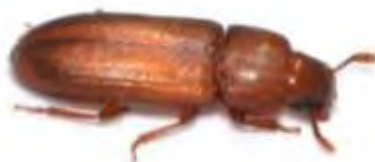
Εικόνα 12. Ενήλικο του είδους Tribolium castaneum .

Ο βιολογικός κύκλος του εντόμου ολοκληρώνεται σε ένα έτος περίπου. Τα θηλυκά σε ιδανικές συνθήκες θερμοκρασίας (32,5 °C) μπορούν να γεννήσουν έως και ένδεκα αυγά την ημέρα, ενώ καθ' όλη την διάρκεια ζωής του μπορεί να γεννήσει μέχρι και 1000 αυγά. Οι προνύμφες μέχρι την νύμφωση τους μένουν στον σπόρο. Τα ενήλικα προσβάλλουν μεγάλη ποικιλία τροφών όπως και το συγγενές είδος T. confusum και λόγω της μεγάλης προσαρμοστικότητας που εμφανίζουν μπορούν να επιβιώσουν και να αναπαραχθούν σε διάφορες συνθήκες.