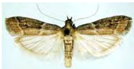
Εικόνα 13. Ενήλικο του είδους Ephestia elutella .

έχουν άνοιγμα πτερύγων περίπου 17 mm. Οι μπροστινές πτέρυγες έχουν τεφροκάστανο χρώμα με δυο εγκάρσιες κυματοειδείς γραμμές, ενώ οι πίσω είναι ανοιχτόχρωμες (Εικόνα 13). Η προνύμφη έχει μήκος 12 mm, χρώμα υπόλευκο κιτρινωπό ή ρόδινο, ανάλογα με την τροφή που τρώει, με καστανή κεφαλή και θωρακική πλάκα. Στα νώτα και στα πλάγια κάθε σωματικού δακτυλίου φέρει καστανά στίγματα από τα οποία εξέρχεται μια τρίχα. Στη χώρα μας, διαχειμάζει ως ανεπτυγμένη προνύμφη μέσα σε βομβύκιο σε αποθήκες. Τα ενήλικα, τα οποία εμφανίζονται τον Απρίλιο, ωτοκοούν στην επιφάνεια των προϊόντων 100 - 250 αυγά το καθένα. Οι προνύμφες τρέφονται με το έλασμα των φύλλων του καπνού από τον μίσχο προς την κορυφή. Προτιμούν καπνά με υψηλά ποσοστά σακχάρου και χαμηλά ποσοστά νικοτίνης. Σε ιδανικές συνθήκες θερμοκρασίας και σχετικής υγρασίας (τροπικά και εύκρατα κλίματα) έχει 2 - 3 γενεές το έτος.