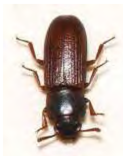
Εικόνα 11. Ενήλικο του είδους Tribolium confusum .

Το T. confusum , κοινώς σκαθάρι ή ψείρα των αλεύρων (confused flour beetle) αναπτύσσεται καλύτερα και ταχύτερα σε σπασμένους παρά σε ολόκληρους σπόρους (Σταμόπουλος, 2008). Προσβολές στα αποθηκευμένα προϊόντα προκαλούν τόσο τα ενήλικα όσο και οι προνύμφες του είδους. Προσβάλουν κυρίως σιτηρά, όσπρια, αλεύρι σιταριού και κεχριού, σιμιγδάλι, ξηρά λαχανικά, γλυκοπατάτα, ζωοτροφές, κακάο, μαύρο πιπέρι κ.α. Οι ζημιές είναι ανάλογες με την σχετική υγρασία του προϊόντος. Τα ενήλικα έχουν μακρόστενο και πεπλατυσμένο σώμα μήκους 4 - 4,5 mm καστανοκόκκινου χρώματος (Εικόνα 10). Η προνύμφη του είδους είναι ολιγόποδη, λευκοκίτρινου χρώματος, εκτός από την κεφαλή και το δίκρανο του τελευταίου κοιλιακού τμήματος που έχουν σκούρο καστανό χρώμα και φτάνει σε μήκος τα 5 mm. Το μορφολογικό χαρακτηριστικό του T. confusum που το διαφοροποιεί από το T. castaneum είναι ότι τα άρθρα της κεραίας του πλαταίνουν βαθμιαία ενώ του T. castaneum σχηματίζουν ρόπαλο (Σταμόπουλος, 2013). Διαχειμάζει ως ενήλικο μέσα στα προσβεβλημένα προϊόντα ή σε προφυλαγμένα σημεία της αποθήκης. Τα ενήλικα θηλυκά, τα οποία μπορούν να ζήσουν έως και 3 έτη σε άριστες συνθήκες (28 - 30 °C), παράγουν από 400 έως και 800 αυγά πάνω στα προϊόντα. Οι προνύμφες εκκολάπτονται όταν η θερμοκρασία είναι 15 - 40 °C, ενώ η σχετική υγρασία δεν παίζει σπουδαίο ρόλο. Η προνύμφη ολοκληρώνει την ανάπτυξή της σε 1 - 3 μήνες, αναλόγως της ποσότητας τροφής, της θερμοκρασίας και της σχετικής υγρασίας (Howe, 1960).