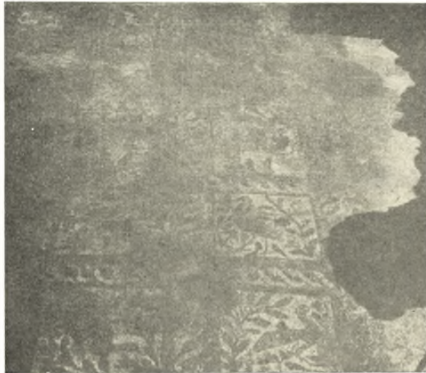
Εἰκ. 3. Τμήματα τοῦ ἀνευρεθέντος ψηφιδωτοῦ δαπέδου τῆς δεξιᾶς στοᾶς τοῦ αἵθριου τῆς βασιλικῆς Γ τῆς Ν. Ἀγγιάλου.

Ἡ ἀποκάλυψις ὁμοῦς τῆς στοᾶς ταύτης ἔφερεν εἰς φῶς καὶ τὰς κατὰ και-