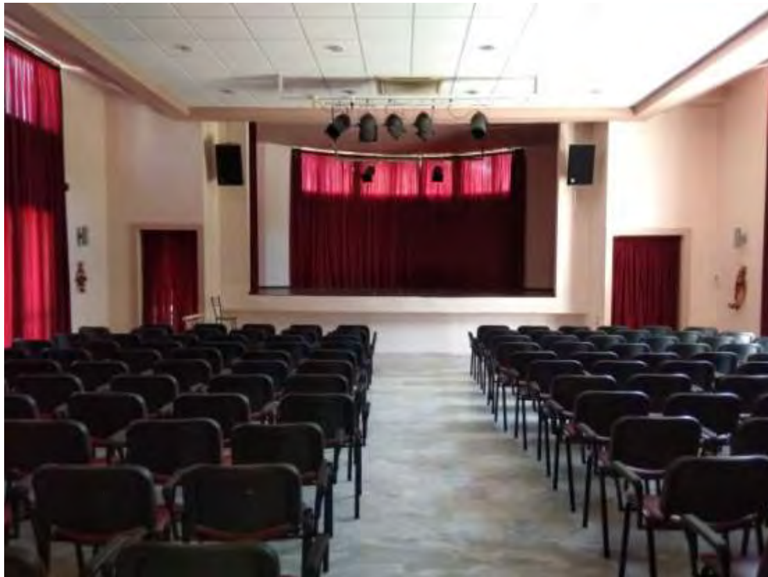
( Εικ.3 Το αμφιθέατρο εντός του Ορφανοτροφείου)