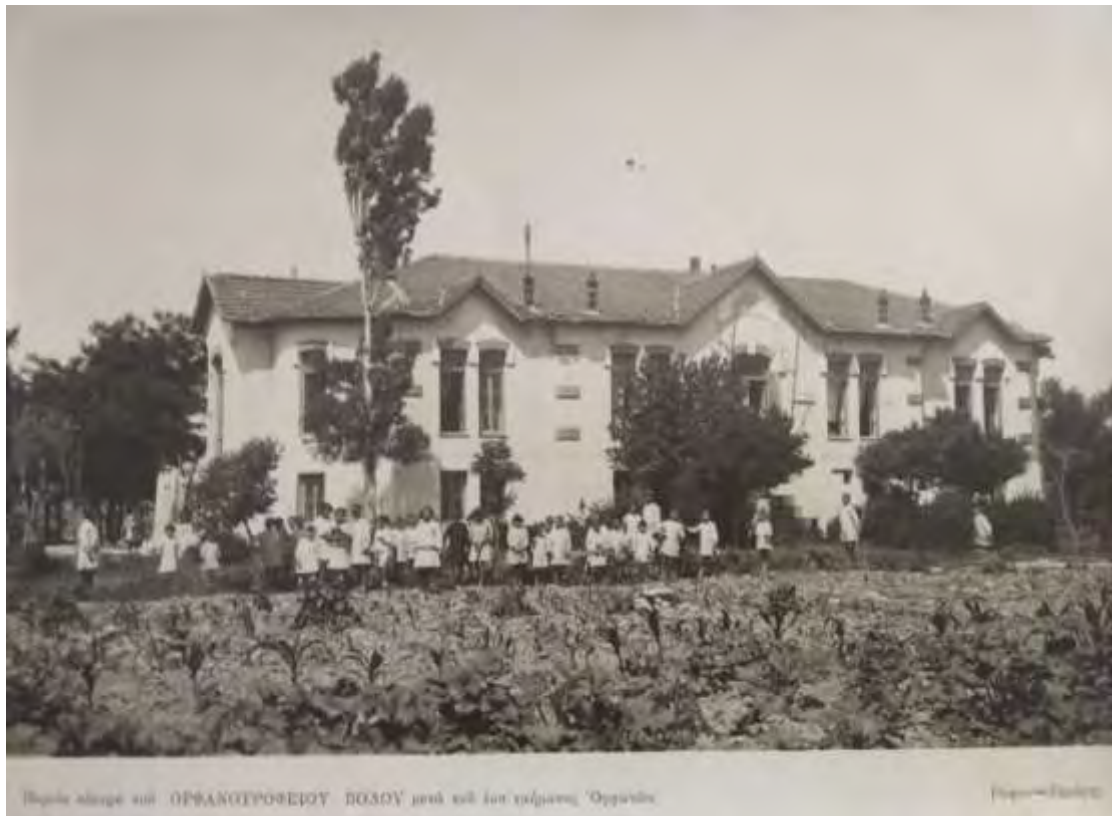
( Εικ.4 Φωτογραφία παλαιῶν τροφίμων κατὰ τὴ δεκαετία τοῦ 40)