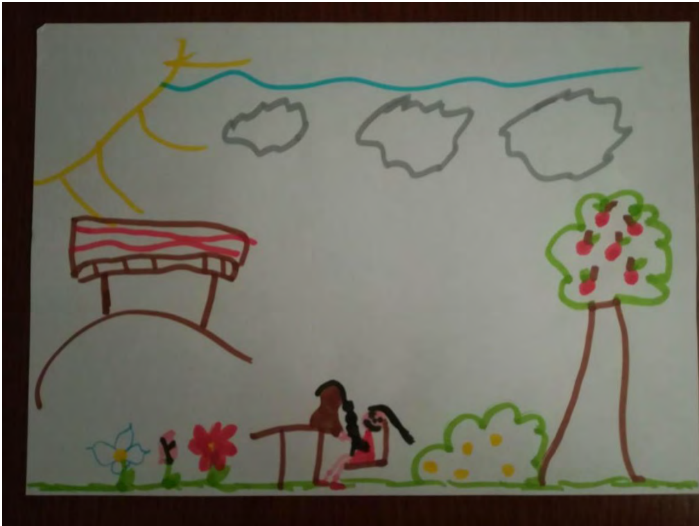
Σχ. 5: Ενδεικτικό σχέδιο που απεικονίζει το φυσικό περιβάλλον ως στοιχείο του χώρου παιχνιδιού παιδιού αγροτικής προέλευσης