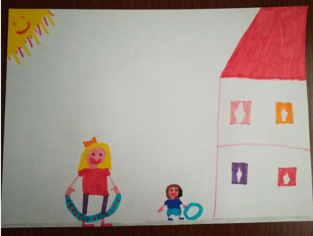
Σχ. 6: Ενδεικτικό σχέδιο που απεικονίζει τον ήλιο, στοιχείο του φυσικού περιβάλλοντος, ως στοιχείο στο χώρο παιχνιδιού παιδιού αγροτικής προέλευσης