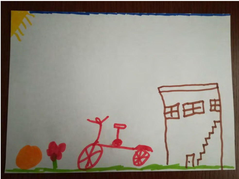
Σχ. 7: Ενδεικτικό σχέδιο που απεικονίζει την αυλή, στοιχείου του ανθρωπογενούς περιβάλλοντος, ως χώρο παιχνιδιού παιδιού αγροτικής προέλευσης