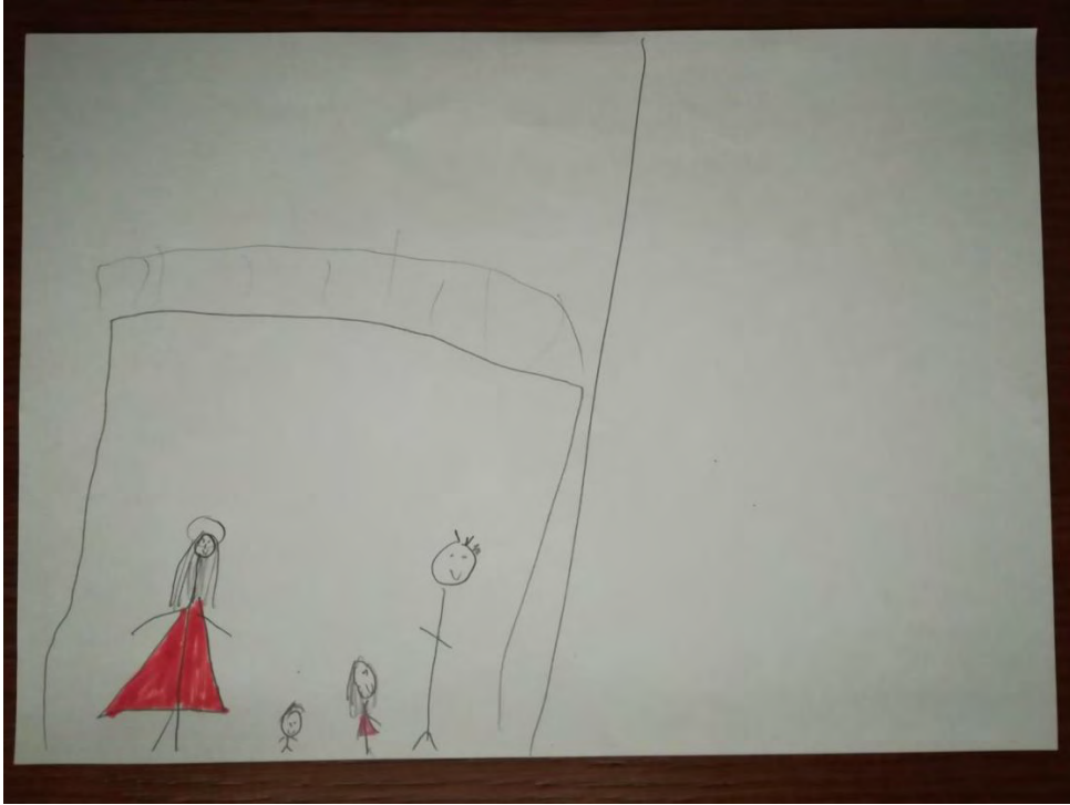
Σχ. 4: Ενδεικτικό σχέδιο που απεικονίζει τον άνθρωπο, στοιχείο του κοινωνικού περιβάλλοντος, ως στοιχείο του άμεσου περιβάλλοντος παιδιού αστικής προέλευσης