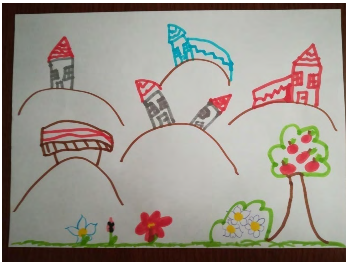
Σχ. 2: Ενδεικτικό σχέδιο που απεικονίζει τα φυτά, στοιχείο του φυσικού περιβάλλοντος, ως στοιχείο του άμεσου περιβάλλοντος παιδιού αγροτικής προέλευσης