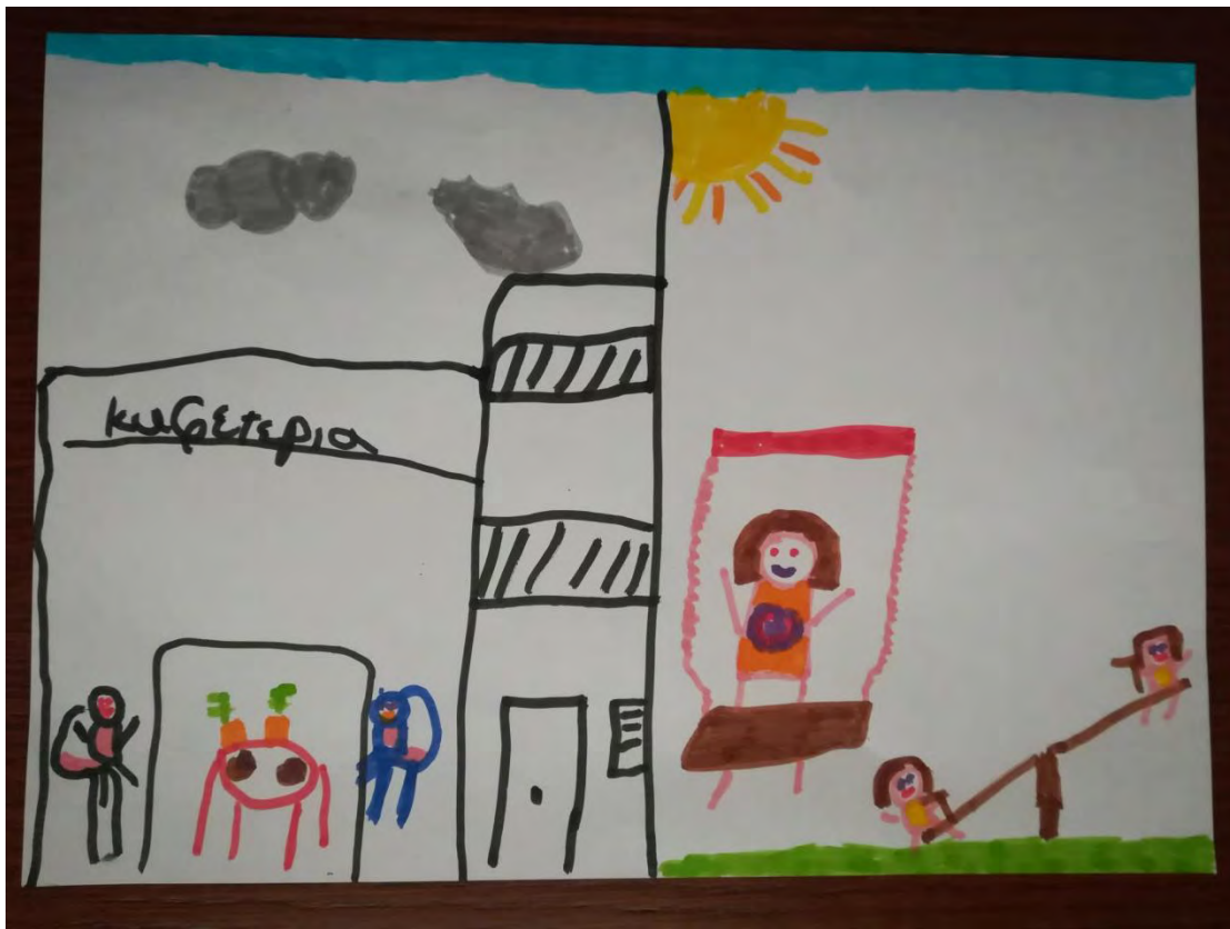
Σχ. 1: Ενδεικτικό σχέδιο που απεικονίζει το κοινωνικό περιβάλλον ως στοιχείο του άμεσου περιβάλλοντος παιδιού αστικής προέλευσης