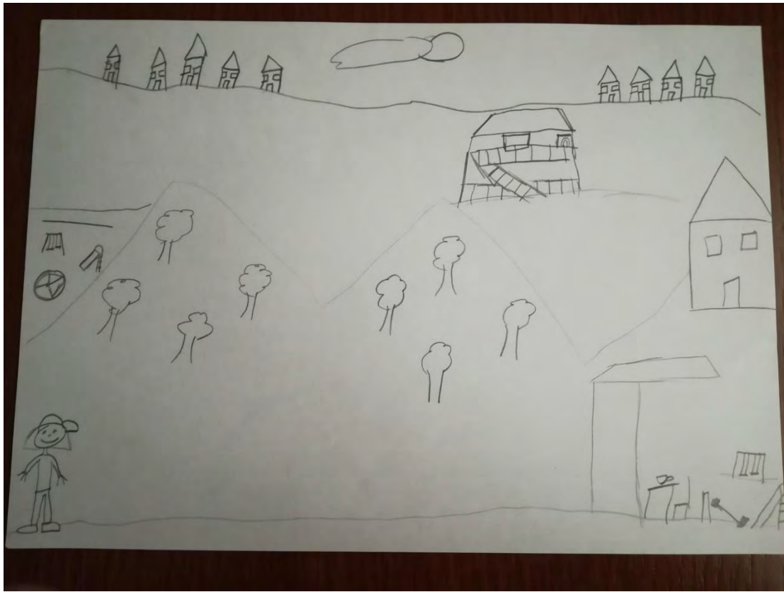
Σχ. 8: Ενδεικτικό σχέδιο παιδιού αγροτικής προέλευσης που συνδυάζει στοιχεία του φυσικού, του ανθρωπογενούς και του κοινωνικού περιβάλλοντος