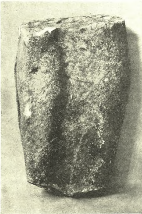
Εἰκ. 6. Αἱ κνήμαι ἀρχαϊκῆς Ναξιακῆς κόρης.

κοιλὰς καταβαίνουσα ὑπὸ μορφὴν ρευμάτων ἀνωμάλως πρὸς τὴν θάλασσαν. Ἡ σημερινὴ ὄψις τοῦ τόπου εἶναι προδήλως καὶ ἀναμφιβόλως ἀποτέλεσμα βιαίων γεωλογικῶν μεταβολῶν, μαρτυρουμένων μάλιστα ρητῶς διὰ γειτονικὴν περιοχὴν πρὸ ἑκατὸν περίπου ἐτῶν (βλ. L. Ross, Inselreisen 2 I σ. 32). Ἀπτόν δὲ τεκμήριον τούτου ἦσαν δύο μεγάλοι μαρμαρίνοι ὄγκοι ἐπιμελῶς εἰργασμένοι φέροντες ἀναθύρωσιν καὶ κυμάτια καὶ ἀνήκοντες ἴσως εἰς βάσιν