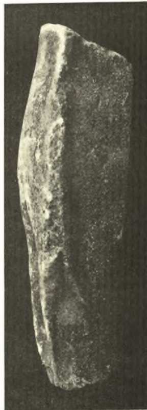
Εἰκ. 7. Ἀριστερὰ πλευρὰ τῆς κόρης τῆς εἰκ. 6.

γ') Χαλκᾶ . Ἐν ἀφθονίᾳ εὐρέθησαν γεωμετρικαὶ πόρπαι διαφόρων