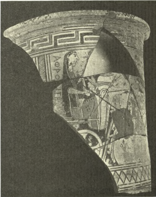
Εἰκ. 1. Ὁ λαιμὸς τοῦ ἀμοφορέως τῆς Ἀφροδίτης : ἀριστερὸν ἄκρον: Ἀφροδίτη καὶ Ἄρης ἐφ' ἄρματος.

Ἀφορμὴν εἰς τὴν ἀνασκαφὴν μας ἔδωσεν ἄφ' ἑνὸς ἢ κατὰ τὰ τελευταῖα ἔτη ἀποκάλυψις γεωμετρικῶν τάφων κατὰ τὴν θεμελίωσιν τοῦ Γυμνασίου Νάξου καὶ τὴν κατασκευὴν τῆς παρ' αὐτὸ διερχομένης ἐθνικῆς ὁδοῦ (βλ. Ἀρχαιολ. Δελτίον 14, 1935, Παράρτ. σ. 50), ἄφ' ἑτέρου δὲ ἢ ἐν ἔτει