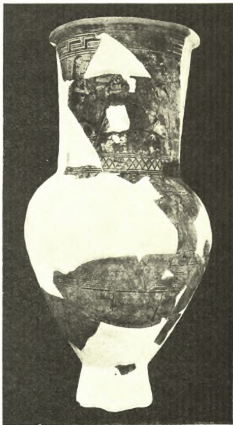
Εἰκ. 3. Ὁ ἀμφορεὺς τῆς Ἀφροδίτης.

προδήλως ἐκ τάφων συληθέντων παλαιότερον 1 . Εἰς δὲ τὴν περιοχὴν τοῦ Γυμνασίου ἠνοιξαμεν πέντε τάφους γεωμετρικούς, ἕξ ὧν ὡς μᾶλλον ἐνδιαφέροντας μνημονεύομεν ἐνταῦθα δύο. Ὁ πρῶτος εὑρίσκεται ἀμέσως δεξιὰ τῆς δημοσίας ὁδοῦ παρὰ τὴν ΒΔ γωνίαν τοῦ ἐκκλησιδίου τῆς Ἁγίας Θεοδοσίας καὶ ἐν μικρῷ μέρει ὑπὸ τὸν βόρειον τοῖχον τῆς ἐκκλησίας λελαξευμένος ἐντὸς τοῦ ἕξ εὐθύπτου γρανίτου ἐδάφους (εἰκ. 4). Αἱ διαστάσεις του εἶναι: μῆκος 2,22, πλάτος 0.70 καὶ βάθος 0.40 μ. Ὁ τάφος ἦτο ἀδιατάρακτος ἐκτὸς κατὰ τὰ ἀνώτατα χῶματα μετακινηθέντα ὀλίγον κατὰ τὴν θεμελίωσιν τῆς ἐκκλησίας. Λόγῳ τοῦ ἐξαιρετικῶς εὐθύπτου τοῦ γρανίτου καὶ τῆς ἐν τῷ τάφῳ ἐπικρατούσης μεγάλης ὑγρασίας δὲν ἠδυνήθημεν νὰ ἀναγνωρίσωμεν ἐκ τοῦ σκελετοῦ, εἰμὴ ὀλίγα τεμάχια τοῦ κρανίου κατὰ τὴν ΝΔ γωνίαν τοῦ τάφου. Ἡ μεγάλη ὑγρασία ἔβλαψε σημαντικῶς καὶ τὰ κτερίσματα τοῦ τάφου καταστήσασα ἕξιτηλον τὸν διάκοσμον τῶν ἀγγείων, ὁ ὁποῖος ἐκόλλησεν ἐπὶ τῶν περιβαλλόντων χωμάτων. Ἦσαν δὲ τὰ κτερίσματα πολυάριθμα καὶ σημαντικά: τὰ ἀγγεῖα (σκύφοι, οἶνοχοαί, πυξίδες κτλ.) ὑπερβαίνουν τὰ δεκαπέντε, ἰδιαιτέρως ὁμως μνείας ἀξία εἶναι περὶ τὰ τριάκοντα πῆλινα εἰδῶλια γεωμετρικὰ τὴν διαμόρφωσιν (ὑψηλοὶ καὶ κατακόρυφοι λαιμοὶ καὶ πόδες, ὑποτυπώδη πτερυγία ἀποτελοῦντα μετὰ τοῦ κορμοῦ μίαν ἐπίπεδον ἐπιφάνειαν κατὰ τρόπον ἐνθυμίζοντα τὴν σχηματοποίησιν τῶν ἄλλως ἀσχέτων βεβαίως μυκηναϊκῶν εἰδῶλιων) καὶ τὴν διακόσμησιν (συνδυασμοὶ εὐθειῶν καὶ καμπύλων γραμμῶν). Ἀκριβε-