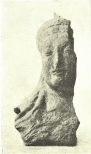
Εἰκ. 8. Πηλίνη γυναικεία προτομή ἐκ πλαστικοῦ σειρηνομόρφου ἀγγείου.

δ') ῾Οστείνα καὶ διάφορα : ἐκ τούτων μνημονεύομεν ἀπὸ τοῦδε ὁστέινον πλακίδιον μεθ' ἱερογλυφικῆς ἐπιγραφῆς, σκαραβαῖον ὁμοίως ἐπιγεγραμμένον καὶ ψήφους ἠλέκτρον καὶ ὑαλομάζης.