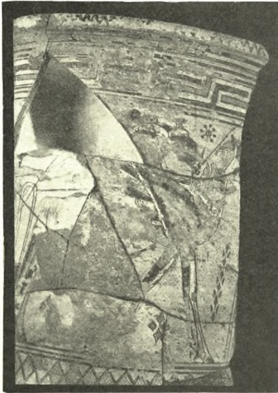
Εἰκ. 2. Τὸ δεξιὸν ἄκρον τοῦ λαιμοῦ τοῦ ἀμφορέως τῆς Ἀφροδίτης. Οἱ πτερωτοὶ ἵπποι τοῦ ἄρματος.

1. Τάφοι. Καὶ ἐντὸς μὲν τῆς οἰκίας Παπαδοπούλου δὲν μᾶς ἐπετράπη δυστυχῶς νὰ σκάψωμεν· ὅθεν περιορίσθημεν εἰς τὸ νὰ ἐρευνήσωμεν τὰ πρὸ