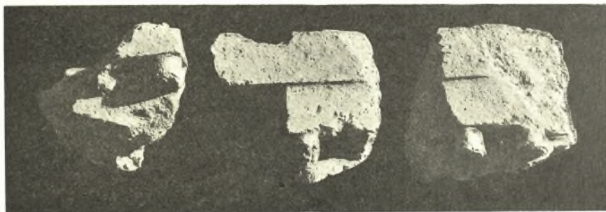
Εἰκ. 3. Τεμάχια ἐπιστυλίων ἐκ τοῦ ἀρχαίου ναοῦ τῆς Ἀρτέμιδος.

θανάτατα καὶ αὐτὸς ὑπὸ τοῦ μεγάλου σεισμοῦ τοῦ 250 μ. Χ., ἀνεκτίσθη κατὰ τοὺς μετέπειτα χρόνους ὥς χριστιανικὴ ἐκκλησία· τοῦτο ἀποδεικνύουσιν οὐ μόνον σταυροὶ λαξευθέντες ἐπὶ τοῦ πετρώματος, ἐφ' οὗ ἐκτίσθη ὁ ναός,