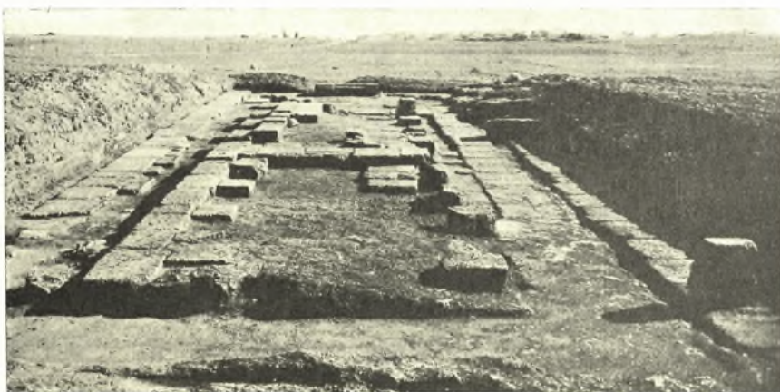
Εἰκ. 1. Ἀποψὶς τῶν θεμελίων τοῦ εἰκαζομένου ναοῦ τῆς Ἀρτέμιδος.

Ἡ κατὰ τὸ ἔτος 1937 ἀνασκαφικὴ ἐν Σικυνῶνι ἐργασία ἐστράφη ἀφ' ἐνὸς μὲν εἰς τὴν ἀποκάλυψιν τοῦ σκάμματος τοῦ Γυμνασίου, ἀφ' ἑτέρου δ' εἰς τὴν ὁλοσχερῇ ἐκκαθάρισιν τοῦ εἰκαζομένου ναοῦ τῆς Ἀρτέμιδος 1 . Καὶ ἡ μὲν ἀνασκαφὴ τῆς αὐλῆς τοῦ Γυμνασίου ἀπέδωκε μόνον τεμάχια τινὰ πηλίνων ἀκροκεράμων τοῦ κτηρίου καὶ τινὰ ἀσήμαντα θραύσματα ἀρχιτεκτονικῶν