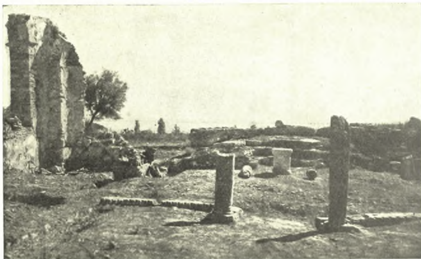
Εἰκ. 8. Ἀποψις τῆς παρὰ τὸ βόρειον τεῖχος μικρᾶς βασιλικῆς.

ἔχει ἀφαιρεθῆ, κατεστραμμένοι δὲ εἶναι καὶ οἱ στυλοβάται τῶν δύο κιονοστοιχιῶν, αἵτινες ἐχώριζον τὸν ναὸν εἰς τρία κλίτη. Τοῦναντίον ὅλη σχεδὸν ἡ ἐκ ποικιλοσχημῶν καὶ ποικιλοχρῶμων τεμαχίων μαρμάρων στρώσις τοῦ νάρθηκος διατηρεῖται κατὰ χώραν. Παρὰ τὴν Ν. Δ. γωνίαν τοῦ νάρθηκος εὐρέθη ὀρθογώνιον δωμάτιον, ἴσως σκευοφυλάκιον, πρὸ δὲ τῶν δύο θυρῶν τῆς δυτικῆς πλευρᾶς τοῦ νάρθηκος εὐρέθησαν αἱ βάσεις δύο δικιονίων προστώων (εἰκ. 9).