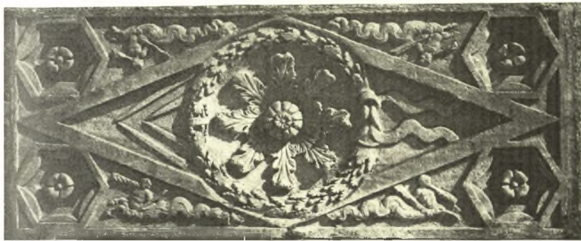
Είκ. 3. Ρωμαϊκὸν φάνωμα χρησιμοποιηθὲν εις τὴν διακόσμησιν τοῦ χριστ. ἄμβωνος.