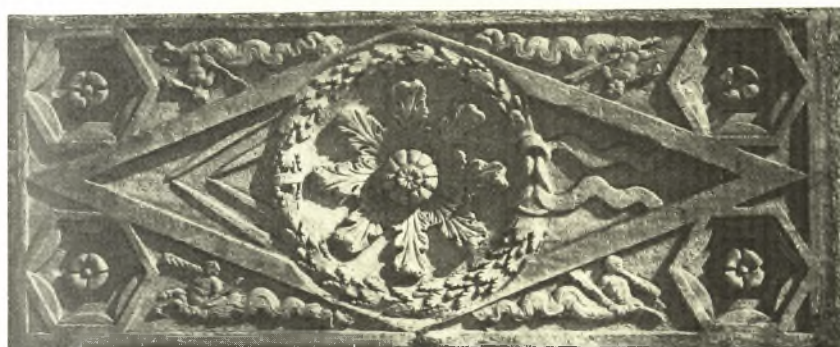
Εἰκ. 3. Ρωμαϊκὸν φάντωμα χρησιμοποιηθὲν εἰς τὴν διακόσμησην τοῦ χριστ. ἁμβωνος.