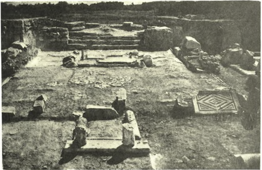
Εἰκ. 1. Ἄποψις τοῦ πρεσβυτερίου τῆς μεγάλης βασιλικῆς.

Α' Τὸ ἀνασκαφὸν μνημεῖον εἶναι μεγάλη πεντάκλιτος βασιλικὴ σχηματιζομένη διὰ τεσσάρων κιονοστοιχιῶν, ἐκάστη τῶν ὧπιων ἔφερε 12 κίονας.