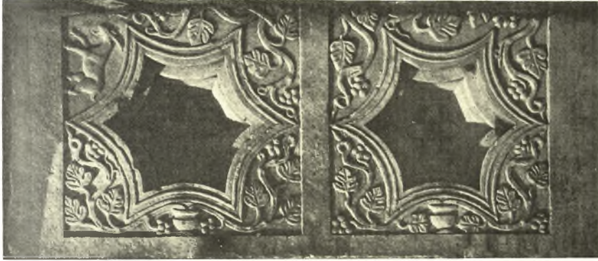
Είκ. 2. Ρωμαϊκά φατνώματα χρησιμοποιηθέντα εις την διακόσμησιν του χριστιανικού ἄμβωνος.