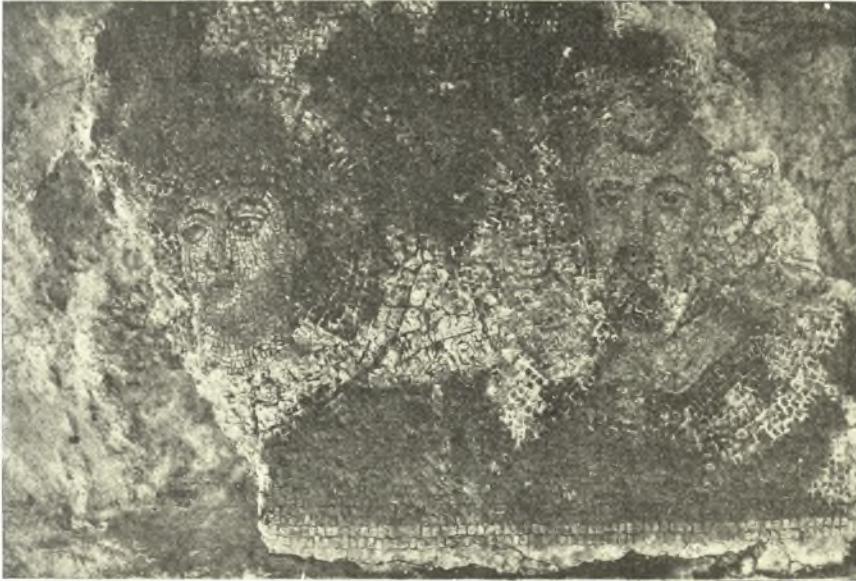
Εἰκ. 7. Ψηφιδωταὶ προτομαὶ τῶν κτιτόρων τοῦ ναοῦ.

Τὸ βᾶθρον τοῦτο (διαμ. 1,35 μ. εἰκ. 6) ἑλληνιστικῶν πιθανώτατα χρόνων, τίς οἶδε πόθεν μεινεχθέν, κοσμεῖται δι' ἀναγλύφων παραστάσεων μαχομένων