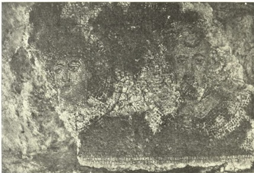
Εἰκ. 7. Ψηφιδωταὶ προτομαὶ τῶν κτιτόρων τοῦ ναοῦ.

Τὸ βάθρον τοῦτο (διαμ. 1,35 μ. εἰκ. 6) ἑλληνιστικῶν πιθανώτατα χρόνων, τίς οἶδε πόθεν μεινεχθέν, κοσμεῖται δι' ἀναγλύφων παραστάσεων μαχομένων