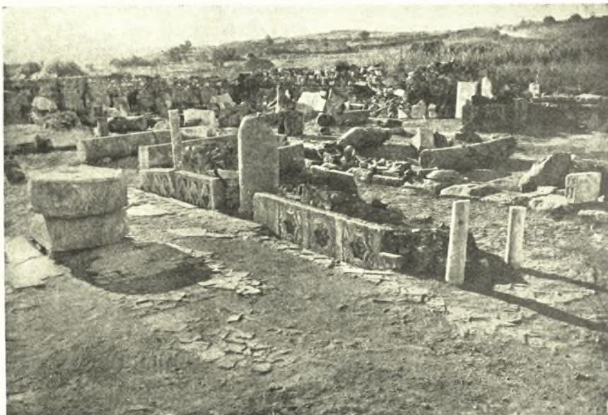
Εἰκ. 5. Ἀποψὶς τοῦ χριστιανικοῦ ἁμβωνοῦ τῆς μεγάλης βασιλικῆς.