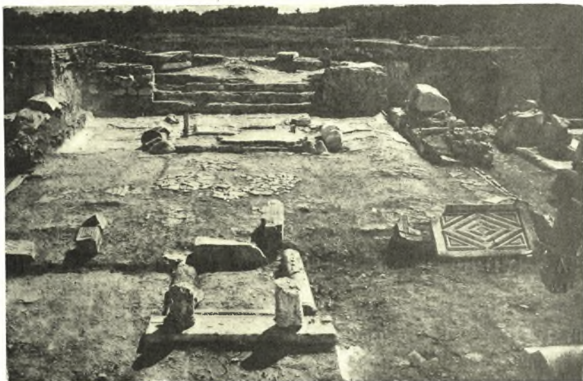
Εἰκ. 1. Ἀποψὶς τοῦ πρεσβυτερίου τῆς μεγάλης βασιλικῆς.

Α' Τὸ ἀνασκαφὲν μνημεῖον εἶναι μεγάλη πεντάκλιτος βασιλικὴ σχηματιζομένη διὰ τεσσάρων κιονοστοιχιῶν, ἐκάστη τῶν ὧν ὁποίων ἔφερε 12 κίονας.