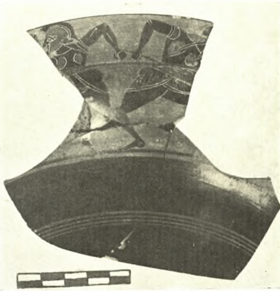
Εἰκ. 2. Μέρος μελανομόρφου κύλικος ἐκ Καβάλας.

Ἐν Καβάλα —Τὴν παράθεσιν ὀλίγων σχετικῶς ὄστράκων ἐν τῇ μελέτῃ ἡμῶν «Νεάπολις-Χριστούπολις-Καβάλα» (ΑΕ 1936, σ. 7 εἰκ. 9), καθὼς καὶ τὴν ὑπόθεσιν, ὅτι τὸ ἱερὸν τῆς Παρθένου Θεᾶς ἔπρεπε νὰ τοποθετηθῇ ἐπὶ τῇ βάσει τῶν μέχρι τότε εὐρημάτων εἰς τὸ ἔναντι τῶν σημερινῶν γραφείων τῶν ἐν Καβάλα Αἰγυπτιακῶν Βακουφικῶν κτημάτων (ΑΕ ἔ. ἄ. σ. 36 εἰκ. 2, I, ἐνταῦθα εἰκ. 1) οἰκόπεδον, ἦλθε τυχαίως νὰ ἐπαυξήσῃ καὶ νὰ ἐπιβεβαιώσῃ