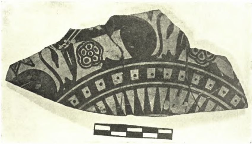
Εἰκ. 4. Ναυκρατικὸν ὀστράκον ἐκ Καβάλας.

Ναυκρατικῶν (Χιακῶν (;) εἰκ. 4-5), Λακωνικῶν ἀγγείων, ἀξιοσημείωτα εἶναι καὶ τὰ ἐξῆς μικροεργήματα : δύο κεφαλαὶ πηλίνων εἰδωλίων τῆς πολοφόρου θεᾶς καὶ ἄλλα τμήματα προφανῶς τῆς ἰδίας κρατούσης ἐπὶ τοῦ στήθους περιστεράν, ἡμίτομον καρποῦ ροιᾶς, εἰδῶλια ζῶων καὶ πέλεκυς ἀμφίστομος ὀστείνως διάτρητος (Artemis Orthia πίν. CLXIII 6 καὶ πίν. CLXVI 2). Καὶ ὅσον ἀφορᾷ μὲν εἰς τὴν θρυμματώδη τῶν εὐρημάτων κατάστασιν, αὕτη εἶναι γνωστὴ ἐκ παρομοίων εὐρημάτων βόθρων καὶ θυσιῶν, τὸ ὅτι ὅμως ἐλάχιστα μεγάλα μέρη ἀγγείων ἠδυνήθημεν ν' ἀποτελέσωμεν ἐκ πολλῶν συνανηκόντων ὀστράκων, ὀφείλεται εἰς τὸ γεγονός, ὅτι δυνατὸν μέρος τοῦ περιεχο-