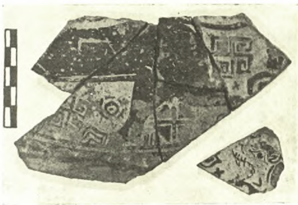
Εἰκ. 3. Μέρος Μηλιακοῦ πινακίου μετὰ παραστάσεως λέοντος ἐκ Καβάλας.

Ἐντὸς τῆς τέφρας τῶν πυρῶν, πλήρους ὀστῶν ζώων (κυρίως προβάτων), θαλασσίων ὀστρέων καὶ ἀνθράκων, εὐρέθησαν ἀμύπολλα ὄστρακα, τῶν ὁποίων ὁ ἀριθμὸς μεγάλως ἠῦξήθη διὰ τῆς κατὰ τὸν παρελθόντα Ἰουλίον, δαπάναις τῆς Ἀρχαιολογικῆς Ἑταιρείας, διενεργηθείσης ἐρεῦνης. Ἐκ τῶν 4000 περι-