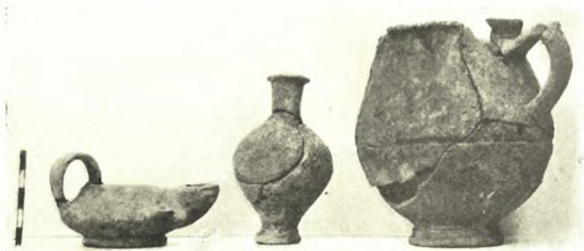
Εἰκ. 2. Κτερίσματα τοῦ τάφου Καλαμίτσας.

Τάφος — Ἐπὶ τῆς ὁδοῦ Καβάλας-Καλαμίτσας καὶ ἔναντι περιπόου τοῦ ἑξοχικοῦ ἐκκλησιδίου Παναγούδας εὐρέθη συγχρόνως μὲ τὴν ἀνασκαφὴν ὑπὸ