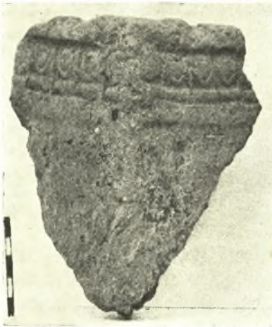
Εἰκ. 1. Πηλίνη βᾶσις μετ' Ἴωνικοῦ κυματίου ἐκ Καλαμίτῳ.

Ἐν Καλαμίτῳ — Ἡ ἐν Καλαμίτῳ ἀνασκαφῇ διεξαχθεῖσα ἐφέτος εἰς τὸν μεταξὺ τῶν σημείων I καὶ II τοῦ παρενθέτου πίνακος A τῶν ΠΑΕ