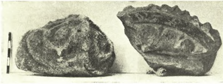
Εἰκ. 6. Μαρμάρινον ἀνθέμιον καὶ πηλίνη ἡγεμών κέραμος ἐκ Καβάλας.

Ἐν τῇ παρὰ τὰς πυρὰς ἐπιχώσει εὐρέθησαν καὶ τὰ ἐν τῇ εἰκόνι 6 παρατιθέμενα θραύσματα μαρμαρίνου ἀνθемίου καὶ πηλίνης ἡγεμόνος κέραμου. Τὸ ὀδοντωτὸν περίγραμμα τῆς δευτέρας καθὼς καὶ τὰ λευκά, ἐρυθρὰ καὶ καφεῖ χρώματα τοῦ ἀναγλύφου ἀνθемίου τῆς ἀνάγουσιν ἡμᾶς εἰς κεραμώσεις ἀρχαϊκῶν γνωστῶν ἄλλοθεν τύπων.