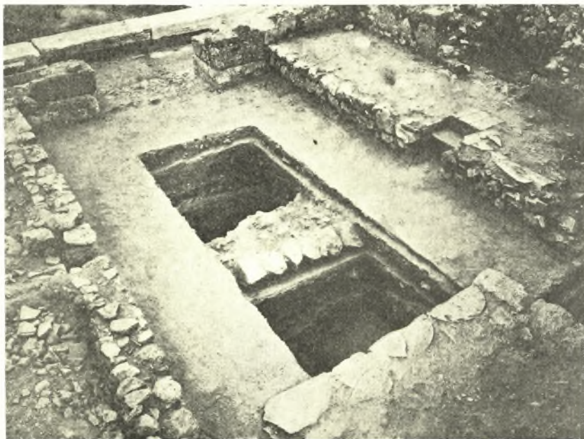
Εἰκ. 14. Σκαφή ἐντὸς τοῦ Μιθραίου.

Μικρὰ σκαφή ἔγινεν ἐπίσης πρὸς ἔρευναν τοῦ ὑπεδάφους τοῦ Μιθραίου, τὸ ὁποῖον ἐκτίσθη ἐπὶ τοῦ τοίχου τῆς ἀνατολικῆς πλευρᾶς τοῦ περιβόλου τῆς