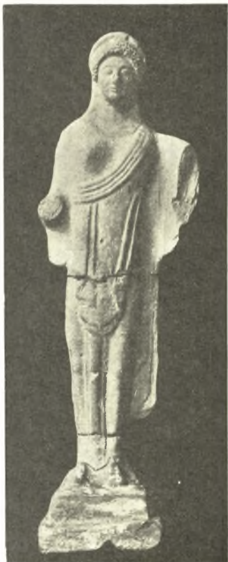
Εἰκ. 8. Πήλινον εἰδῶλιον ἐκ τῆς «ἱερᾶς οἰκίας».

Ἡ οἰκία μετὰ τὸν ἑβδομον αἰῶνα εἶχε καταστραφῇ, ἀλλ' ἡ λατρεία ἐξηκολούθησεν ἐπὶ τῆς θέσεώς της, ἔμπρὸς δὲ εἰς τὸν τοῖχον τῆς αὐλῆς της