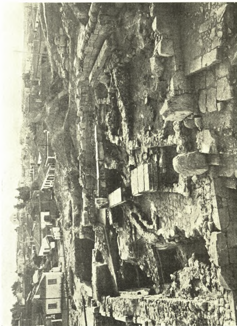
Εἰκ. 1. Ἡ «ἱερὰ οἰκία» ἐκ Βορρᾶ.

πολὺν εἰς μῆκος (2,00) καὶ τὸ πλάτος του περιορίζεται εἰς 3,70, τοῦ τρίτου δωματίου τὸ μῆκος εἶναι πάλιν 2,70 καὶ τὸ πλάτος 3,40, ἀλλ' ὅπως εἴπομεν, εἶνε δι' ἐγκαρσίου τοίχου διηρημένον εἰς δύο χώρους β γ πλάτ. 2,00 καὶ 1,10. Ὁ μικρὸς χώρος μετὰ τὸ τρίτον δωμάτιον ἔχει σχεδὸν τριγωνικὸν σχῆμα καὶ