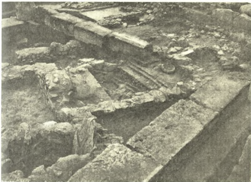
Εἰκ. 6. Τὸ δωμάτιον β γ μὲ μίαν λεκάνην θυσιῶν ἐπὶ τοῦ δαπέδου. Σειρὰ πύρων ἐκ τοῦ πωρίνου Πεισιστρατείου ναοῦ.

ἡ ἀνατολική του πλευρὰ ἔχει μῆκος 2 μ. Εἰς τὸ κέντρον τοῦ βορειοτέρου δωματίου σφύζεται εἰς τὴν ἀρχικὴν της θέσιν τετραγωνικὴ πλάξ, ἡ ὁποία προφανῶς θὰ εἶνε ἡ βάσις ξυλίνου στύλου, χρησιμεύοντος εἰς ὑποστήριξιν τῆς στέγης. Εἰς τὴν βορειοδυτικὴν γωνίαν τοῦ ἰδίου δωματίου εἶνε ἐκτισμένον δι' ἀργῶν λίθων μικρὸν βάθρον, τὸ ὁποῖον ἐχρησίμευεν εἰς τοὺς κατοικήσαντας τὴν οἰκίαν διὰ τοποθέτησιν σκευῶν, καὶ εἰς τὴν νοτιανατολικὴν γωνίαν