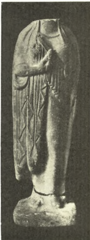
Εἰκ. 9. Πήλινον εἰδῶλιον ἐκ τῆς «ἱερᾶς οἰκίας».

ἐκτίσθη τὰς ἀρχὰς τοῦ ἕκτου αἰῶνος μικρὸν τετράγωνον δωμάτιον (Β ἐπὶ τοῦ σχεδίου μας), ἐντὸς τοῦ ὁποίου ἐγίνοντο, ὡς φαίνεται, θυσίαι· ἀλλὰ καὶ πρὶν κτισθῇ τὸ δωμάτιον ὑπῆρχεν ἐπὶ τῆς θέσεως, ὅπου ἀνηγέρθη τοῦτο, βωμός, ὅστις ἐχρησιμοποιήθη ἐπὶ μακρὸν καὶ ἐσχηματίσθη ἐκ τῶν ἀλλεπαλλήλων ὑπολειμμάτων τῶν θυσιῶν. Μικρὰ κλιμακωτὴ ἀνάβασις κατεσκευασμένη διὰ μικρῶν ἀργῶν λίθων φέρει ἐκ βορρᾶ διὰ τῆς παλαιᾶς ὁδοῦ, τὴν ὁποίαν ἐμνημονεύσαμεν ἀνωτέρω, εἰς τὸ ἱερὸν τοῦτο δωμάτιον. Ἀλλὰ καὶ ἄλλος διακεκριμένος τύπος θυσιῶν ἐσημειώθη ἔμπροσθεν τοῦ δωματίου τού-