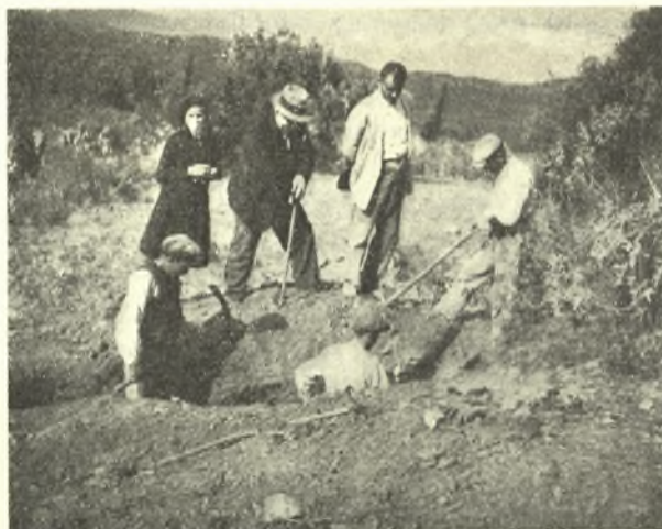
Εἰκ. 2. Ἀνωθι τοῦ δρόμου τοῦ πλουσίου Μυκηναϊκοῦ τάφου.