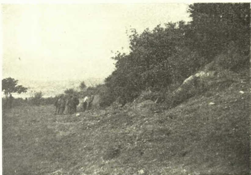
Εἰκ. 1. Οἱ πρόποδες τοῦ Κούκουρα, ἔνθα τὸ Μυκηναϊκὸν νεκροταφεῖον καὶ ὁ ἀγρὸς τοῦ Ἀντωνίου Κ. Σκόνδρα.

Εἰς τὰ Πρακτικὰ τῆς Ἀρχαιολογικῆς Ἑταιρείας τοῦ 1933 σελ. 90-93 ἐξεθέσαμεν τὴν γνώμην ἡμῶν περὶ τῶν πλησίον τῶν Πατρῶν εὐρεθέντων