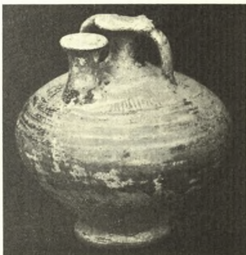
Εἰκ. 4. Τυφλόστομος ἀμφορεὺς.

Πρὸς τὴν διεύθυνσιν ταύτην εἰς τὰ πρῶτα ὑψώματα, τὰ ὅποια συναντῶμεν, ἔχουσιν ἰδρυθῆ πρὸ πολλῶν ἐτῶν τὰ ἐργοστάσια οἰνοποιίας τοῦ Klaus