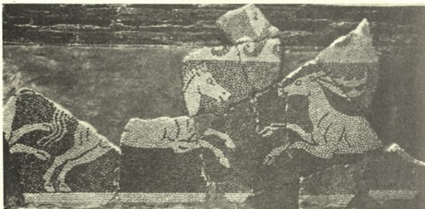
Εἰκ. 8. Τμήμα ψηφιδωτῆς ζωφόρου τῆς Σικωνῶνος.

Προσθέτομεν, ἐν τέλει, ὅτι συντελεσθείσης τῆς στεγάσεως τοῦ εἰς μουσεῖον διασκευασθέντος μεγάλου ρωμαϊκοῦ κτηρίου ἐποθετήθησαν ἐν αὐτῷ