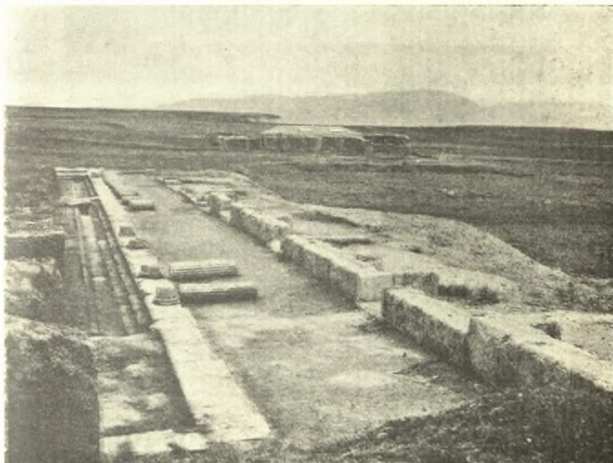
Εἰκ. 1. Ἀποψὶς τῆς ἀνατολικῆς στοᾶς τοῦ κάτω ἀνδῆρου τοῦ γυμνασίου.

δ') Ὅτι πλὴν τῶν δύο κατὰ τὰ προηγούμενα εἴτη ἀποκαλυφθεισῶν κλιμάκων ἐπικοινωνίας τῶν δύο ἀνδῆρων ὑπῆρχε καὶ τρίτη εὐθεία πλάτους 1.35, ἕξ εἴκοσι βαθμίδων (εἰκ. 2). Ἦτο δ' ἡ κλίμαξ αὕτη ἐστεγασμένη, ἅτε τελοῦσα τὴν μεταξὺ τοῦ νοτίου σκέλους τοῦ κάτω ἀνδῆρου καὶ τοῦ ἀντιστοίχου σκέ-