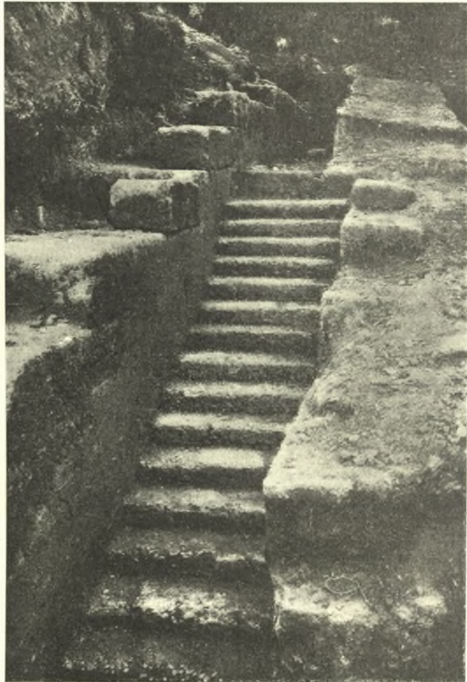
Εἰκ. 2. Ἡ δυσμικὴ κλίμαξ ἐπικοινωνίας τῶν ἀνδρῶν τοῦ γυμνασίου.

τια ὥς ἡ τοῦ κάτω. Πρὸ τοῦ στυλοβάτου ὑπῆρχεν ἡ ἀπάγουσα τὰ ἀπὸ τῆς στέγης τοῦ ὑποστέγου καταρρέοντα ὕδατα, αὐλάξ, ἣς εὐρέθη καὶ τὸ πρὸς νότον σκέλος εἰς μῆκος 13.25. Κατὰ τὴν σκαφὴν τοῦ ἄνω ἀνδρήρου ἦλθον