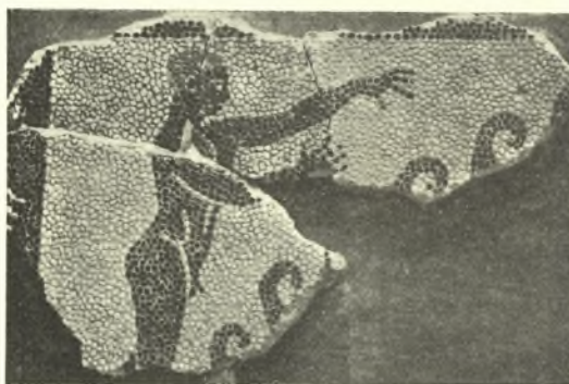
Εἰκ. 9. Τμήμα ψηφιδωτῆς ζωφόρου τῆς Σικωνῶνος.

τὰ ἀρχαῖα γλυπτὰ καὶ ἀρχιτεκτονικὰ μέλη αἱ παρατιθέμεναι εἰκόνες 6 καὶ 7, 8 καὶ 9 παρέχουσιν ἢ μὲν 6 γενικὴν ἄποψιν τοῦ μουσείου ἀπὸ ΝΑ ἢ δὲ 7 ἄποψιν τῶν ἐν τῇ ἐξέδρᾳ τῆς δευτέρας αἰθούσης τοῦ μουσείου τοποθετηθέντων γλυπτῶν καὶ τέλος αἱ 8 καὶ 9 τὰ ἐπὶ τοῦ νοτίου τοίχου τῆς δευτέρας αἰθούσης προσηλωθέντα τεμάχια τοῦ ψηφιδωτοῦ δαπέδου, περὶ ὧν ἐγένετο ἤδη λόγος ἐν τοῖς Πρακτικοῖς τοῦ παρελθόντος ἔτους (σ. 83).