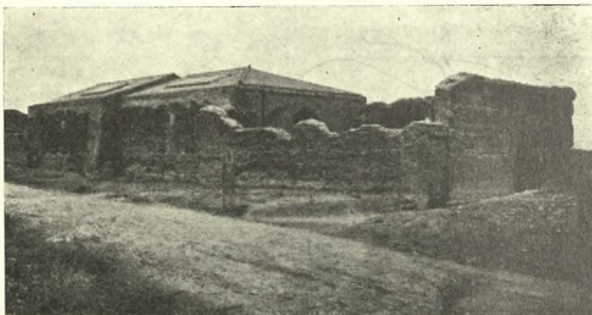
Εἰκ. 6. Γενικὴ ἀποψὶς τοῦ μουσείου τῆς Σικυῶνος ἀπὸ ΝΑ.

Τάφοι κοινοὶ ἀνοιχθέντες αὐτόθι ἀπεκάλυψαν ἀφ' ἑνὸς μὲν ἀγγεῖα τοῦ τέλους τοῦ 5ου αἰῶνος (ἐν τῶν λεγομένων φοινικικῶν, τρεῖς λευκὰς ληκύθους μετ' ἀδιακρίτων παραστάσεων, ἐν ἀρκετὰ μέγα μελανογάνωτον, ραβδωτόν,