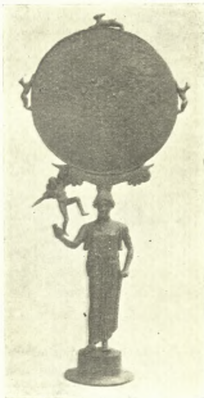
Εἰκ. 5. Χαλκοῦν κάτοπτρον.

Ἐρευνήθησαν λοιπὸν ἐπιμελῶς οἱ κατὰ τὴν θέσιν Γκράβες τάφοι, ὧν τινες εἶχον ἀνοίξει καὶ κατὰ τὸ 1932 (ΠΑΕ 1932 σ. 75). Οἱ τάφοι οὗτοι εἶναι ἐσκαμμένοι κατὰ συστάδας ἐντὸς τοῦ σκληροῦ χώματος (ἄσπριά) τοῦ ὑπερθεῖν τοῦ χωρίου Μοῦλκι ὑψώματος. Οἱ ἐφέτος ἐρευνηθέντες ἀπέδωκαν καλὰ τινα