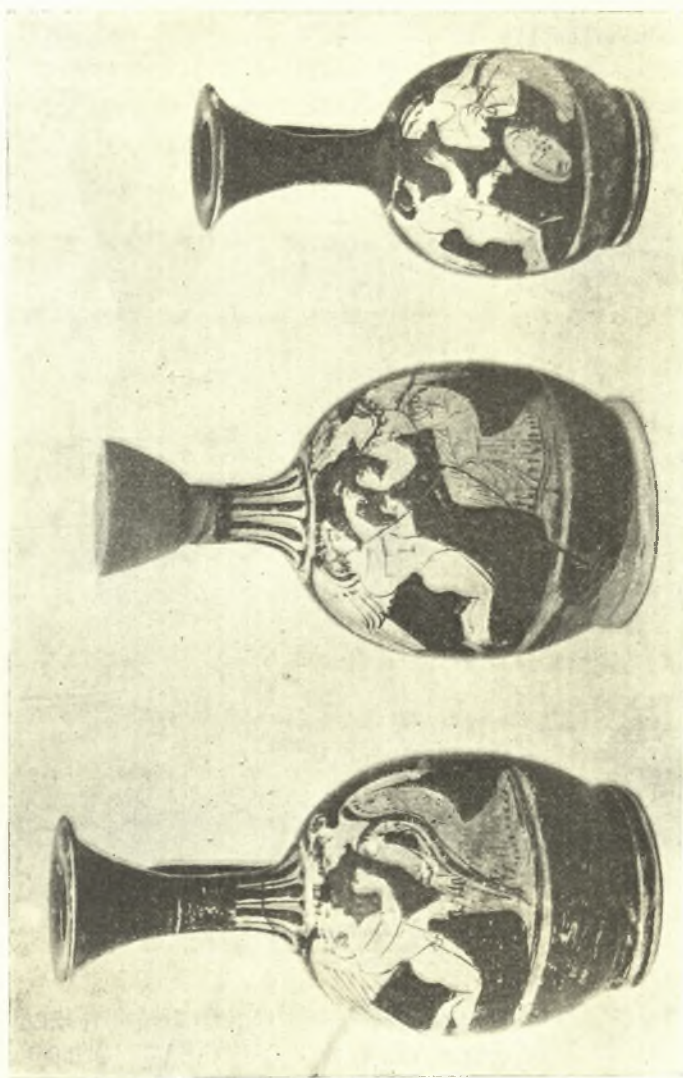
Εἰκ. 3. Ἀρυβαλοειδῆ ληκύθια μετ' ἐρυθρομόρφων παραστάσεων.

ἔφερον 20 δωρικάς ραβδώσεις. Εὐρέθη ἐπίσης ἐν κιονόκρανον, τρία τεμάχια τριγλύφων μετὰ συναφῶν μετοπῶν καὶ δύο μεγάλα τεμάχια γείσων μετὰ σταγονοφόρων προμόχθων. Τὰ ἀρχιτεκτονικὰ ὁμῶς ταῦτα μέλη δεικνύουσι