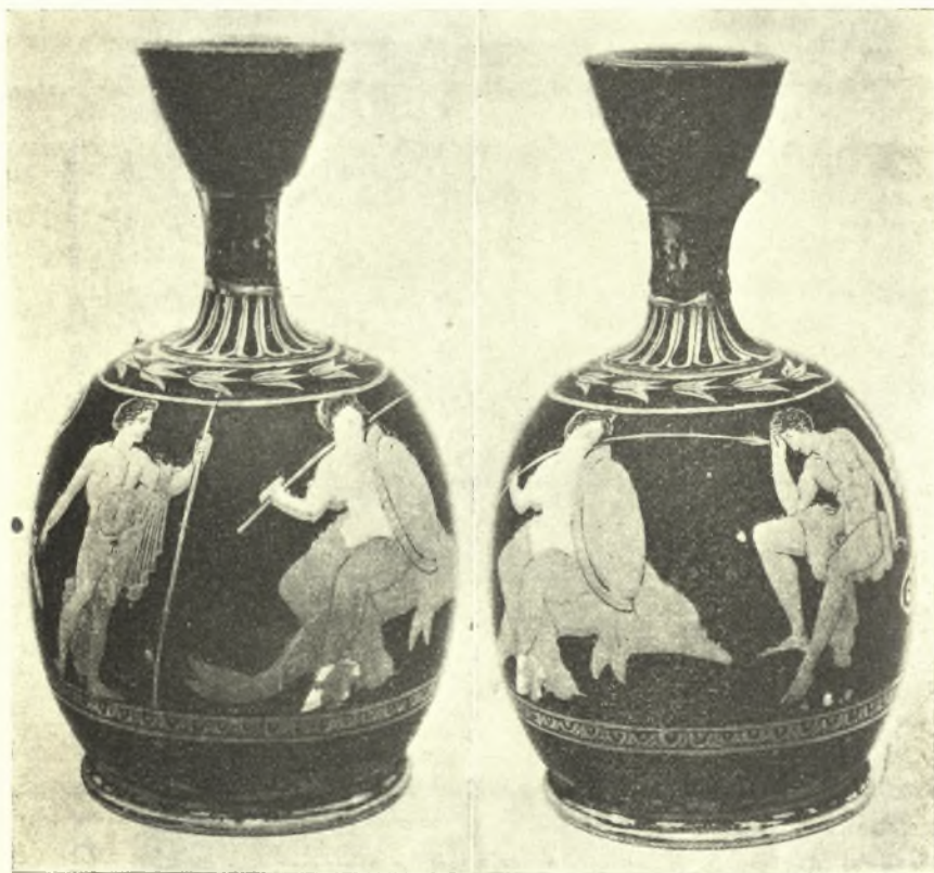
Εἰκ. 4. Λήκυθος μετ' ἐρυθρομόρφου παραστάσεως.

αἰῶνα μεγάλου σεισμοῦ, οὐχὶ ὅμως ὅλον ἀλλὰ μόνον τὸ ἄνω αὐτοῦ ἀνδρῶν ὅπερ τούτου ἔνεκα ἀνακατεσκευάσθη μετὰ τὰς αὐτὰς μὲν διαστάσεις καὶ ἀναλογίας πρὸς τὸ παλαιὸν ἀλλὰ μετὰ πολὺ κατωτέραν τέχνην. Ὅτι δὲ ἀρχικῶς τὸ ἄνω ἀνδρῶν ἦτο μετ' ὅλης τῆς ἀπαιτουμένης καλλιτεχνίας κατεσκευασμένον ἀποδεικνύει ἡ εὑρεσις δύο κιονοκρανῶν καὶ ἐνὸς γείσου, ἅτινα, ἔχοντα