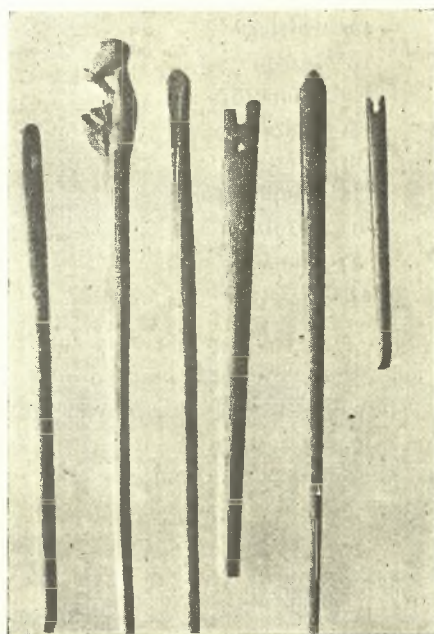
Εἰκ. 4. Ὅστεῖναι περόναι καὶ βελόναι.

Τέλος εὑρέθησαν ἐντὸς τοῦ ἀνωτέρου στρώματος πέντε νέαι ἐπιγραφαὶ (ἢ μία κολοβή). Εἶνε ὅμως περίεργον, ὅτι καὶ αὗται εἶναι τοῦ αὐτοῦ τύπου