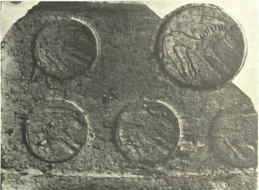
Εἰκ. 1. Τεμάχιον ὑστερογεωμετρικοῦ πίθου. (Ἄνω δεξιὰ ἐν «μετάλλιον» ἐν μεγεθύνσει).

Τὰ εὐρήματα ταῦτα δὲν ὑπῆρξαν σπουδαῖα οὔτε καὶ πολλὰ κατὰ τὸ παρὸν ἔτος, κυρίως ἔνεκα τοῦ γεγονότος, ὅτι δὲν ἐσκάψαμεν βαθέως εἰς τὸ πλούσιον μελανὸν στρώμα τῆς ἀρχαϊκῆς ἐποχῆς. Ἐντὸς τοῦ τελευταίου τούτου εὐρέθησαν ἐπιπολῆς μερικὰ ἄμορφα τεμάχια χαλκοῦ, γνωστὰ ἤδη ἐκ τῶν προ-