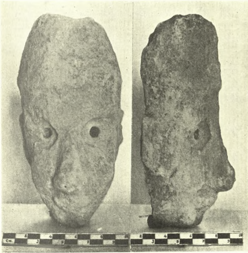
Εἰκ. 2. Πωρίνη κεφαλή.

Ἐκ τῶν εὐρημάτων τοῦ ἀνωτέρου στρώματος τὸ σπουδαιότερον εἶνε γυναικεία πωρίνη κεφαλή, ἣς τὸ ἔμπροσθεν μέρος μόνον σφύζεται καὶ εἰς κατάστασιν ὄχι ἄμεμπτον, ἔνεκα τοῦ εὐθρύπτου ὕλικού (εἰκ. 2). Τὸ συνολικὸν