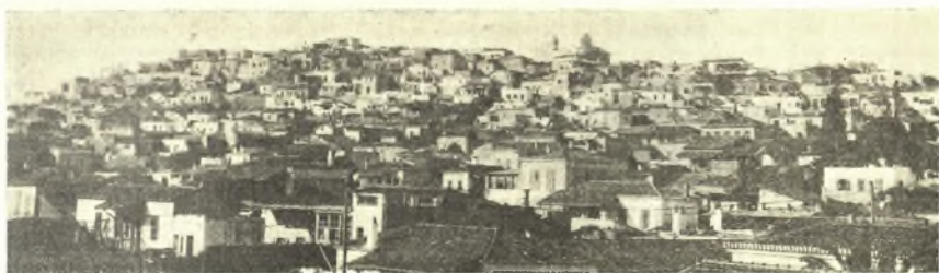
Εἰκ. 1. "Αποψὶς Μεγάρων· ὁ λόφος τοῦ Ἀλκάθου.