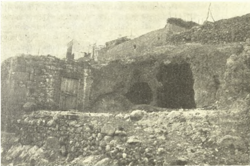
Εἰκ. 11. Τὸ σπήλαιον μετὰ τῆς πρὸ αὐτοῦ μικρᾶς πλατείας.

Οἱ ἀνωτέρω τάφοι κατὰ τὰ ἐν αὐτοῖς γενόμενα εὐρήματα δύνανται νὰ