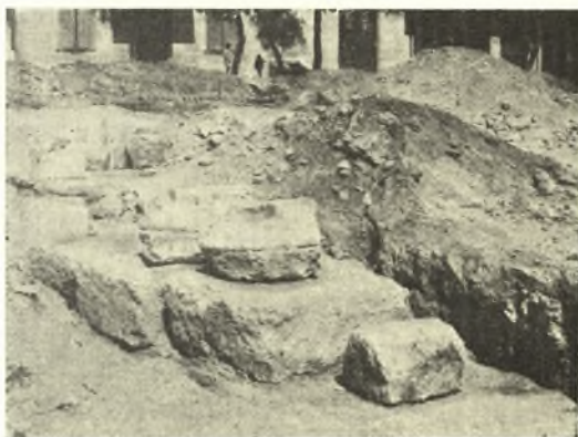
Εἰκ. 5. Τὸ ἀνασκαφέν νότιον ἄκρον τοῦ πρώτου θεμελίου μετὰ τὰ παρ' αὐτὸ εὐρεθέντα τεμάχια δωρικῶν κιονοκρανῶν.

Ἐλέχθη καὶ ἀνωτέρω ὅτι τὰ ἀνασκαφέντα θεμέλια εὐρέθησαν εἰς βάθος 0,60 μ. περίπου ἀπὸ τῆς ἐπιφανείας τοῦ ἔδαφους. Πρέπει νὰ σημειωθῇ ὅμως ὅτι τοῦτο ἰσχύει διὰ τὸ βόρειον τμήμα τῆς πλατείας, διότι εἰς τὸ νότιον τὸ ἔδαφος ταπεινοῦται αἰσθητῶς καὶ ἐπομένως ἐλαττοῦται τὸ βάθος, εἰς δὲ ἀνευρέθησαν τὰ κατὰ τὸ μέρος τοῦτο θεμέλια. Ὅπως δὴποτε ἡ ἐπίχωσις εἰς ἀμφοτέρω τὰ βάρη ἦτο ὁμοιογενὴς καὶ ἀπετελεῖτο ἐκ χώματος, ἀργῶν λίθων, τεμαχίων πῶρων λίθων καὶ ὀπτοπλίνθων καὶ μεγάλων τεμαχίων ἀμμοκονιάματος, ἀνευρισκομένων ἰδίᾳ εἰς τὸ τμήμα τῶν ὑποκαύστων. Τὰ τελευταῖα ταῦτα