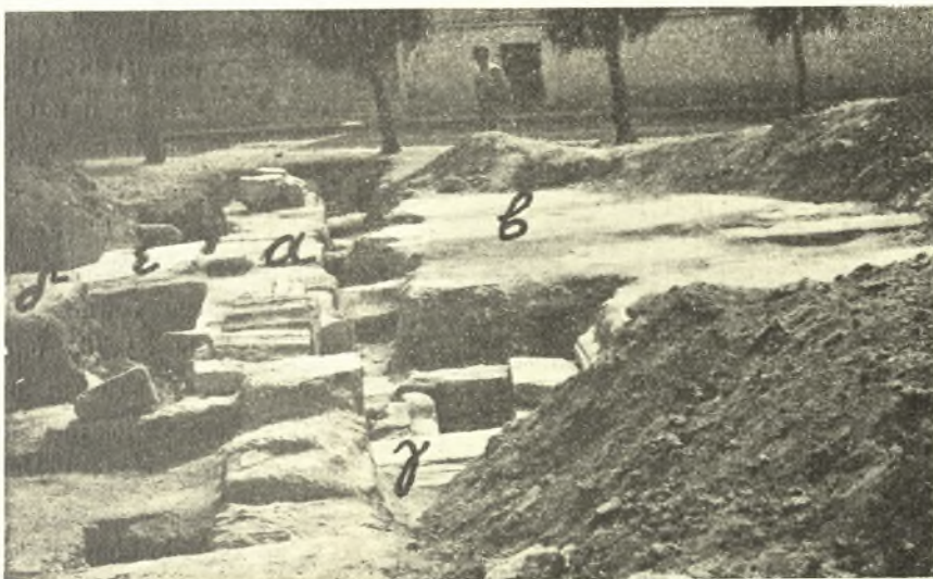
Εἰκ. 3. α τὸ πρῶτον θεμέλιον, β ἡ ψηφιδωτὴ στρῶσις, γ ὁ ὀχετός, δ ἡ δεξαμενὴ, ε τὸ παρ' αὐτὴν πλακόστρωτον διαμέρισμα. Εἰς τὸ βάθος ἡ ὁδὸς Βύζαντος.

Τὸ θεμέλιον τοῦτο εἰς ἀπόστασίν τινα ἀπὸ τοῦ πρώτου σχηματίζει γωνίαν μὲ ἄλλο, παραλλήλον πρὸς τὸ πρῶτον, ἔλλιπῶς ὅμως σφζόμενον. Ὁ χώρος, ὁ ὁποῖος ὑπάρχει εἰς τὸ σημεῖον τοῦτο μεταξὺ τοῦ ἀνασκαφέντος πρώτου θεμελίου καὶ τοῦ παραλλήλου πρὸς αὐτό, τοῦ ἔλλιπῶς σφζομένου, καταλαμ-