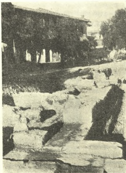
Εἰκ. 6. Τὸ κατὰ τὸ βόρειον ἀνασκαφὲν ἄκρον τοῦ πρώτου θεμελίου ἀποκαλυφθὲν ἄλλο θεμέλιον.

σκευασμένων καὶ ἐχόντων τὰς συνήθεις αὐλακωτὰς γραμμὰς ὡς διακόσμησιν. Βορείως ὅμως τῆς δεξαμενῆς καὶ εἰς βάθος 0,60 ἀνευρέθη πήλινος λύχνος ἀκέραιος, φέρων ὡς διακόσμησιν ἐπὶ τῆς ἄνω ἐπιφανείας του σταυρόν. Διάφορος ἦτο ἡ ἐπίχωσις εἰς τὰ βαθύτερα στρώματα τῶν ὑποκαύστων. Ἐνταῦθα ἀπὸ βάθους 1,20 μ. μέχρι 1,45 ὑπῆρχεν ὁμοιογενὲς στρώμα τέφρας ἐκ ξύλων πεύκων καὶ ἐλαιῶν πιθανῶς. Εἰς τὸ στρώμα τοῦτο τῆς τέφρας ἀνευρέθησαν ὅστ᾽ αὖ σκελετῶν ἀνθρώπων τοῦλάχιστον τριῶν, παρὰ δὲ