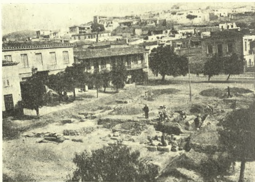
Εἰκ. 2. Γενικὴ ἀποψὶς τῆς ἀνασκαπτομένης πλατείας. Εἰς τὸ βῆθος ὁ λόφος τῆς Καρίας.

ἐνταῦθα τὸ ἔδαφος κατέρχεται αἰσθητῶς. Τὸ ἀποκαλυφθὲν δάπεδον δὲν σφύζεται εἰς καλὴν κατάστασιν, φέρει δὲ εἰς πλείστα σημεῖα τοῦ ἐπισκευὰς μεταγενεστέρως διὰ μικρῶν μαρμαρίνων πλακῶν, ἐνθ' εἰς ἄλλα ἔχουν τελείως ἀποκολληθῇ αἱ ψηφίδες τοῦ ἥ ἔχει ὑποστῇ καθίζησιν. Ἡ ψηφιδωτὴ στρωσὶς εἶνε κατεσκευασμένη διὰ ψηφίδων μικρῶν διαστάσεων καὶ διαφόρων χρωμάτων, λευκοῦ, βαθυκυάνου, ἐρυθροποῦ, ἰώδους κ.λ.π., αἱ ὁποῖαι παριστῶσι γεωμετρικὰ κοσμήματα, οἷον τετράγωνα, ῥόμβους κ.λ.π. Ἐκ τῆς ὅλης του κατασκευῆς τὸ ψηφιδωτὸν τοῦτο δάπεδον, πρέπει νὰ τεθῇ εἰς τοὺς πρώτους