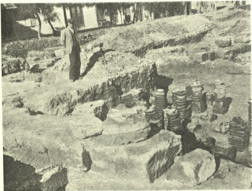
Εἰκ. 8. Τὸ ἀνασκαφέν τμήμα τῶν ὑποκαύστων τοῦ λουτροῦ.

«Ἔργον καὶ τοῦτο τοῦ μεγαλοπρεπεστάτου Κόμητος Διογένους, τοῦ παιδὸς Ἀρχελάου, ὃς τῶν Ἑλληνίδων πόλεων ὡς τῆς ἰδίας οἰκίας κηδόμενος παρέσχεν καὶ τῇ Μεγαρ[έ]ων εἰς μὲν πύργων κατασκευὴν ἑκατὸν χρυσίνους,