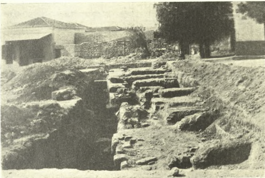
Εἰκ. 7. Ἀποψις τῶν πρὸς ἀνατολὰς τοῦ ἐν τῇ εἰκ. 6 θεμελίου ἀνασκαφέντων θεμελίων.

ἢ φύλλων κοσμήματα. μεταξὺ δὲ τούτων ὑπάρχει καὶ ἐρυθρόγραφον ὄστρακον, ὃς καὶ νόμισμα χαλκοῦν λίαν ἐφθαρμένον. Ἐκ τῶν ἐκτεθέντων στρωματογραφικῶν δεδομένων καὶ ἐξ ἄλλων παρατηρήσεων ἡμῶν συνάγομεν ἐπὶ τοῦ παρόντος τὰ ἑξῆς συμπεράσματα : Τὸ ἀνασκαφὲν εἰς τινὰ τμήματα αὐτοῦ μέγα οἰκοδόμημα εἶνε λουτρόν ἀνεγερθὲν κατὰ τοὺς Ῥωμαϊκοὺς χρόνους. Τὸ λουτρόν τοῦτο ἐκτίσθη ἐν τῇ αὐτῇ θέσει ἢ τοῦλάχιστον πλησίον ἄλλων ἀρχαιοτέρων οἰκοδομημάτων, τῶν ὁποίων λείψανα εἶνε οἱ σφόνδυλοι, οἱ χρησιμοποιηθέντες ὡς καλύμματα τοῦ ἐν μέρει ἀνασκαφέντος ὁχετοῦ, δύο δωρικὰ κιονόκρανα (εἰκ. 5), ἀνευρεθέντα παρὰ τὸ νότιον ἀνασκαφὲν ἄκρον τοῦ πρῶ-