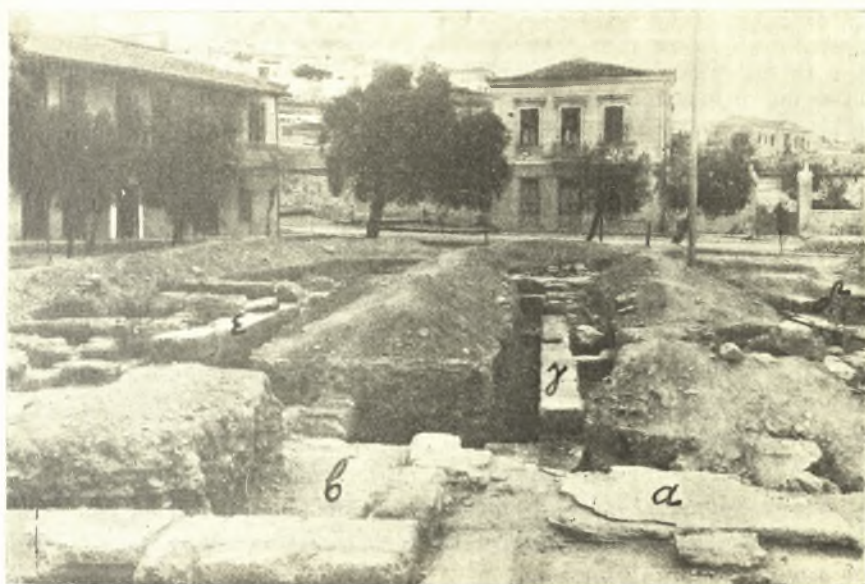
Εἰκ. 9. α τὸ πλακόστρωτον διαμέρισμα, β ἢ παρ' αὐτὸ δεξαμενὴ, γ τὰ ἀπέναντι τούτου διάφορα διαμερίσματα τοῦ λουτροῦ, δ ἡ θέσις ἐνθα βαθύτερον ὑπὸ τὰ θεμέλια τοῦ λουτροῦ ἀνεφάνη τὸ ἀρχαιότερον θεμέλιον, ε τὸ κατὰ τὸ βόρειον ἄκρον τοῦ πρώτου θεμελίου ἀποκαλυφθὲν ἄλλο θεμέλιον τοῦ λουτροῦ.

Εἰς τὰ Μέγαρά, εἰς ἀπόστασιν τινα ἀπὸ τῆς πόλεως καὶ παρὰ τὸν