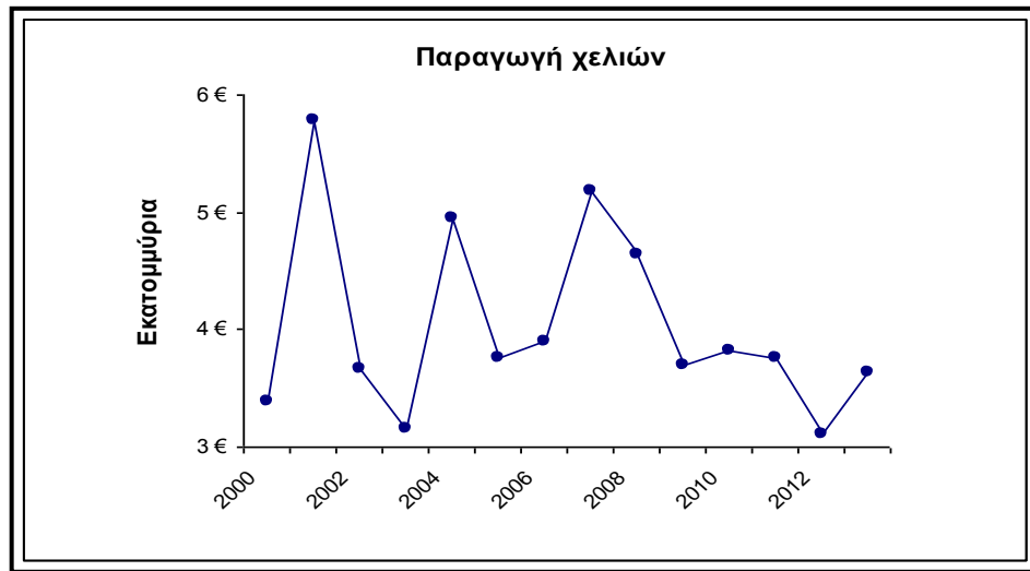
Σχήμα 1. Αξία παραγωγής ελληνικών χελιών (σε ευρώ).

Αν και η Ελλάδα έχει σχετικά μικρή τετραγωνική επιφάνεια (131.940 km 2 ) είναι μία ευλογημένη χώρα και διαθέτει μια εκτεταμένη ακτογραμμή μήκους 15.000 χιλιομέτρων που χαρακτηρίζεται από ευνοϊκές κλιματολογικές συνθήκες και που θα μπορούσε να υποστηρίξει την ανάπτυξη θαλάσσιας υδατοκαλλιέργειας, η οποία έχει εξελιχθεί σε έναν από τους περισσότερο αναπτυσσόμενους τομείς κατά την τελευταία δεκαετία. Η ολοένα αυξανόμενη σημασία της υδατοκαλλιέργειας στην Ελλάδα, οφείλεται στους ακόλουθους παράγοντες: α) στη μείωση των αλιευόμενων ειδών λόγω της ρύπανσης των υδάτων, της υπεραλίευσης και του αυξανόμενου κόστους των καυσίμων, β) στην εντυπωσιακή ανάπτυξη της γεωργικής τεχνολογίας μετά τον 2ο Παγκόσμιο Πόλεμο και γ) στη λύση-κλειδί ότι η υδατοκαλλιέργεια τείνει να ανταποκρίνεται στην αυξανόμενη ζήτηση των αλιευμάτων (Οικονομου & Polymeros 2015). Γενικότερα, οι υδατοκαλλιέργειες αποτελούν έναν από τους περισσότερο ανερχόμενους κλάδους της πρωτογενούς παραγωγής (Καραγκούνης 2010) γεγονός αρκετά ελπιδοφόρο τόσο για τις ελληνικές όσο και για τις παγκόσμιες εκτροφές ιχθυηρών.