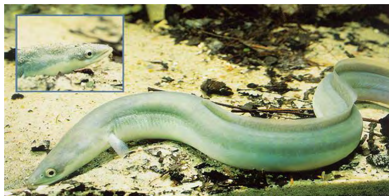
Εικόνα 2. Το χέλι στο φυσικό του περιβάλλον.