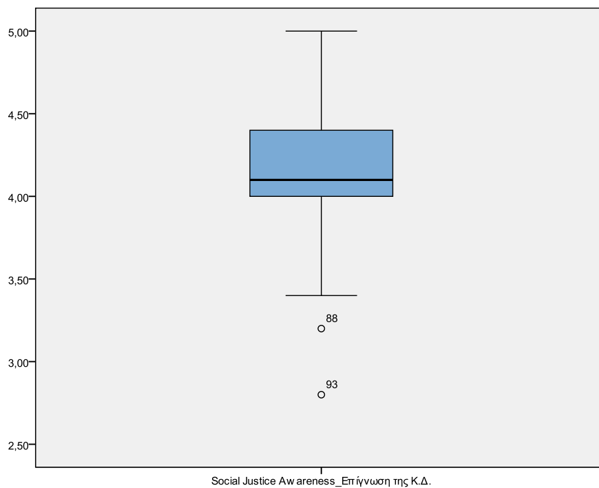
Διάγραμμα 4.2 Θηκόγραμμα (boxplot) της SJA