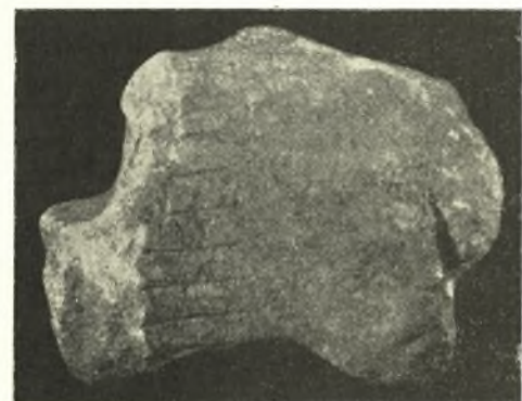
Εἰκ. 3. Θραύσμα προτομῆς πηγάσου· ἀριστερὰ ὄψις.

τὴν διάταξιν ἐκ τοῦ ἐπικρατοῦντος ἐν τῇ ἰωνικῇ ἀρχιτεκτονικῇ πνεύματος, δυσχερῶς δύναται νὰ ὀδηγήσῃ εἰς ὁμοίαν τοποθέτησιν· ἀποτελεῖ ὅπωςδήποτε ὠραῖον δεῖγμα τῆς χρησιμοποίησεως προτομῶν πηγάσων οὐχὶ μόνον εἰς χαλκᾶ σκευή, ἀλλὰ καὶ εἰς μεγαλύτερα ἀρχιτεκτονικά σύνολα· ἡ προτομὴ τῆς Χίου εἶναι τὸ δεύτερον τοιοῦτον παράδειγμα. Αἱ περιορισμέναι διαστάσεις τοῦ χιακοῦ πηγάσου καὶ κυρίως τὸ γεγονός, ὅτι προσηρμόζετο εἰς τὸ μνημεῖον, ἐξ οὗ προέρχεται, ἐνῶ ἡ προτομὴ τῆς Θάσου ἦτο σύμφυτος πρὸς τὴν γωνιαίαν πλίνθον, συνηγορεῖ μᾶλλον ὑπὲρ τῆς ὑποθέσεως, ὅτι ἡ εἰκονιζομένη προτομὴ ἐκόσμηε οὐχὶ οἰκοδόμημα, ἔστω καὶ μικρόν, ἀλλὰ μαρμαρινόν τι κατασκεύασμα, ὡς θρόνον π.χ., ὅπως G. Richter, Ancient Furniture, 14 κέ., εἰκ. 27 κέ., κλίνην (ὀλιγώτερον πιθανόν), ἢ τι ἀνάλογον.