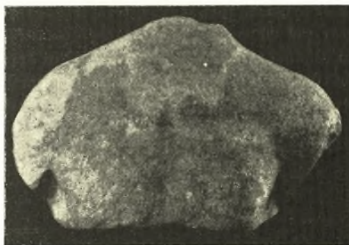
Εἰκ. 4. Ἄνδρικός κορμός· προσθία ὄψις.

Ἡ κατασκευὴ τοῦ στήθους ἰδίᾳ φανερόναι ἐξελιγμένην πλαστικὴν αἰσθησιν, ἐνῶ αἱ πτέρυγες καὶ ἡ ἐνιαῖον σχεδὸν ἐπίπεδον σχηματίζουσα κοιλία φανερόναι παλαιότεραν παρά-