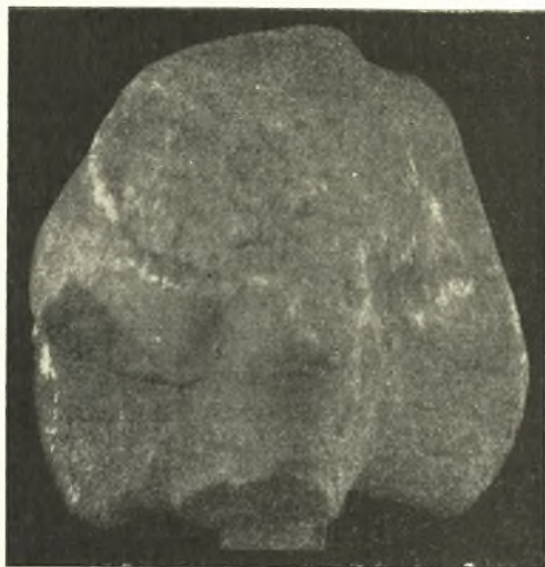
Εἰκ. 1. Θραύσμα προτομῆς πηγάσου· προσθία ὄψις.

3 καὶ τοῦ ἰδ., Études thasiennes I, 62, εἰκ. 55, πίν. 12), τὴν ὁποίαν ὁ Buschor (Meermänner, 38 κέ., εἰκ. 19 καὶ 20) τοποθετεῖ ὡς γωνιαίαν προεξοχὴν τοῦ ἐπιστυλίου ἐρμηνεύων τὴν τοιαύ-