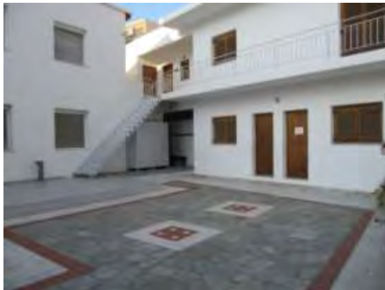
Εστία Τοπικού Τμήματος Βόλου

Η Παγκόσμια Οργάνωση χωρίζεται σε πέντε Οδηγικές Περιοχές: Ευρωπαϊκή Περιοχή, Ασία - Ειρηνικός, Αφρική, Δυτικό Ημισφαίριο και Αραβική Περιοχή. Κάθε Περιοχή διοικείται από το Συμβούλιό της, το οποίο εκλέγεται από τα αντίστοιχα Συνέδρια της κάθε Περιοχής. Το Σ.Ε.Ο. ανήκει στην Ευρωπαϊκή Περιοχή, η οποία διοικείται από την Ευρωπαϊκή Επιτροπή. Η Ευρωπαϊκή Επιτροπή εκλέγεται από το Ευρωπαϊκό Συνέδριο. Το Ευρωπαϊκό Γραφείο, που εδρεύει στις Βρυξέλλες, ιδρύθηκε το 1993. Στην Παγκόσμια Οργάνωση ανήκουν και τα τέσσερα Παγκόσμια Οδηγικά Κέντρα, μέρη και κτήρια, δηλαδή, ανοιχτά στους Οδηγούς και Προσκόπους όλου του κόσμου, για συνέδρια, ταξίδια, διανυκτερεύσεις αλλά και για έκτακτες ανάγκες. Τα Παγκόσμια Οδηγικά Κέντρα είναι: το Our Chalet στο Adelboden της Ελβετίας, το Cabana στην Cuernavaca του Μεξικού, το Sangam στην Pune της Ινδίας και το Pax Lodge στο Λονδίνο.