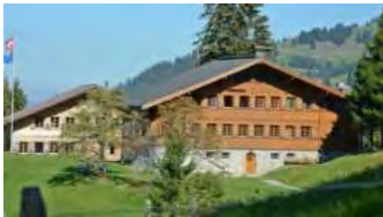
Our Chalet στο Adelboden στην Ελβετία