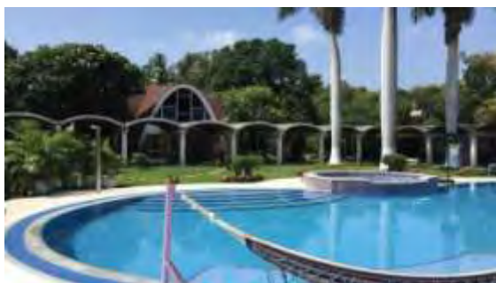
Sangam στην Pune της Ινδίας