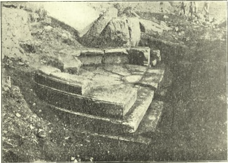
Εἰκ. 1. Ἄποις τῆς ἐξέδρας.

Λόγω τῆς καλυπτούσης καὶ ἐφέτος τὴν ἀγορὰν τῆς ἀρχαίας Στυμφάλου λίμνης ἡ ἔρευνα ἐστράφη καὶ πάλιν πρὸς τὸν πόδα τῆς μεγάλης κατατομῆς, ὀλίγα