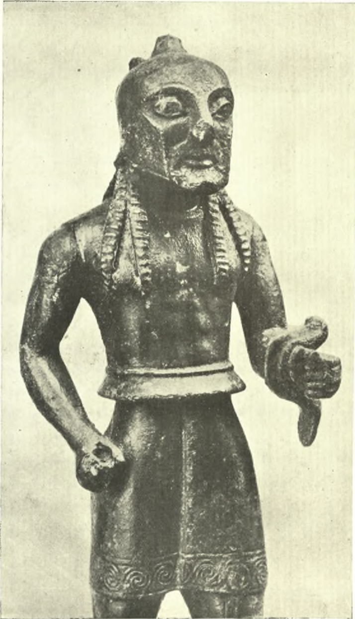
Χαλκοῦς ὀπλίτης ἐκ Δωδώνης. Τὸ ἄνω μέρος.