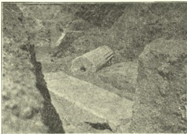
Εἰκ. 2. Ἐξωθεν ὁ οὐδὸς τοῦ δωματίου καὶ ὁ κίων ἐντός.

2,3), ἀριστ. δὲ τῆς θύρας παρὰ τὴν γωνίαν καὶ τὸν δυτ. τοῖχον εὐρέθη στρωμα