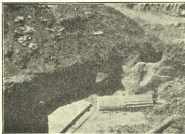
Εἰκ. 3. Ἐσωθεν ὁ οὐδὸς, ὁ κίων καὶ μέρος τοῦ β. τοίχου.

πηλίνων πλαγγόνων ἐγχρώμων, αἵτινες, φαίνεται ὅτι ἀπέκειντο ὡς ἐν Πριήνη καὶ Πομπηία ἐπὶ τινος γείσου ἢ ἴσως καὶ ξυλίνου ῥυμοῦ τοῦ τοίχου, ὅθεν κατέπεσον εἰς τὸ δάπεδον κατὰ τὴν πυρκαϊάν. Ἦσαν ὑγροὶ καὶ μαλακοὶ καὶ ἐρωγυῖται καὶ ἐξήγοντο μετὰ δυσκολίας εἰς τεμάχια. Δὲν συνεκολλήθησαν δὲ ἀκόμη. Περαιτέρω ἐγγὺς βορειότερον παρὰ τὸν δυτικὸν τοῖχον τοῦ δωματίου εὐρέθη καταπεσὸν ἐκ τοῦ ρυμοῦ ἀκέφαλον (ῦψ. 0.57) μαρμάρινον ἀγαλμάτιον γυναικεῖον ἐνδεδυμένον καὶ σφῆζον ἐπὶ τῶν ἐσθῆτων λείψανα χρωμάτων (Εἰκ. 4).