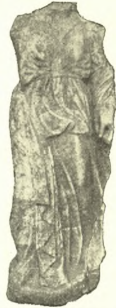
Εἰκ. 4. Ἀγολμάτιον εὗ- ρεθὲν ἐντὸς τῆς κεκαμεί- νης οἰκίας.

ἐπειδὴ ἀποδίδεται (πρβλ. BMC Attica πίν. XXI, 8 σελ. 119) εἰς τοὺς χρό-