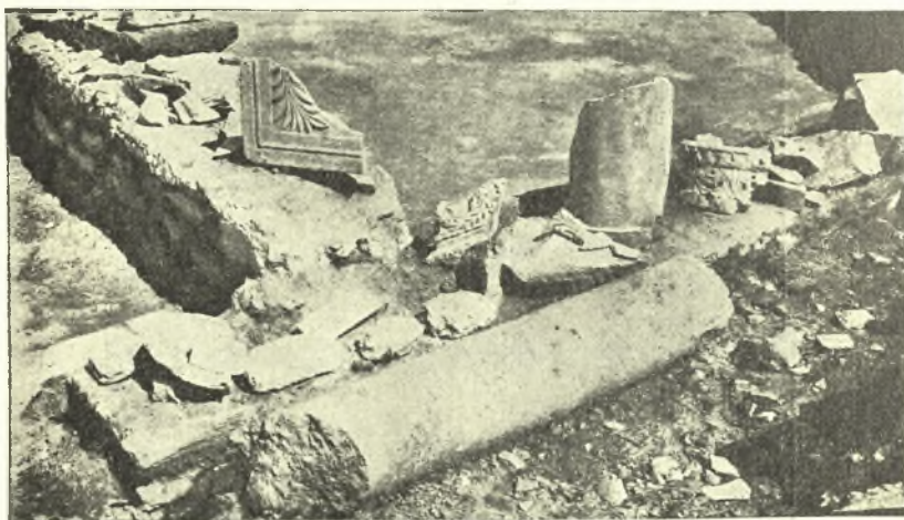
Εἰκ. 3. Ἀνασκαφέντα τμήματα αἰθουσῶν καὶ εὐρεθέντα γλυπτὰ μέλη.

Ἡ διευκρίνις τμήματος εὗρισκομένου μεταξὺ γηπέδου Ζορμπᾶ καὶ Βοῖνογλου, ἣτις ἐφέτος δὲν ἦτο δυνατή, ἐφ' ὅσον δὲν ἔχουσιν εἰσέτι ἀπαλλοτριωθῇ τὰ συνεχόμενα γήπεδα, θὰ διεφώτιζε τὸν προσδιορισμὸν τοῦ ἀνασκαπτομένου μνημείου, καθόσον εἰς τὸ ἄκρον τοῦ γηπέδου Ζορμπᾶ, ὅπου ὁ ἰδιοκτήτης εἶχε τὸ ἀποχωρητήριον, εἶχον ἀναφανῇ δύο ἐπάλληλα μωσαϊκά, ἅτινα ὁ ἰδιοκτήτης εἶχε διατυπῆσει. Τὸ ἐν τούτων εἶναι εἰς βάθος ἑνὸς μέτρου, ἐπὶ τῆς ἐπιφανείας τοῦ δαπέδου τῆς αἰθούσης 7, τὸ δὲ ἕτερον 0.80 μ. κάτωθεν τούτου, ἐπὶ τῆς ἐπιφανείας τοῦ μωσαϊκοῦ τῆς στοᾶς (εἰκ. 4). Θὰ ἡδύνατο τις ἐπομένως νὰ ὑποθέσῃ, ὅτι ἔχομεν πρὸ ἡμῶν κρίσμα ῥωμαϊκῶν χρόνων