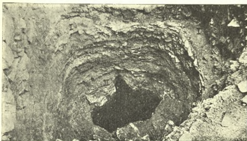
Εἰκ. 4. Τὰ ἀνιφανέτα ἐπ'ἀλληλα μωσαϊκὰ ἐπὶ δαπέδον μιᾶς τῶν ἀνασκαπτομένων αἰθουσῶν.

Β'. αἰθούσης ὑπ' ἀριθ. 1. — Ἡ ἀριστερὰ τῆς στοᾶς αἴθουσα ( 5.75 \times 2.95 ) ἔχει ὑψηλότερον δάπεδον κατὰ 0.35 μ. εἰς ὃ ἀνέρχεται τις διὰ δύο βαθμίδων· πιθανῶς εἶναι προθάλαμος ὁδηγῶν εἰς συνεχομέναν αἶθουσαν — ἔχει δύο θύρας, ἐξ ὧν ἡ βορεία ἡρεννήθη καὶ μέρος τῆς συνεχομένης αἰθούσης. Τὸ ψηφιδωτὸν δάπεδον τοῦ προθαλάμου τούτου εἶναι τὸ πολυτελέστερον μωσαϊκὸν ἐκ τῶν μέχρι τοῦδε ἀνευρεθέντων καὶ τὸ ἀρισιώτερον δια-