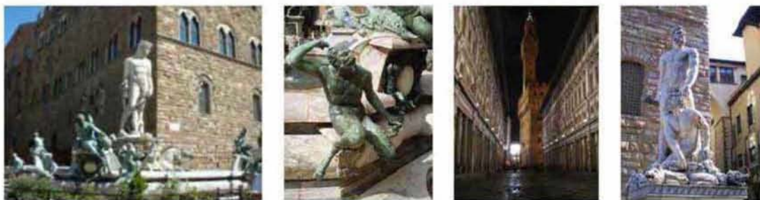
Εικόνα 2.1: Πλατεία Αγ. Μάρκου, Βενετία