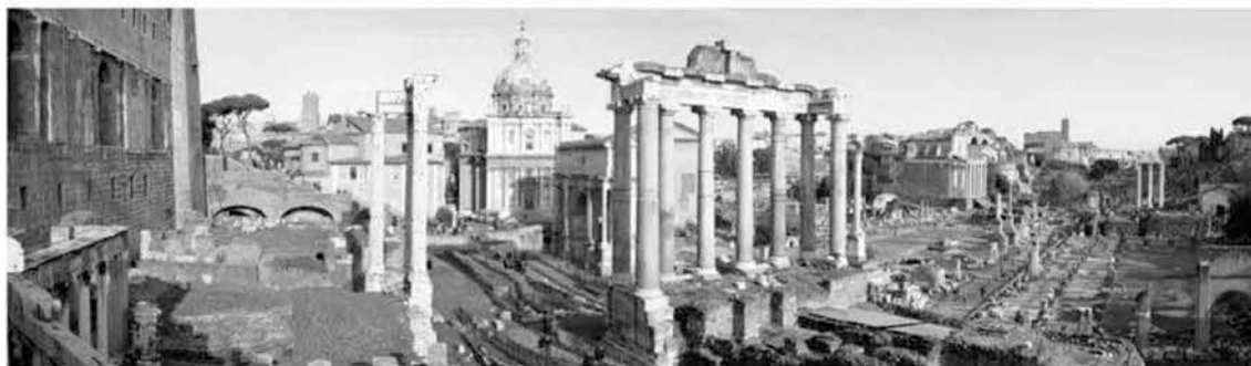
Εικόνα 1.2: Νοτιοανατολική άποψη ρωμαϊκού Forum

Μετεξέλιξη της αγοράς κατά την ρωμαϊκή περίοδο (86π.Χ-476μ.Χ) αποτέλεσε το ρωμαϊκό «Forum». Η πλατεία-αγορά-Forum θεωρείται επιπλέον ως διοικητικό και θρησκευτικό κέντρο και οι λειτουργίες της προσανατολίζονται περισσότερο στο θέαμα παρά στη συμμετοχή σε πολιτικές δραστηριότητες. Βασική διαφορά τους είναι ότι το Ρωμαϊκό φόρουμ ήταν περικλειστός χώρος – και όχι ανοικτός δημόσιος χώρος όπως η Αγορά – που έκλεινε με πόρτες. Η πρόσβαση επιτρεπόταν από την ανατολή του ηλίου μέχρι την δύση. Επίσης, λόγω του καθεστώτος της μοναρχία, δεν επιτρεπόταν ελεύθερες συζητήσεις. Ο Carcopino αναφέρει χαρακτηριστικά ότι με την είσοδο στο φόρουμ των Πραιτοριανών, κάθε συζήτηση σταματούσε (Γοσποδίνη, 1994). Η Ρωμαϊκή πόλη αναπτύχθηκε με ανάλογο σύστημα δρόμων και δημόσιων χώρων, σύμφωνα με το οποίο δινόταν μεγαλύτερη έμφαση στους δρόμους παρά στις πλατείες. Η πλατεία τοποθετείται στο σημείο τομής των δύο κύριων αξόνων από Βορρά προς Νότο και από Ανατολή προς Δύση, ενώ τα σημαντικότερα κτίρια χωροθετούνται αυστηρά και με συμμετρική οργάνωση γύρω από αυτή. Το σχήμα της αγοράς-forum είναι τετράγωνο ή ορθογώνιο και τα κτίρια αντιμετωπίζονται ως τμήματα ενός συμπαγούς συνόλου και όχι ως ανεξάρτητες ενότητες. Ταυτόχρονα, σύμφωνα με το μέγεθος της πόλης μπορεί να υπήρχαν περισσότερα του ενός «Forum» με μικτές ή διαχωρισμένες χρήσεις και χαρακτήρα. (Γοσποδίνη 1994).