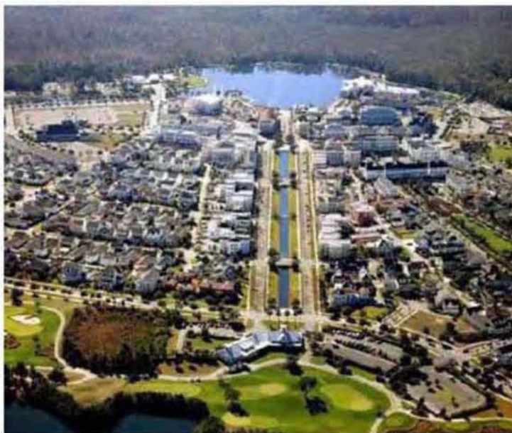
Εικόνα 3.11: Ιδιωτική πόλη, Celebration City (ιδιοκτησία της εταιρίας Disney)