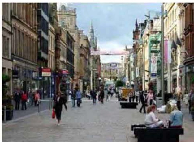
Εικόνα 2.10: περαστικοί, στο Buchanan Street Γλασκώβης