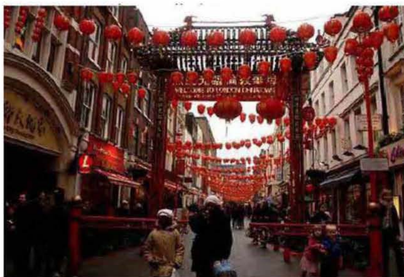
Εικόνα 3.13: Χώρος αντίγραφο στο Λονδίνο, Chinatown