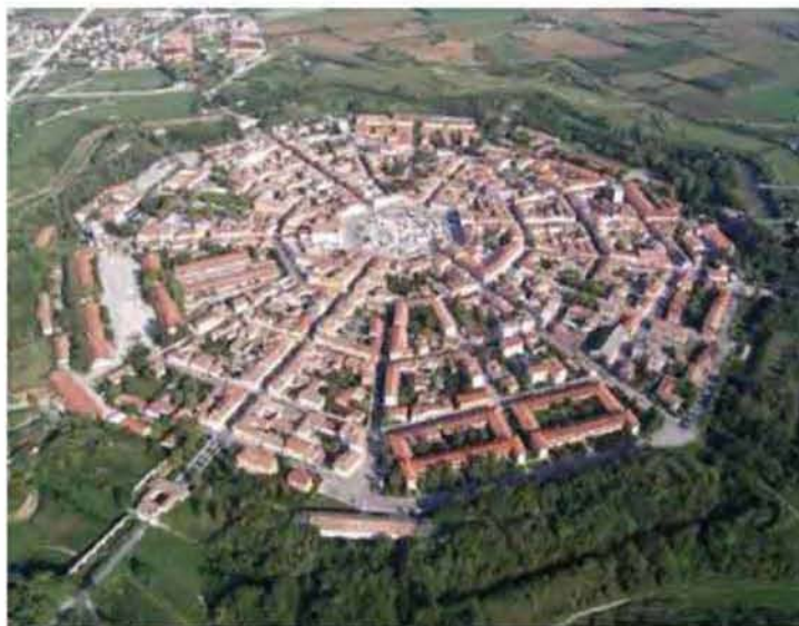
Εικόνα 1.4: Ιταλική αναγεννησιακή πόλη Palma Nova σήμερα.