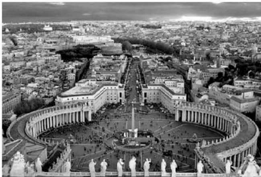
Εικόνα 2.4: Πλατεία Αγίου Πέτρου, Ρώμη