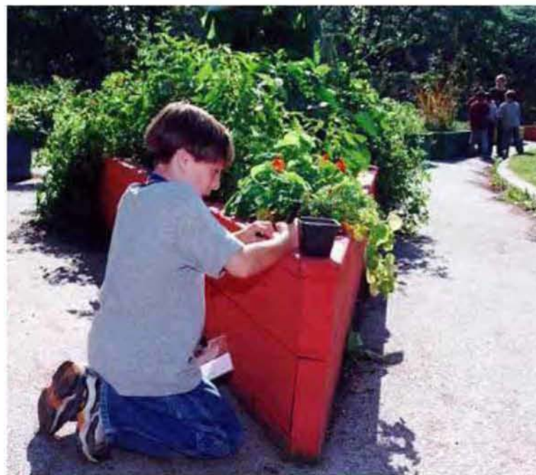
Εικόνα 3: High Park Children's Garden, Τορόντο, Καναδά_Κήπος πρότυπο για την αναζωογόνηση του χώρου του και την παράλληλα σύνδεσή του με την τοπική κοινότητα(ενθαρρύνει την συμμετοχικότητα των παιδιών)

http://placemaking.pps.org/great_public_spaces/one?public_place_id=881&type_id=3#