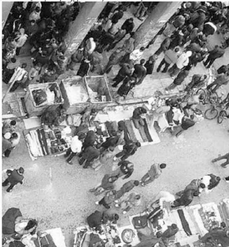
Εικόνα 1.5: Μετανάστες στην περιοχή του Γερανίου, Αθήνα 2008