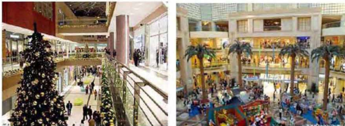
Εικόνα 3.12: Αριστερά: εμπορικό κέντρο, Αθήνα, δεξιά: Mall στην Σγκαπούρη