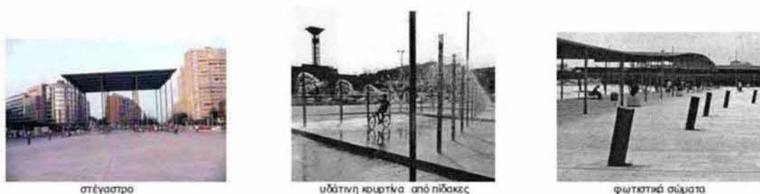
Εικόνα 2.2: Αρχιτεκτονικές συνθέσεις σε δημόσιους χώρους