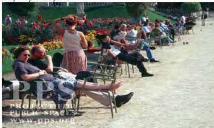
Εικόνα 6.1: «Ίσως η πιο σημαντική δραστηριότητα της πόλης είναι το πολύ συνηθισμένο, το να χαζεύεις τους άλλους ανθρώπους...»