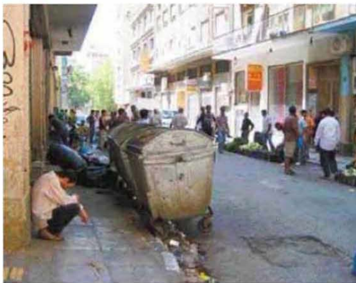
Εικόνα 3.5: Υποβαθμισμένος χώρος Μεταξουργείο, Αθήνα

θα μπορούσε να αποτελέσει η Ομόνοια, το άλλοτε κέντρο δραστηριοτήτων της Αθήνας που πλέον έχει υποστεί απαξίωση είτε υλική είτε μη εκμετάλλευσης των ευκαιριών ή δραστηριοτήτων που θα μπορούσε να επιφέρει στην οικονομική, κοινωνική και πολιτιστική ζωή του τόπου. Βασική διαφορά των υποβαθμισμένων με τους παραμελημένους χώρους είναι ότι οι μεν πρώτοι αποτέλεσαν τυχαία ή μη βασικό ρόλο στο παρελθόν ως πολεοδομικά στοιχεία του ιστού της πόλης και εν συνεχεία εξ αιτίας διάφορων παραγόντων έπαψαν, ενώ οι δεύτεροι μπορεί να μην αξιοποιήθηκαν ποτέ στο μέγιστο δυνατό σημείο και να μην αποτέλεσαν ποτέ βασικό σημείο αναφοράς για την οικονομική και κοινωνική δραστηριότητα της πόλης στην οποία είναι ενταγμένοι. Παρατηρείται λοιπόν, η δημιουργία ενός φαύλου κύκλου, όπου ο εν δυνάμει χρήστης του χώρου αδιαφορεί πλέον για τη δημιουργία νέων αποδοτικών χώρων και τη βελτίωση της διαχείρισης των υπαρχόντων, γεγονός που οδηγεί στην παραγωγή νέων χρηστών και χώρων που τόσο οι πρώτοι, όσο και οι τελευταίοι, αντιμετωπίζονται και χαρακτηρίζονται από αδιαφορία (Carmona 2010a).