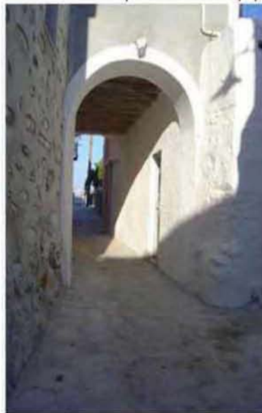
Εικόνα 3.1: Στοές (αριστερά: κυκλαδίτικη αρχιτεκτονική, δεξιά: πέρασμα από την πλατεία Καίρη προς την παλιά πόλη της Ανδρου)