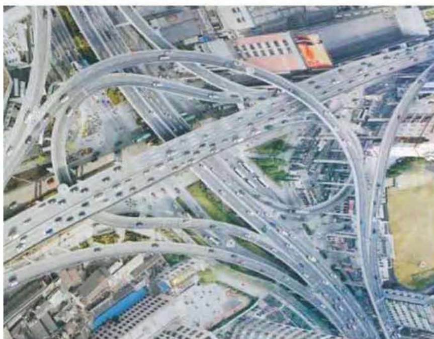
Εικόνα 3.9: Εξαρτημένος χώρος-κυκλοφοριακός κόμβος στη Σαγκάη

Οι δημόσιοι εξαρτημένοι χώροι, προκύπτουν από το κυκλοφοριακό πρόβλημα που διεθνώς και για τις πόλεις κάθε μεγέθους είναι συνέπεια του γεγονότος ότι αυτές σχεδιάστηκαν πριν από την εξάπλωση του αυτοκινήτου.