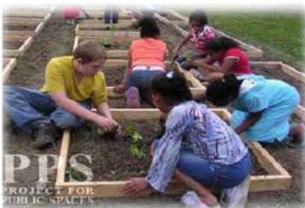
Εικόνα 5.2: Πράσινο σε κοινόχρηστο χώρο της πόλης