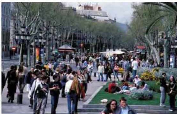
Εικόνα 2.9: Las Ramblas, ο πιο δημοφιλής δρόμος της Βαρκελώνης

Πηγή: http://www.pps.org/blog/9-great-streets-around-the-world/