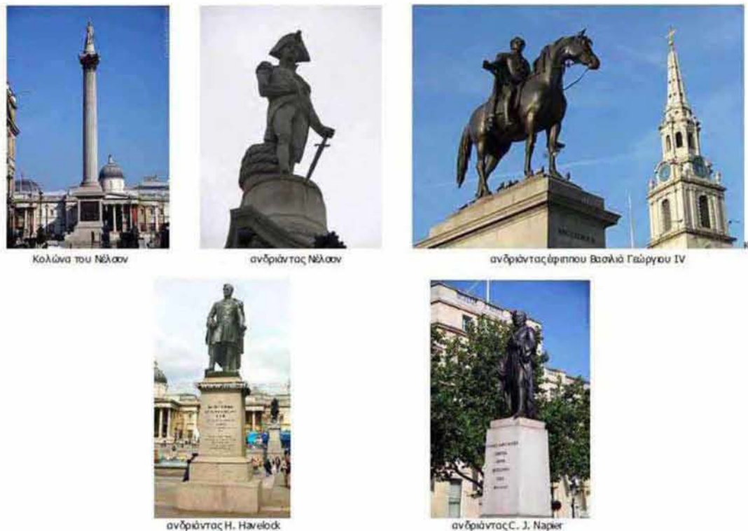
Εικόνα 2.3: Το γλυπτό σε δημόσιους χώρους. Παραδείγματα γλυπτών σε πλατείες της Αθήνας