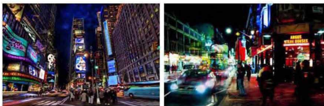
Εικόνα 3.4: Αριστερά: 24-ωρος χώρος, δεξιά: 24-ωρος χώρος Λονδίνο-Σόχο