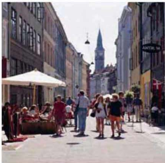
Εικόνα 5.1: Κίνηση πεζών στην Κοπεγχάγη