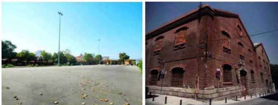
Εικόνα 3.3: Αριστερά: αναξιοποίητη μάντρα τρένων στο Βόλο, δεξιά: αναξιοποίητο κτιριακό απόθεμα στην Μαδρίτη, Ισπανία.