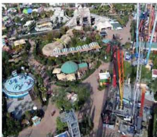
Εικόνα 4.1: Θεματικό πάρκο διασκέδασης Allou Fun Park, Αθήνα

Τα οικιστικά συγκροτήματα είναι μια ιδιαίτερη περίπτωση χώρων που επιτελούν τον ίδιο σκοπό με τα συγκροτήματα κοινωνικής κατοικίας των ελληνικών πόλεων, δηλαδή την κατοίκηση ομοιογενή ομάδας πληθυσμού αλλά με πολλές κοινωνικές και οικονομικές, ταξικές ανισότητες. Τα μεν πρώτα αφορούν σε εύπορες κοινωνικές ομάδες ενώ τα δεύτερα προορίζονται αποκλειστικά για ανθρώπους με χαμηλά εισοδηματικά ή και σε ορισμένες περιπτώσεις ανύπαρκτα, άστεγοι, οικονομικοί μετανάστες κ.λ.π.