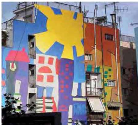
Εικόνα 5.4: Τοιχογραφία επί της τυφλής όψης κτιρίου