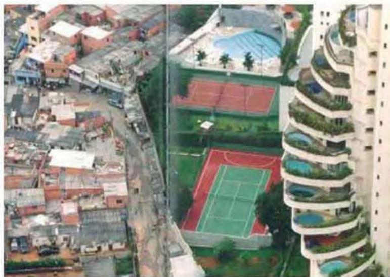
Εικόνα 3.17: Favela Paraisopolis (πόλη του παραδείσου) στο Σάο Πάολο, Βραζιλία.

Οι μεγάλες διατιθέμενες εκτάσεις, στις οποίες κατασκευάζονται τα οικιστικά συγκροτήματα, προέρχονται συνήθως από την εκποίηση δημόσιας περιουσίας. Το συγκρότημα «ΛΟΦΟΣ ΕΝΤΙΣΟΝ» κατασκευάστηκε από την κατασκευαστική REDS (του Ομίλου Ελληνική ΤΕΧΝΟΔΟΜΙΚΗ) σε μία έκταση που ήταν ιδιοκτησία του ΟΤΕ στην περιοχή της Παλλήνης, ενώ το συγκρότημα «Ηλιδα» της Lamda Development S.A. στην έκταση του Κέντρου Φιλοξενίας των Δημοσιογράφων Ξένου Τύπου (το Χωριό Τύπου κατά τη διάρκεια των Ολυμπιακών Αγώνων 2004) στο Μαρούσι.