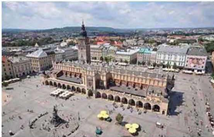
Εικόνα 1.3: Μεσαιωνική πλατεία κεντρικής αγοράς, Κρακοβία.