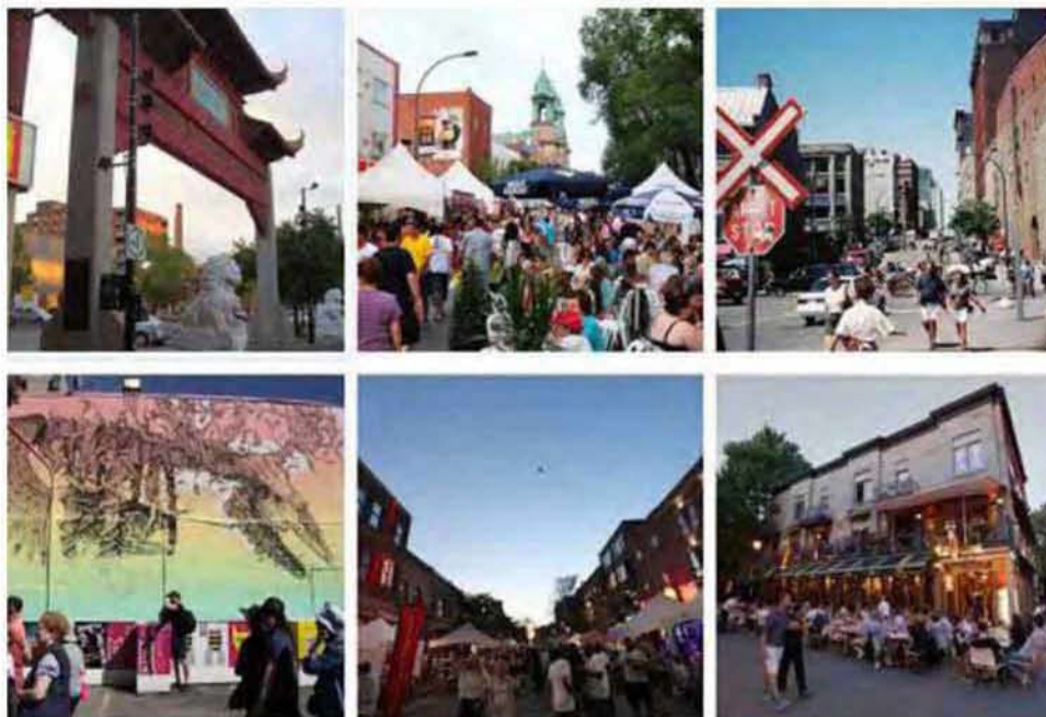
Εικόνα 2.7: Τέχνη, Φεστιβάλ, κλειστή οδός για αυτοκίνητα μόνο το βράδυ