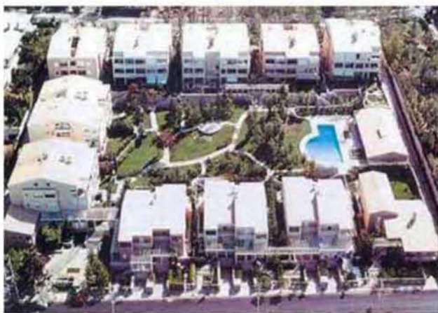
Εικόνα 3.16: Αριστερά: συγκρότημα Εσπερίδων, Κηφισιά, δεξιά: συγκρότημα Λόφος Έντισον, Παλλήνη

Ιδιαίτερο ενδιαφέρον για τα ελληνικά δεδομένα έχει και η ανάδυση ενός άλλου φαινομένου, της δημιουργίας χώρων-κοινοτήτων οικιστικών συγκροτημάτων. Η αρχή τέτοιου είδους κοινοτήτων, με τα σημερινά χαρακτηριστικά έγινε στο Φρέμοντ Πλέις 15 του Λος Άντζελες, το 1915 για την προστασία των διάσημων κατοίκων από την εγκληματικότητα που ήταν τότε σε έξαρση. Πριν από την διεξαγωγή των Ολυμπιακών Αγώνων από την χώρα μας το φαινόμενο των ιδιωτικών οικιστικών συγκροτημάτων περιοριζόταν κυρίως στην περιοχή των Βορείων Προαστίων (Συγκρότημα Εσπερίδων). Με το πέρασμα όμως της Ολυμπιάδας μεγάλες κατασκευαστικές εταιρίες επενδύουν κεφάλαια σε πλήρως οργανωμένα οικιστικά συγκροτήματα. Παραδείγματα τέτοιων χώρων αποτελούν το οικιστικό συγκρότημα Λόφος Έντισον και η Ηλιάδα.