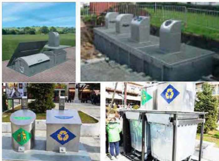
Εικόνα 5.3: Διατάξεις βυθιζόμενων κάδων