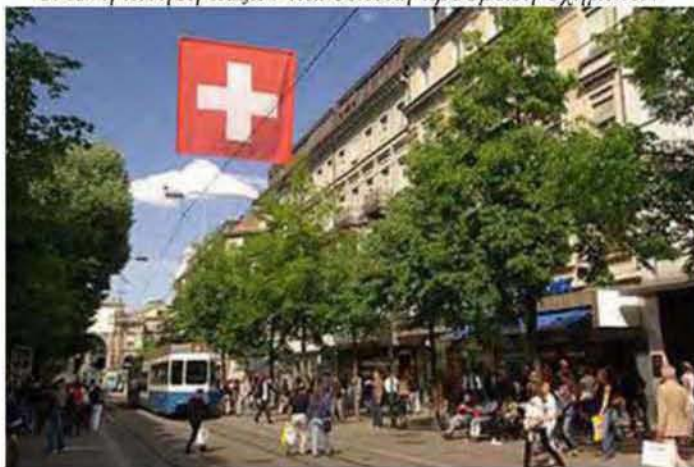
Εικόνα 2.11: Σημείο του δρόμου Bahnhofstrasse, πολυτελή καταστήματα, έντονη κίνηση πεζών και εύκολη πρόσβαση οχημάτων