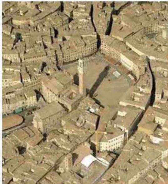
Εικόνα 2.6: Σιένα: Piazza del Campo