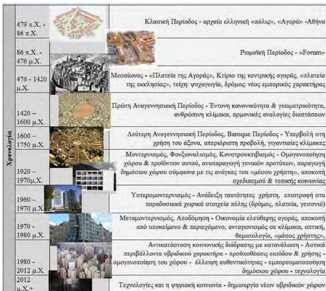
Διάγραμμα 1.1: Σημαντικοί σταθμοί στην πορεία διαμόρφωσης του δημόσιου χώρου