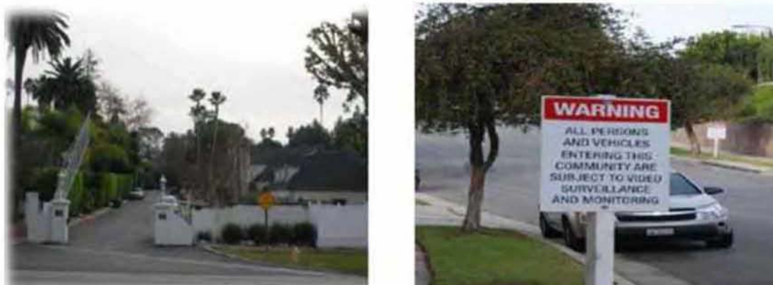
Εικόνα 3.6: Αριστερά: ελεγχόμενη είσοδος στο χώρο μιας gated community στο Los Angeles, δεξιά: ταμπέλα προειδοποίησης ύπαρξης κάμερας καταγραφής δεδομένων λίγο πριν την είσοδο στον χώρο

θεωρούν πως δεν είναι σε θέση να του παρέχουν και τους ωθεί στην επιλογή της υποχώρησης πίσω από ελεγχόμενες, οχυρωμένες ή προαστιακές κοινότητες. Τέτοιες κοινωνικές ομάδες οι οποίες αναζητούν τέτοιου είδους ελεγχόμενους χώρους ανήκουν συνήθως σε «ανώτερα» κοινωνικά στρώματα. Πρόκειται για ένα πολεοδομικό και περισσότερο κοινωνικό φαινόμενο όπου οι χρήστες τέτοιου είδους αστικού σχηματισμού οριοθετούν τον χώρο τους από κάποιον είδους περίφραξη ενώ η είσοδος σε αυτόν ελέγχεται με διάφορα μέσα. Η διάκριση των κοινοτήτων αυτών δεν μπορεί να είναι απόλυτη. Γενικά θα μπορούσαμε να διακρίνουμε τρεις βασικές κατηγορίες. Αυτές που προσφέρουν γόητρο, αυτές που συνδυάζουν κάποια δραστηριότητα ή και συνδυασμός αυτών των δύο και τέλος αυτές που εστιάζουν στην ασφάλεια. Αξίζει ωστόσο να επισημάνουμε πως οι συγκεκριμένες κοινότητες αποτελούν κυρίως παράδειγμα πόλεων του εξωτερικού, αφού στις ελληνικές πόλεις η ύπαρξη ανάλογων κοινοτήτων είναι ιδιαίτερα σπάνια. (Carmona 2010a, Nissen 2008).