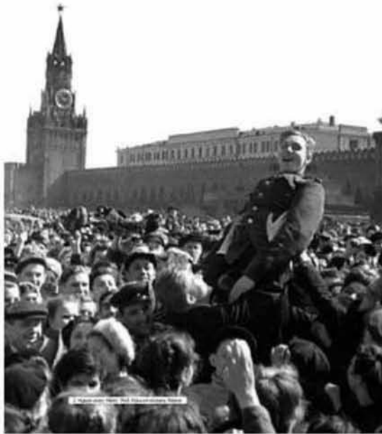
Εικόνα 2.5: Ημέρα νίκης, Μάης 1945, Κόκκινη πλατεία, Μόσχα