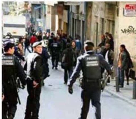
Εικόνα 3.8: Αριστερά: χώρος συγκέντρωσης μεταναστών, περιοχή Αθήνας, δεξιά: χώρος κατάληψης Ματσάγγου Βόλος