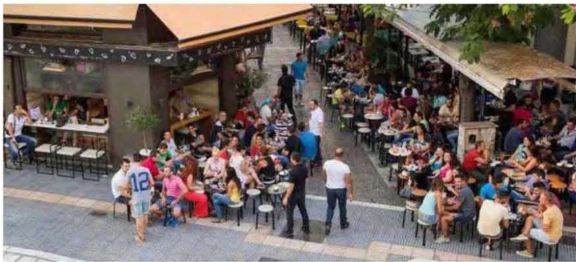
Εικόνα 3.7: Χώρος δημόσιας διεκδίκησης, περιοχή κέντρο Λάρισας