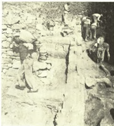
Εἰκ. 4. Ὁ τοῖχος Σ καὶ οἱ δύο ἐγκάρσιοι τοῖχοι Β καὶ Γ.

Ἡ νοτία ὄψις τοῦ τοίχου Β καὶ ἡ συνέχεια τοῦ ἀνατολικοῦ τοίχου Σ (εἰκ. 7) περιορίζουν τὸ δεύτερον, νοτιώτερον διαμέρισμα τοῦ οἰκοδομήματος, τοῦ ὁποίου τὸ δάπεδον ἦτο χαμηλότερον τοῦλάχιστον κατὰ 1,20 μ. τοῦ βορειοτέρου, ἦτοι ὅσον εἶναι τὸ ὕψος τοῦ τοίχου Β. Εἰς ἀπόστασιν 4,50 μέτρων ἀπὸ τοῦ τοίχου Β ὑπάρχει ὁ τοῖχος Γ (εἰκ. 8) ἐκ τοῦ ὁποίου σφίζονται μία ἢ δύο σειραὶ ἐκ κυανοπρασίνων λίθων σχίστου, σφριζομένου πάχους 0,60 μ. καὶ μήκους 1,66 μ. Ἡ μετὰ τοῦτον ἐπὶ 2 ἀκόμη μέτρα ἀνασκαφεῖσα προέκτασις τοῦ τοίχου Σ, (Σ') ἀκολουθοῦσα πάντοτε τὴν κατωφέρειαν, παρουσιάζει ἐσωτερικῶς ἀνώμαλον ὄψιν πρᾶγμα ὕπερ ἀποδεικνύει ὅτι τὸ νοτιώτατον τοῦτο, ὑπὸ τῶν τοίχων Γ καὶ Σ'' περιεχόμενον διαμέρισμα δι' ἐπιχώσεως ἐφθάνεν εἰς τὸ ὕψος τοῦ δαπέδου τοῦ πρὸ αὐτοῦ χώρου ἀποτελουμένου ἐκ τοῦ φυσικοῦ ἐδάφους. Τοῦτο εἶναι φανερόν καὶ ἐκ τῆς διαφόρου κατασκευῆς τῶν τοίχων Β καὶ Γ. Ὁ τελευταῖος οὗτος πιθανώτατα ἦτο διαχωριστικὸς τοῖχος δευτερευούσης μᾶλλον σημασίας.