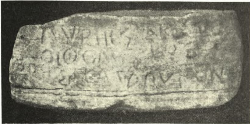
Εἰκ. 19. Ἀρχαϊκὴ ἔπιγραφὴ.

Πυρῆς Ἀκήστο- οἰφόλης ρος (ἤ)θηρησα, καταπύγων.