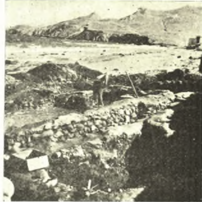
Εἰκ. 1. Ἡ Β παραλία τῆς πόλεως Νάξου μετὰ τμήματος τῶν ἀνασκαφεισῶν προϊστορικῶν οἰκιῶν.

Τὸ πάχος τῶν τοίχων εἶναι 50 περ. ἑκατοστῶν, εἶναι δὲ οὗτοι ἐκτισμένοι ἐκ μικρῶν οὐχὶ κανονικοῦ σχήματος λίθων γρανίτου καὶ πηλοῦ. Κατώφλιον θύρας δὲν ἀνεφάνη ἐπὶ τῶν ἀνασκαφέντων τμημάτων τῆς οἰκίας.