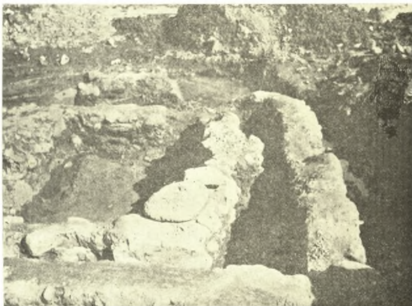
Εἰκ. 9. Τὸ νότιον δωμάτιον τῆς οἰκίας Γ μετὸν διπλοῦν τοῖχον.

Περὶ τῶν εὐρημάτων ἐν τῷ συνοικισμῷ τούτῳ ἀποτελουμένων ἀποκλει-