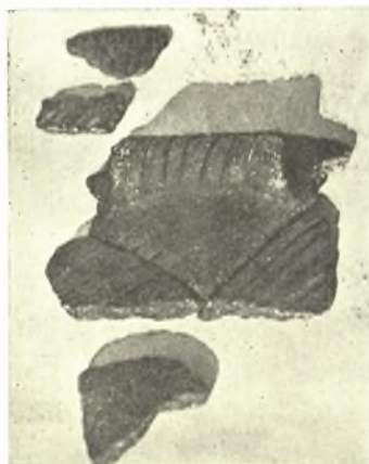
Εἰκ. 11. Ὅστρακα ἐκ μεγάλου προϊστορικοῦ ἐγχαράκτου ἀγγείου.