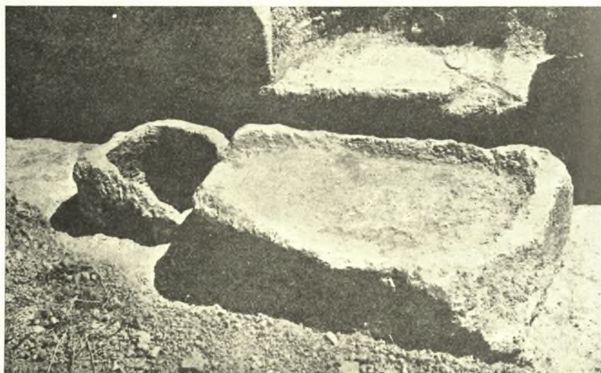
Εἰκ. 3. Τὸ πιεστήριον. Παρ' αὐτὸ φαίνεται ὁ τοῖχος τῆς δυτικῆς προσόψεως τοῦ μεγάρου.