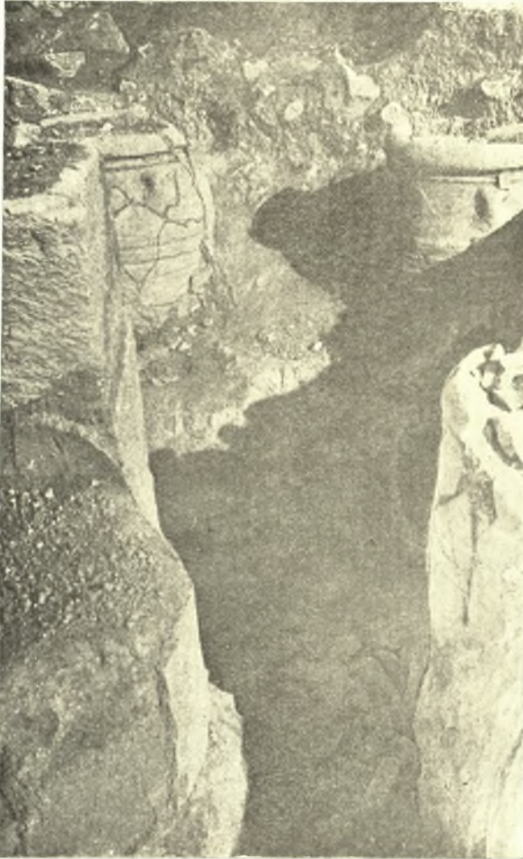
Εἰκ. 6. Τμῆμα τοῦ δωματίου τῶν πεσσῶν μετὰ πίθων. Ἄριστερὰ ἄνω φαίνεται ὁ νοτιώτερος πεσσός.

μέρη ἀκριβῶς ἐκεῖνα δὲν ὑπῆρχον πίθοι, ἐνῶ οὗτοι εἰς ἄλλα σημεῖα συνω- θοῦντο πυκνοὶ παρ' ἀλλήλους, δυνάμεθα νὰ συμπεράνωμεν ὅτι ἐπρόκειτο περὶ ξυλίνων ραφίων τοῦ τοίχου, ἐνθα ἀπέκειντο τὰ μικρὰ ἀγγεῖα.