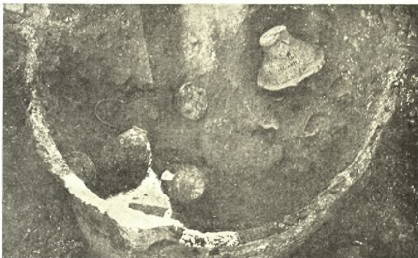
Ἐικ. 8. Πρῶτον στρώμα ἀγγείων ἐντὸς πίθου τοῦ δωματίου τῶν πεσσῶν.

Ταῦτα νοτιῶς τῆς κόγχης. Βορείως ταύτης, μετὰξὺ τοῦ ἔξωτερικοῦ τοίχου καὶ τοῦ παχυτάτου ἐσωτέρου, ὅστις ἀπαρτίζει ἓν εὐπρόσωπον δωμάτιον,