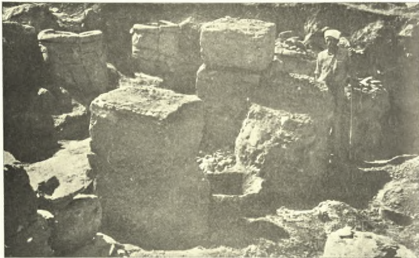
Εἰκ. 5. Ἡ ἀποθήκη τῶν πεσσῶν.

δωματίον μετὰ δύο τετραγώνων πεσσῶν, τὸ ὁποῖον, ὡς καὶ ἐν τῷ τρίτῳ μεγάρῳ Τυλίσου, ἦτο ἡ ἀποθήκη. Εὐρέθησαν κατὰ χώραν ἐντὸς αὐτοῦ 16 πίθοι, ὧν πολλοὶ διατηροῦνται ἀκέρατοι, διαστάσεων ἀνθρωπίνου ἀναστήματος ( εἰκόνες 5-6 ). Τὸ γεγονός τοῦτο δίδει καὶ τὸ μέτρον τῆς σπουδαιότητος τοῦ μεγάρου, διότι μόνον εἰς μεγάλα μέγαρα ἀπαντῶμεν τόσον εὐρυχώρους ἀποθήκας. Ὑπάρχουσι δὲ ἐνδείξεις, ὅτι αὕτη δὲν ἦτο ἡ μόνη ἀποθήκη,