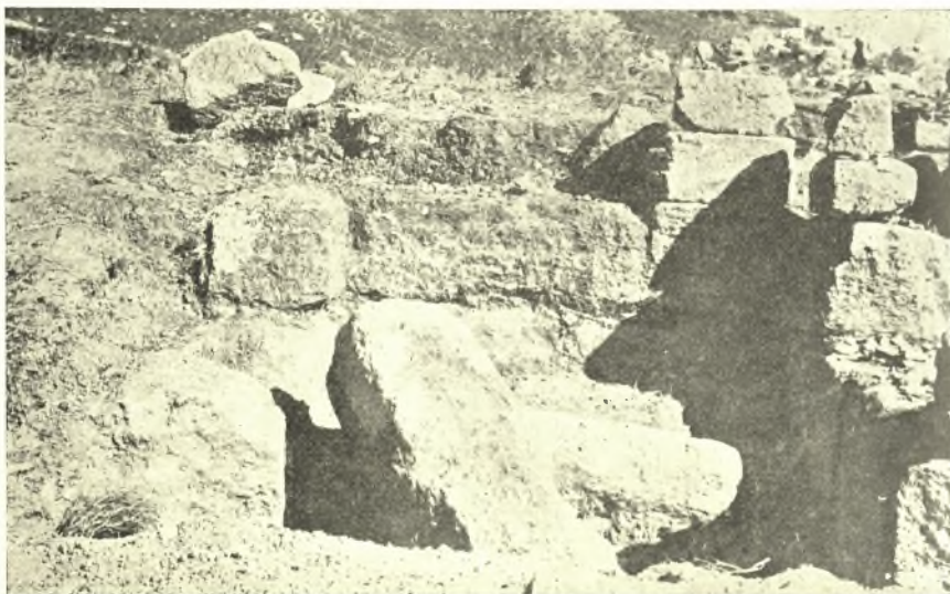
Εἰκ. 2. Λίθοι πεπτωκότες ἐντὸς τῆς δυτικῆς κόγχης.