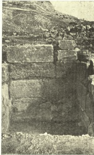
Εἰκ. 4. Ἡ δυτικὴ κόγχη μετὰ τοῦ κτιστοῦ θρανίου.

Πράγματι, ἀμέσως συναπτόμενον μετὰ τῆς κόγχης πρὸς Ν εὐρέθη μέγα