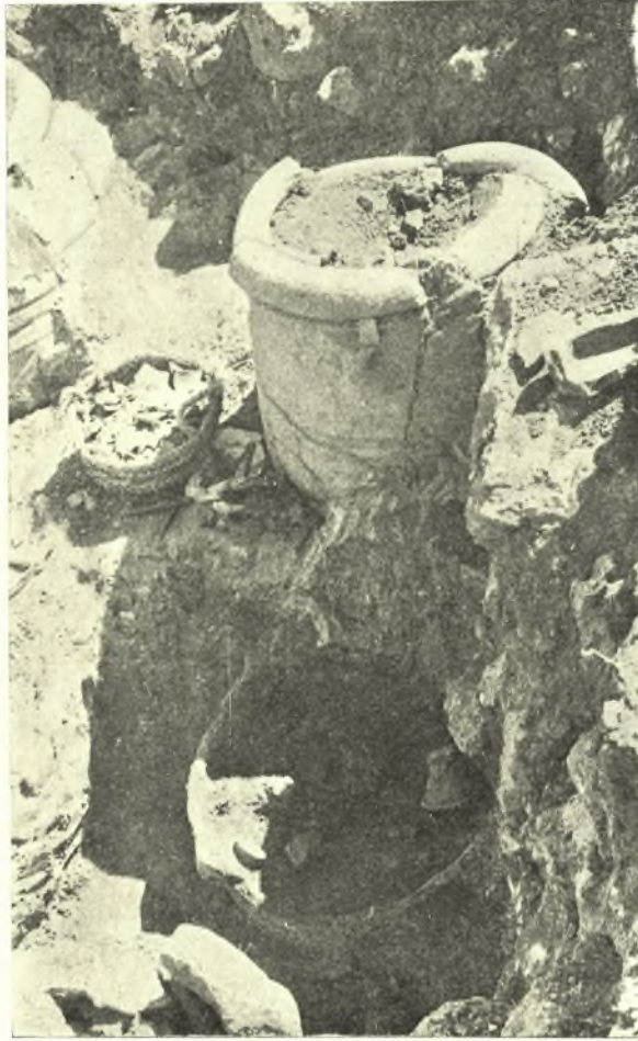
Εἰκ. 7. Μικρὰ ἄγγεῖα ἐντὸς πίθου.

ἄγγειων, κυρίως μονώτων καὶ ἀώτων κυάθων, μετ' ἀρκετῶν τεμαχίων ἀνθρώπων (εἰκόνας 7-8). Ἐν ἓκ τῶν ἄγγειων ἦτο τάλαρος, μιμούμενος γραπτῶς