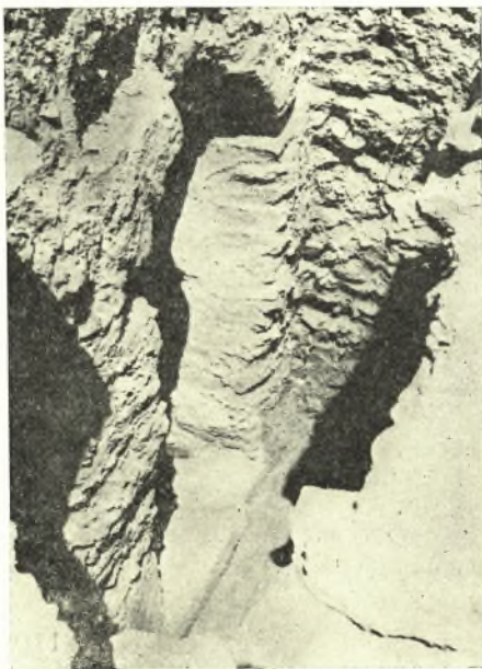
Εἰκ. 6. Ἡ εἴσοδος τοῦ ὀστεοφυλακίου, θεωμένη ἐκ τῶν ἄνω, ἀπὸ Ν.

2. Κατὰ τὴν βάσιν τῆς ἐσωτερικῆς πλευρᾶς τοῦ τοίχου τῆς Β κεραίας τοῦ καθολικοῦ ὑπάρχει στενὸν ἄνοιγμα, ἐν εἴδει καταπακτῆς, χρησιμεῦον διὰ