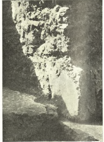
Εἰκ. 10. Τὸ κατώτερον τμήμα τῆς Ν παραστάδος μετὰ τοῦ οὐδοῦ τῆς εἰσόδου.

φυλακίου προήρχοντο ἐξ ἐπιχωματώσεων σχετικῶς προσφάτων, τὸ πολὺ τοῦ παρελθόντος αἰῶνος, μεταξὺ δ' αὐτῶν ὑπάρχουν μικρὰ θραύσματα μεταγενεστέρων εὐτελῶν βυζαντινῶν κεραμουρρημάτων, ἀνθρώπινα ὀστά κλπ.