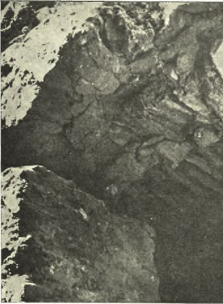
Εἰκ. 9. Τμήμα τῆς Ν παραστάδος τοῦ ὄστεοφυλακίου, μετὰ τοῦ ὑπερκειμένου τόξου.

Χαρακτηριστικὸν εἶναι ὅτι πάντα τὰ μετακινηθέντα χρώματα καὶ διὰ τὴν ἀποκάλυψιν τῶν θεμελίων καὶ διὰ τὴν διάνοξιν τῆς θύρας τοῦ ὑπογείου ὄστεο-