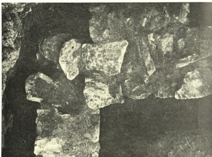
Εἰκ. 4. Τὸ σημεῖον συναντήσεως τοῦ τοῖχου Α καὶ τοῦ κτιρίου Β.