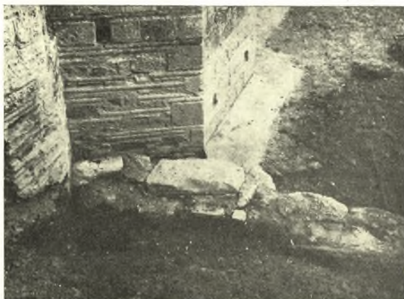
Εἰκ. 3. Ὁ τοῖχος Α ἀπὸ νότου.