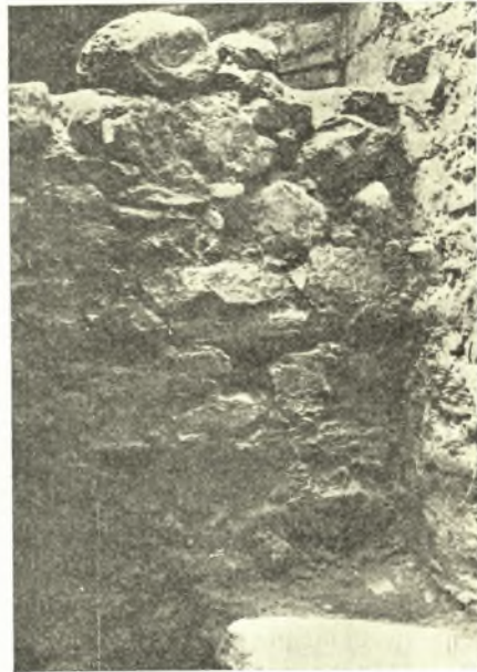
Εἰκ. 8. Ὁ ἀναλημματικὸς τοῖχος Δ.

Ἡ αἰθουσα εὐρέθη πλήρης χωμάτων, λίθων καὶ ἀνθρωπίνων ὀστέων ἀτάκτως ἐρριμένων, ἀλλὰ καὶ παντοίων ἀπορριμμάτων νεωτέρας ἐποχῆς. Ἡ διαπίστωσις ὅτι τὰ ὀστᾶ εὐρί- σκονται εἰς τὰ χαμηλότερα στρώματα δηλοῖ ὅτι, ἐφ' ὅσον ἵκμαζεν ἡ Μονή,