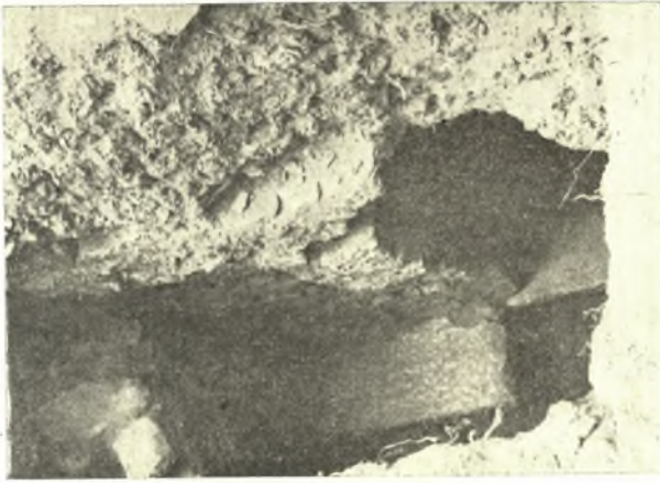
Εἰκ. 7. Ἡ εἴσοδος μετὰ τοῦ παρ' αὐτὴν ἀναλημματικοῦ τοίχου Δ θεωμένη ἐκ τῶν ἄνω, ἀπὸ βορειοανατολικά,

ἐξακριβωθῆ ἑφέτος ἡ ἔκτασις τῆς πρὸ τῆς αἰθούσης ἀλλῆς, οὔτε καὶ ὁ τρόπος προσβάσεως πρὸς αὐτήν.