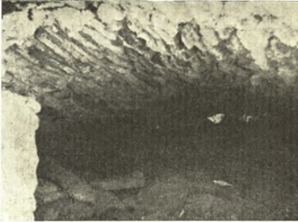
Εἰκ. 5. Ἡ ὄροφή τοῦ ὀστεοφυλακίου.

χθη, ἐντὸς δὲ τοῦ παχέος ἀσβεστοῦχου πηλοῦ διακρίνονται σπάνια τεμάχια πλίνθων ἕξ ὀπτῆς γῆς, ἀτάκτως τοποθετημένα. Οἱ τοῖχοι οὗτοι βυθίζονται ἐντὸς τοῦ ἐδάφους πέραν τῶν 2 μ. εἰσέτι. Ἰχνος κονιάματος ἢ ἐτέρου ἐπιχρίσματος καλύπτοντος τὴν ἐπιφάνειαν αὐτῶν δὲν ἀνευρέθη. Συνεπῶς, δεδομένης τῆς στάθμης εἰς ἣν εὐρίσκονται, οἱ ἀποκαλυφθέντες τοῖχοι πρέπει νὰ