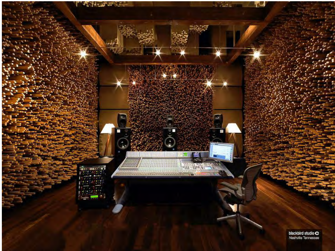
Εκφ. 8: Blackbird studio C, στο Nashville

εγγενώς, μια μορφή τέχνης με δικούς της νόμους και ελευθερίες, πολύ ιδιαίτερα προβλήματα και εξαιρετικές δυνατότητες.