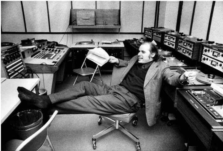
Εικ. 5: Εν ώρα χαλάρωσης σε κάποιο στούντιο ηχογράφησης, δέκα χρόνια μετά την απόσυρση του από τις αίθουσες συναυλιών.

Μέσω της ηχογράφησης θα ήταν εφικτό και σχετικά εύκολο να δοθεί στον ακροατή η δυνατότητα να πραγματοποιήσει μοντάζ κατά βούληση. Αν του αρέσουν από μια ερμηνεία κάποια στοιχεία και από μια άλλη κάποια άλλα, μπορεί έχοντας μια παλέτα επιλογών να αναδιαμορφώσει και να δημιουργήσει μια καινούρια δική του ιδανική ερμηνεία. Έχουμε δηλαδή έναν ακροατή περισσότερο μέτοχο από ποτέ. Γίνεται ο ίδιος μοντέρ.