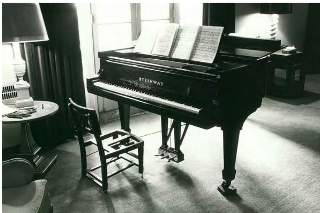
Εικ. 1: Φωτογραφία από το διαμέρισμα του Glenn Gould 01/1983.

Σε έναν ιδανικό (τέλειο) κόσμο, η τέχνη θα ήταν περιττή. Η αναρρωτική, κατασταλτική θεραπεία που προσφέρει θα εκλιπαρούσε για ασθενείς· η επαγγελματική εξειδίκευση που εμπεριέχεται στη δημιουργία της θα αποτελούσε ύβρι· οι γενικότητες που αφορούν την εφαρμογή της θα θεωρούνταν προσβλητικές. Καλλιτέχνης τότε θα ήταν το κοινό, και τέχνη η ζωή του.