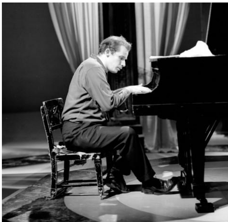
Εικ. 2: Ο Glenn Gould κατά την διάρκεια Συναυλίας

Είναι πολύ πιθανό λοιπόν αυτή η αντίδρασή μας να είναι προσποιητή; Ίσως και αυτή να είναι τεχνητή. Ίσως εκεί να στοχεύει το όλο πολύπλοκο λεξιλόγιο της μουσικής εκπαίδευσης. Στο να καλλιεργεί απλώς αντιδράσεις σε συγκεκριμένα σύνολα συμβολικών ήχων. Ίσως και στην αρχιτεκτονική οι αντιδράσεις μας να είναι προσποιητές και να παράγονται από το παράξενο, πρωτόγνωρο θέαμα που κάποιος έκανε εντέχνως και τεχνητά, για να λάβει τον ανάλογο τεχνητό θαυμασμό.