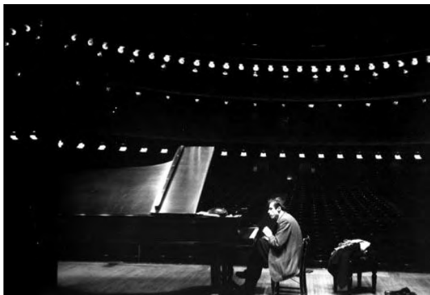
Εικ. 6: Συναυλία στο Carnegie Hall, 1959

Κατ' αντιστοιχία και στην αρχιτεκτονική θα λέγαμε ότι αν είναι να κάνει κάποιος κάτι μόνο για να το κάνει και να προκαλέσει την προσοχή γύρω από το όνομα του μπορεί εύκολα να το κάνει. Χρειάζεται όμως ένα σοβαρό άλλο λόγο για να το κάνει. Να έχει να πει κάτι περισσότερο από την οχλοβοή και τα φλας της δημοσιότητας. Και αυτός ο λόγος πρέπει να υπάρχει από πριν. Πριν ακόμα κάτσει στο σχεδιαστήριο. Επίσης ο μέσος πελάτης μπορεί να μην καταλαβαίνει όλες τις προθέσεις ενός καλού αρχιτέκτονα, όμως εκτιμά το τί μπορεί να κάνει για να βελτιώσει την καθημερινότητά του.