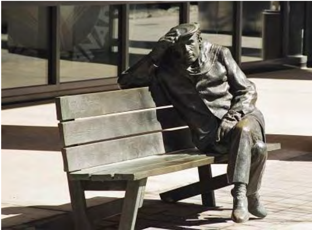
Εικ. 10: Άγαλμα παγκάκι στη πλατεία CBC's του Τορόντο

όσο και από συγκροτήματα που θα φιλοξενοούνται στο χώρο. Όταν δεν θα υπάρχουν ηχογραφήσεις μπορεί κάποιος απλός ακροατής να πάει και να κάνει το μοντάζ κάποιου έργου σύμφωνα με τις προτιμήσεις του.