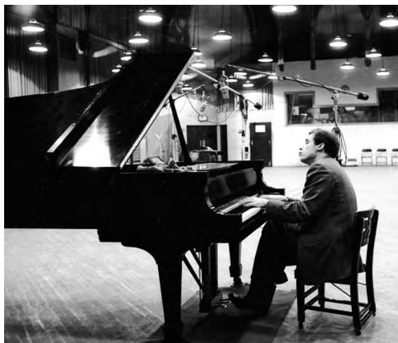
Εικ. 4: Εν ώρα ηχογράφησης

Ο Glenn ήθελε να κάνει κάτι με το πιάνο το οποίο θα είχε μόνιμο χαρακτήρα. Από την άλλη στις συναυλίες αισθάνονταν πώς ότι έκανε χάνονταν για πάντα και αυτό του προκάλούσε μεγάλη απογοήτευση. Όχι πως όλες του οι συναυλίες, όπως λέει, ότι ήταν καλές και άξιζαν να διασωθούν αλλά κάποιες πραγματικά καλές θεωρούσε ότι χάνονταν μαζί με την μνήμη εκείνων που βρίσκονταν στο ακροατήριο.