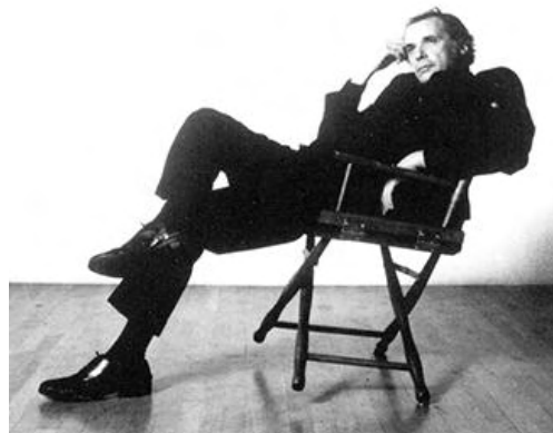
Εικ. 3: Ο πιανίστας Glenn Gould (1932-1982)

Ήθελε την μουσική εμπειρία αποκομμένη απ' οτιδήποτε περιττό. Οτιδήποτε προκαταβάλλει τον ακροατή και δημιουργεί συγκεκριμένες προσδοκίες είναι περιττό και επικίνδυνο πολλές φορές. Γι' αυτό και ο ερμηνευτής θα πρέπει να είναι ανώνυμος,