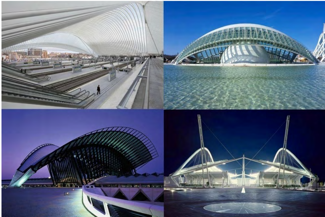
Εικ. 7: Αρχιτεκτονική τύπου Cory Paste από σταρ αρχιτέκτονα

αρχιτέκτονες οι οποίοι προσπαθούν συνεχώς μέσα από την δουλειά τους να παράξουν έργο πρωτότυπο και καινοτόμο ή έστω εργάζονται μεθοδικά και εμμονικά πολλές φορές κατ' εικόνα και ομοίωση με αυτή της ηχογράφησης. Λήψη ένα, δύο..., δοκιμή τέσσερα..., επεξεργασία..., μοντάζ... διορθώσεις στα σημεία τρία, πέντε, οκτώ..., μοντάζ..., αποθήκευση... κλπ