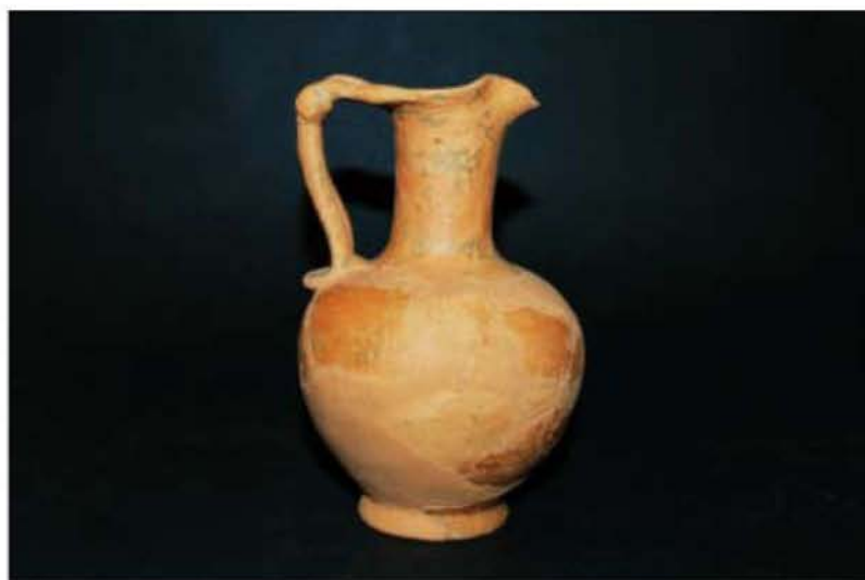
Τριφυλλόστομη Οινόχνη (350 – 250 π.Χ.)