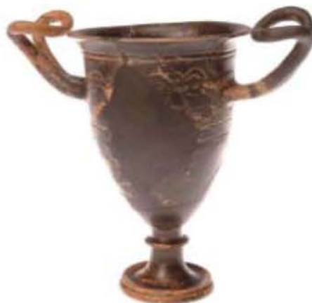
Κάνθαρος με διακόσμηση (τέλη 4 ου – αρχές 3 ου αι. π.Χ.)