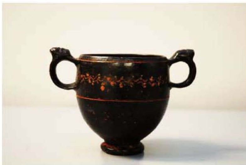
Μελαμβαφής Κάνθαρος (325 – 225 π.Χ.)