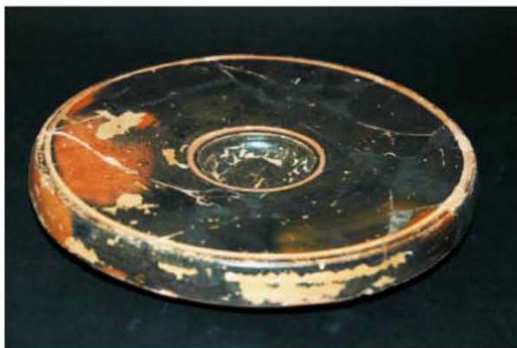
Μελμβραφές Ιχθυοπνάνκιο (350 – 300 π.Χ.)