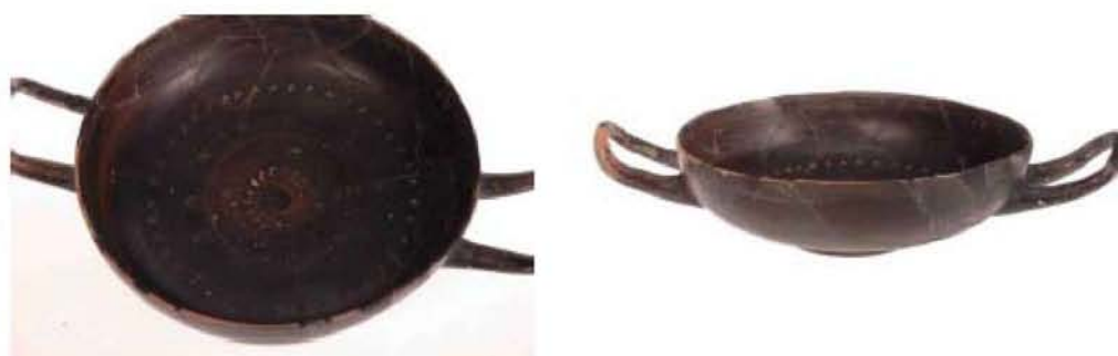
Μελαμβαφής Κύλικα (430 – 420 π.Χ.)