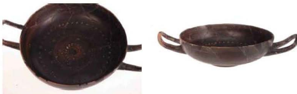
Μελαμβαφής Κύλικα (430 – 420 π.Χ.)