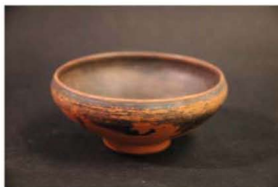
Λεπτο Σκαφιότιο (4 ος αι. π.Χ.)