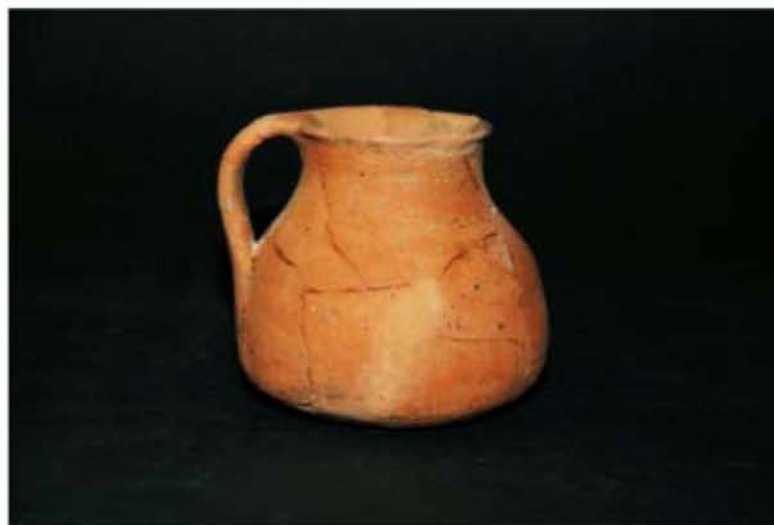
Αρντήρας (τέλη 4 ου – αρχές 3 ου αι. π.Χ.)