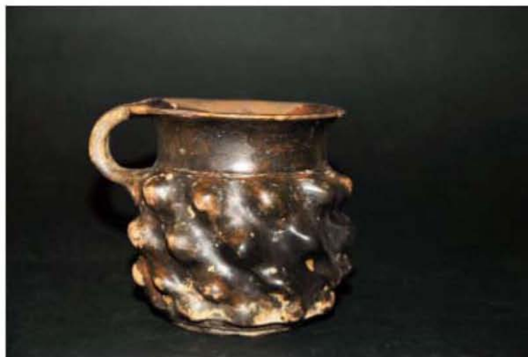
Μελμβραφές Κύπελλο με μαστοιχιδείς αποφύσεις (425 – 400 π.Χ.)