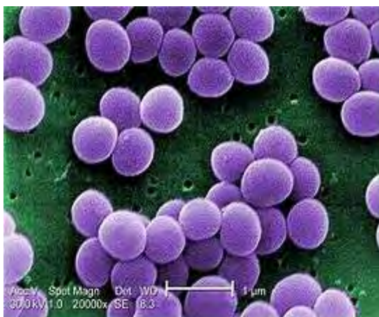
Ηλεκτρονική μικρογραφία του S. aureus , 20,000x

Το μέγεθος του γενώματος των στελεχών του Staphylococcus aureus είναι 2,82-2,9 Mbp. Επτά στελέχη Staphylococcus aureus έχουν πλήρως αποκωδικοποιηθεί. Το