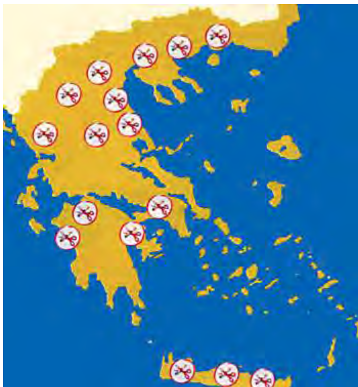
Εικόνα 3. Ιατρεία διακοπής καπνίσματος ανά την Ελλάδα

Κατά τη συμβουλευτική παρέμβαση, ο ιατρός παρέχει ψυχολογική υποστήριξη με γνώμονα τις ιδιαιτερότητες του συγκεκριμένου καπνιστή. Παροτρύνει τον ασθενή, προσπαθώντας να του δείξει το γιατί η διακοπή του καπνίσματος τον αφορά προσωπικά. Αναλύονται οι βραχυπρόθεσμοι και μακροπρόθεσμοι κίνδυνοι για τον ίδιο και το περιβάλλον του και συζητούνται τα προβλήματα που μπορούν αν ανακύψουν κατά τη διαδικασία (τα συμπτώματα στέρησης, ο φόβος της αποτυχίας, η αύξηση του βάρους, η έλλειψη υποστήριξης, η κατάθλιψη, η απόλαυση από το κάπνισμα). Γίνεται προγραμματισμός επισκέψεων παρακολούθησης ή τηλεφωνική επικοινωνία με τον ασθενή, ενώ μπορεί να αποφασιστεί και η παραπομπή του ασθενή σε αρμόδιο φορέα που παρέχει συμβουλευτική αγωγή ή ψυχολογική υποστήριξη για τη διακοπή του καπνίσματος ( Πίνακες 8 & 9).