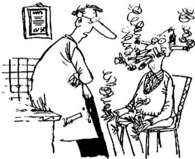
Εικόνα 1: Ο ιατρός αντιμέτωπος με συστηματικό καπνιστή