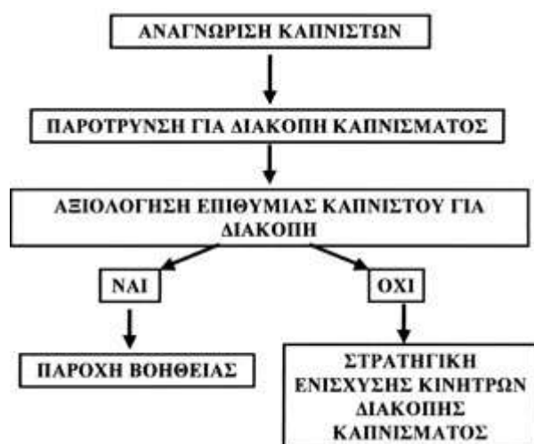
Εικόνα 2. Αξιολόγηση καπνισματικής συνήθειας

Στην περίπτωση αυτή επιλέγεται η στρατηγική ενίσχυσης κινήτρων διακοπής του καπνίσματος. Στον καπνιστή τονίζεται η σπουδαιότητα που έχει για τον ίδιο η διακοπή του καπνίσματος, υπενθυμίζονται οι κίνδυνοι από το κάπνισμα και τα οφέλη από τη διακοπή του και αναγνωρίζονται τα εμπόδια που προκύπτουν κατά την προσπάθεια. Επίσης υπογραμμίζεται στον καπνιστή ότι πολλές φορές η διακοπή επιτυγχάνεται μετά από πολλές προσπάθειες και ότι δε θα πρέπει να αποθαρρύνεται από τις υποτροπές. Ο επαγγελματίας υγείας παρέχει ένα φάσμα επιλογών στον καπνιστή σχετικά με τις πρακτικές που μπορεί να ακολουθήσει ( Anderson et al 2002).