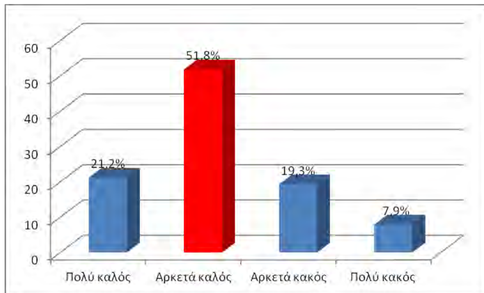
Γράφημα 2. Αξιολόγηση δυσκολίας σε καθημερινές εργασίες