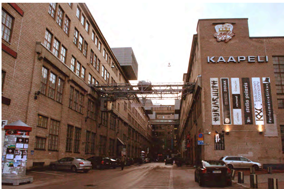
Φωτο8: Η κεντρική είσοδος του Cable factory