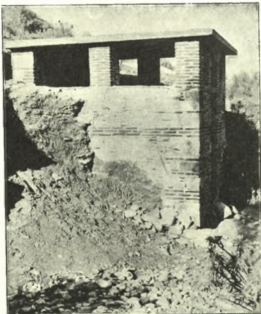
Εἰκ. 2. Τὸ νεκρικὸν δωμάτιον, ὡς εἶναι σήμερον, ἀνακτισθέν.

σαρες τάφοι καλῶς ἐκτισμένοι εἰς βάθος, οἱ τρεῖς παράλληλοι κατὰ κάθετον γραμμὴν πρὸς τὸν κατεστραμμένον τοῖχον καὶ ὁ τέταρτος ἐγκάρσιος πρὸς αὐτοὺς εἰς τοὺς πόδας τοῦ ἀπέναντι τοίχου. Εἶναι δὲ οἱ τάφοι κανονικώτατα διαρρυθμισμένοι πρὸς ταφὴν ἀνθρώπων ὠρίμου ἡλικίας. Ὑπεράνω τοῦ τελευταίου τούτου τάφου, ὡς δεικνύουν ἴχνη ἀσβέστου, εἶχε τοποθετηθῇ καὶ πέμπτος τάφος, προφανῶς μετὰ τὴν ταφὴν τῶν τεσσάρων νεκρῶν καὶ τὴν