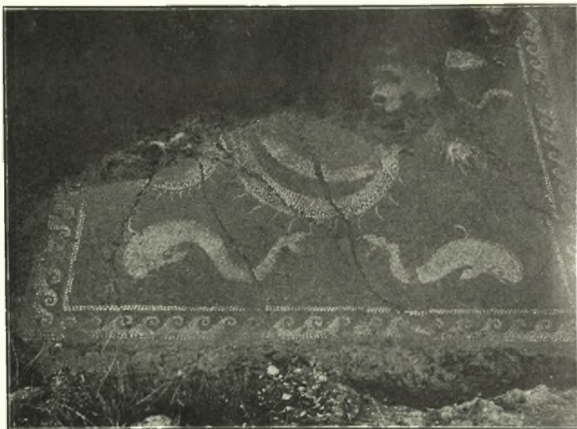
Εἰκ. 5. Ψηφιδωτὸν δάπεδον ἐν Πελλάνη.

καὶ τὴν χρῆσιν μικρῶν καὶ δύο μόνον χρωμάτων ψηφίδων καὶ δὴ στρογγύλων, μοὶ ἐμβάλλουσι τὴν ὑπόνοιαν, ὅτι τὸ ψηφιδωτὸν εἶναι ἑλληνιστικῶν χρόνων, ἢ μὴ καὶ ἀρχαιότερον. Ὡς παράλληλα παραδείγματα διὰ στρογγύλων ψηφίδων ἑλληνικῶν καὶ ἑλληνιστικῶν ψηφιδωτῶν ἀναφέρω τὸ τοῦ ἐν Ὀλυμπίᾳ ναοῦ τοῦ Διὸς 1 , τὰ τῶν οἰκιῶν τῆς Δήλου 2 καὶ τὰ ἐσχάτως ἐν Ὀλύνθῳ 3 ὑπὸ τῶν Ἀμερικανῶν εὐρεθέντα, τασσόμενα ἀπὸ τοῦ 4 ου μέχρι τοῦ 2 ου π. Χ. αἰῶνος.