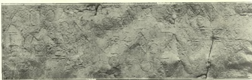
Εἰκ. 8. Φωτογράφημα ἐκτύπου τῆς ὑπ' ἀριθ. 3 ἐπιγραφῆς.

3. Βάθρον ὀρθογώνιον τεθραυσμένον εἰς τρία (διαστ. 0.90 \times 0.295 \times σ. πλ. 0.19). ἔξ ἀμυγδαλίτου λίθου, εὗρεθὲν ἐν τῷ κτήματι τοῦ Βλ. Γεννάτου κειμένῳ εἰς τὴν ρίζαν τῆς Ν. Δ. κλιτύος τῆς Τσέρκοβας. Φέρει ἄνωθεν κοιλότητα βάθους 0.08 πρὸς ὑποδοχὴν τῆς πλίνθου ἀγάλματος, εἰς τὴν ἀνάθesis τοῦ ὁποίου ἀναφέρεται ἡ ἀκόλουθος ἐπὶ τῆς ὀρθῆς πλευρᾶς του κεχαραγμένη δωρίζουσα ἐπιγραφή, (εἰκ. 8).