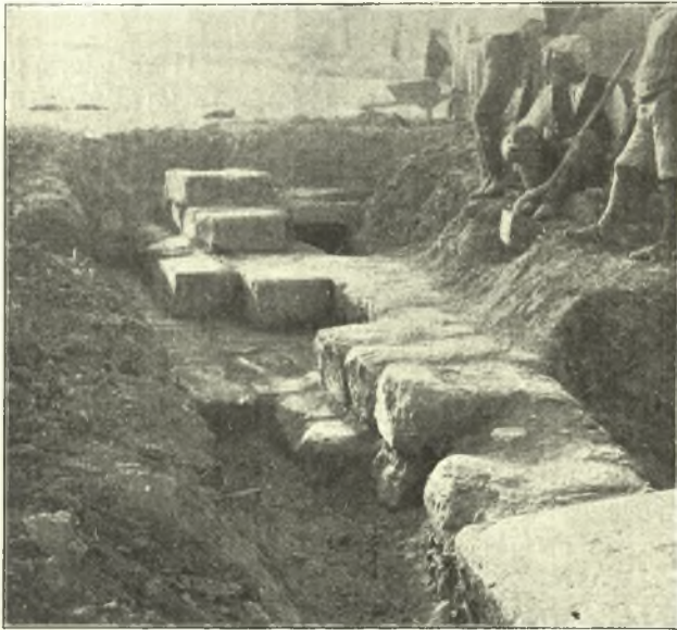
Εἰκ. 1. Λείψανα τῆς κρηπίδος ναοῦ.

Τὸ μέγεθος καὶ ὁ προσανατολισμὸς τοῦ οἰκοδομήματος χαρακτηρίζουσιν αὐτὸ ὡς ναόν, ὃ ὅποῖος φαίνεται ὅτι κατὰ τοὺς χριστιανικοὺς χρόνους θὰ μετετράπη εἰς ἐκκλησίαν 1 κατόπιν δὲ καὶ εἰς κοιμητήριον, ὡς ἐμφαίνεται ἐκ τῶν παρατηρηθέντων ἰχνῶν τῆς ἀψίδος τοῦ ἱεροῦ καὶ ἐκ τάφων χριστιανικῶν ἀνοιχθέντων ἐντὸς τῶν λίθων τοῦ ἀρχαίου κρηπιδώματος. Ἐξ ἑνὸς μάλιστα τῶν τάφων τούτων προέρχεται καὶ τεμάχιον ὄραίου χαλκοῦ «βασταγίου»