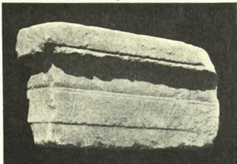
Εἰκ. 2. Ἐπίκρανον παραστάδος.

3) Ἐπίκρανον παραστάδος ὀλικοῦ ὕψους 0.33, ἀριστερὰ τεθραυσμένον. Συνίσταται ἐξ ἄβακος, ὑψηλοῦ δωρικοῦ κυματίου καὶ πλατείας κάτωθεν αὐτοῦ ταινίας (εἰκ. 2).