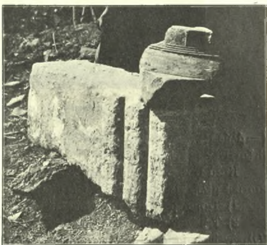
Εἰκ. 3. Γωνιαία τρίγλυφος καὶ τμήμα κιονοκράνου.

Ὁ Πausanias ἀναβαίνων ἀπὸ τοῦ ἐπινείου τῆς Πελλήνης Ἀργοναυτῶν (ἢ Ἀριστοναυτῶν, παρὰ τὸ σημερινὸν Ξυλόκαστρον) εἰς τὴν πόλιν συναντᾷ πρῶτον τὸν ναὸν τῆς Ἀθηνᾶς, ὅπου ἦτο ἀνιδρυμένον τὸ χρυσελεφάντινον ἄγαλμα τῆς θεᾶς, ἔργον τοῦ Φειδίου. Ὁ ναὸς οὗτος ἦτο κατὰ τὸν αὐτὸν περιγητήν, ἐκ λίθου ἐγχωρίου κατεσκευασμένος. Καὶ ἡ μὲν θέσις καὶ τὸ ὄλικόν τοῦ ἀνευρεθέντος ἐν Σεντερήνῃ, κρηπιδώματος συμφωνοῦν πρὸς τὰ ὑπὸ τοῦ Πausanίου λεγόμενα, ἀλλὰ τὰ ἀρχιτεκτονικὰ μέλη δὲν δύνανται νὰ ἀναχθῶσιν εἰς χρόνους ἀρχαιοτέρους τοῦ 430 π. Χ. (διπλὴ ὑποτομή, καμπύλη ἐχίνου). Μόνον δ' οἱ λίθοι τῆς κρηπίδος, οἵτινες παρουσιάζουσι τὸ ἀρχαϊκὸν διὰ λιθάγρας σύστημα ἀνελκύσεως δύνανται