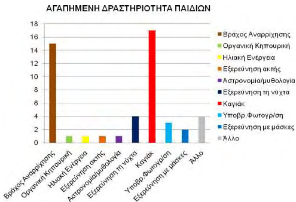
Σχήμα 2. Ο αριθμός των παιδιών που συγκέντρωσε κάθε δραστηριότητα ανάλογα με την προτίμησή τους.

Ως αγαπημένη δραστηριότητα των παιδιών, το μεγαλύτερο ποσοστό προτίμησης συγκέντρωσε το καγιάκ (34.7%) και ακολουθούσε ο βράχος αναρρίχησης (30.6%). Στο σχήμα που ακολουθεί φαίνονται αναλυτικά τα ποσοστά προτίμησης που συγκέντρωσε η κάθε δραστηριότητα.