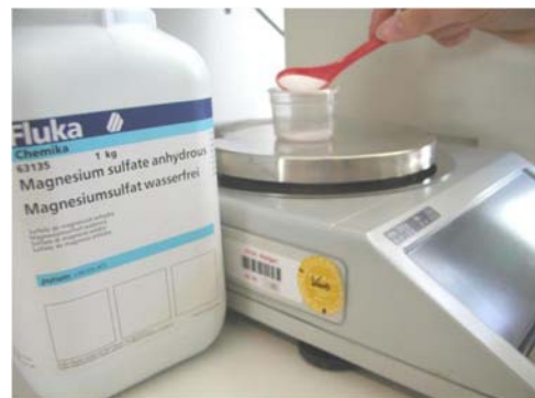
Εικόνα 4. Ζύγιση 4gMgSO 4 και 1gNaCl