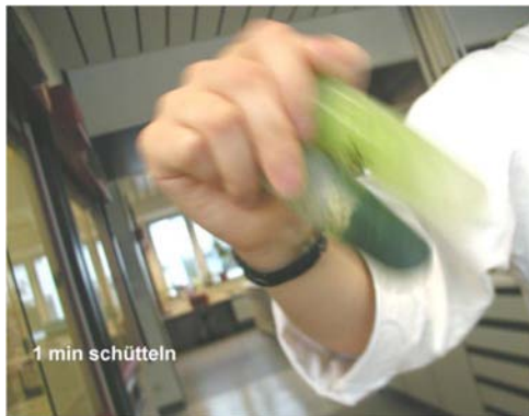
Εικόνα 3. Ζωρή ανακίνηση 1min