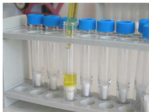
Εικόνα 12. Προσθήκη του εκχυλίσματος στο σωλήνα και ανακίνηση για 30s