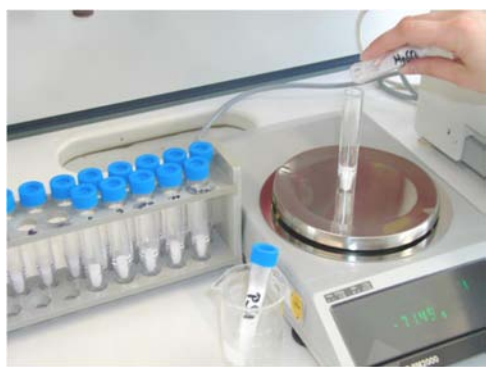
Εικόνα 11. Ζύγιση MgSO_4 και PSA