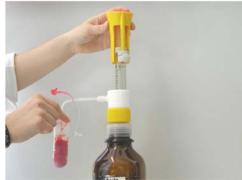
Εικόνα 2. Προσθήκη 10 mL Ακετιλονιτρίλιο