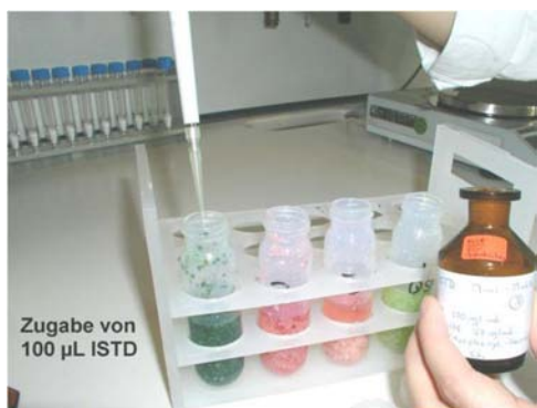
Εικόνα 7. Προσθήκη ISTD