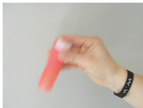
Εικόνα 8. Ανακίνηση 30s