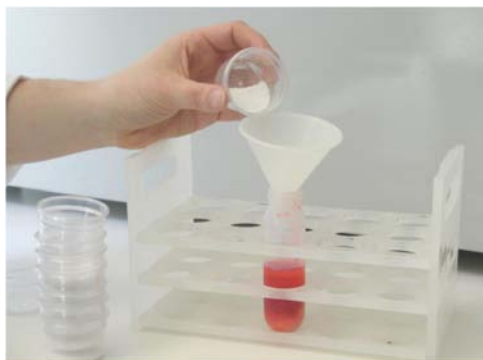
Εικόνα 5. Προσθέτουμε στο σωλήνα