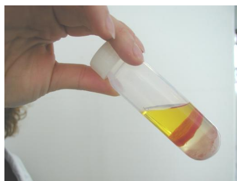
Εικόνα 10. Διαχωρισμός των φάσεων του εκχυλίσματος