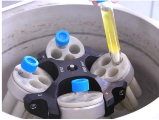
Εικόνα 13. Φυγοκέντρηση για 30s