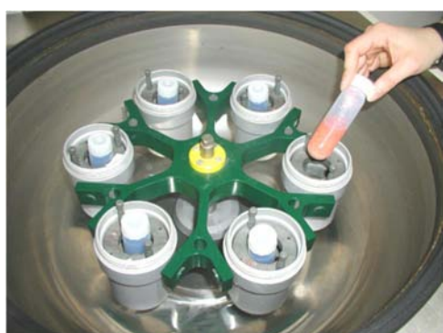
Εικόνα 9. Φυγοκέντρηση 5min