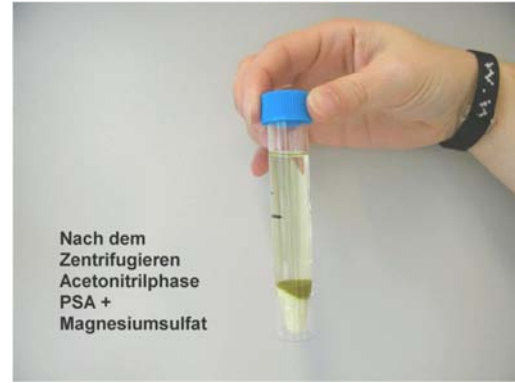
Εικόνα 14. Καθαρισμός του εκχυλίσματος