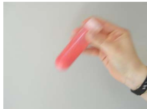
Εικόνα 6. Ζωρή ανακίνηση για 1min