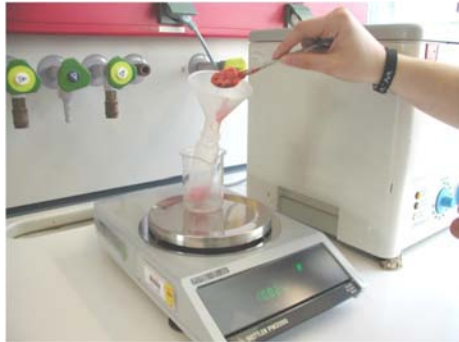
Εικόνα 1. Ζύγιση του δείγματος