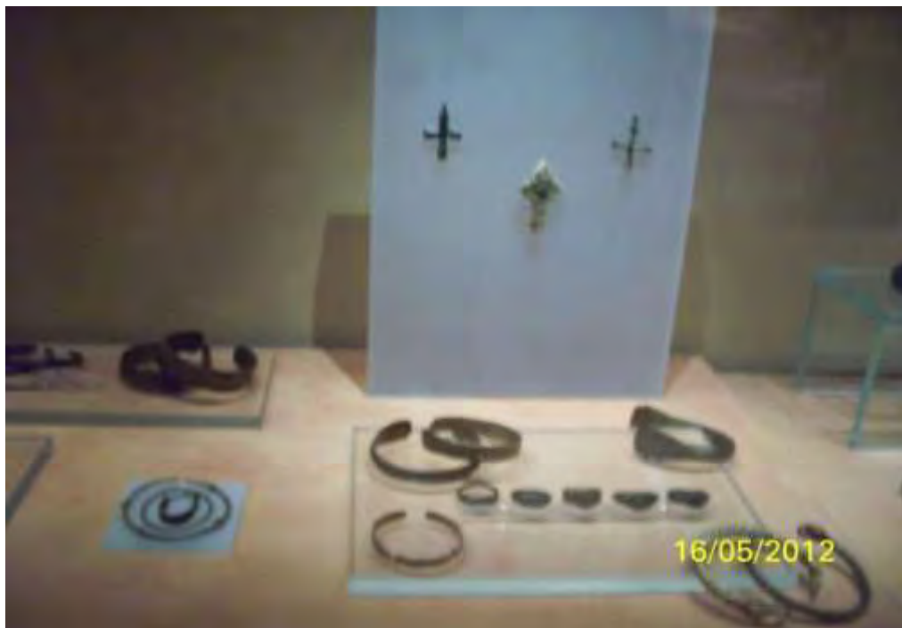
Ομάδα: Τα κοσμήματα των γυναικών