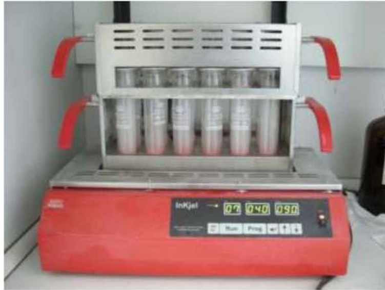
Εικόνα 24. Συσκευή πέψης για μετατροπή του αζώτου σε αμμωνιακά άλατα

Στη συνέχεια, αφού τα δείγματα παρέμειναν στη συσκευή πέψης για 1,5 ώρες, απομακρύνθηκαν από τη συσκευή και αφήθηκαν για μισή ώρα στη συσκευή δέσμευσης των ατμών της πέψης (απαγωγό), ώστε να κρυώσουν και να καταστεί δυνατή η περαιτέρω επεξεργασία τους (Εικ.25).