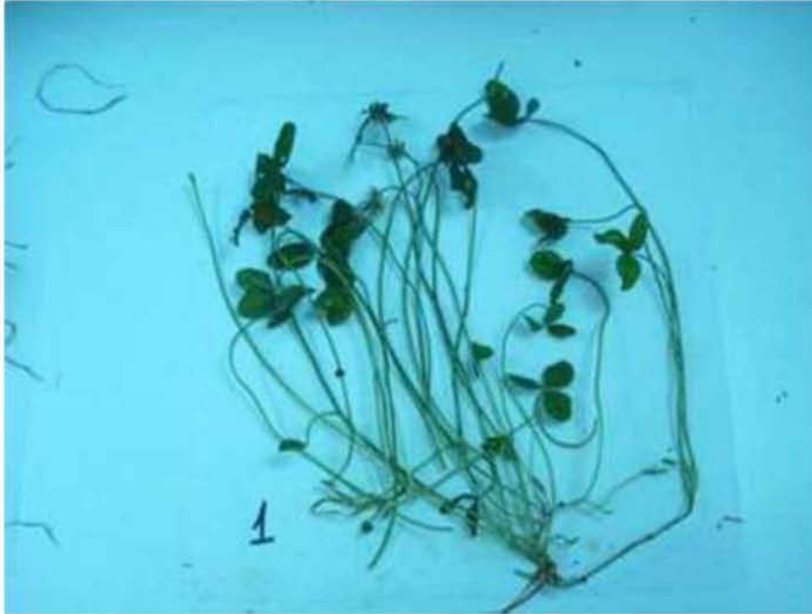
Εικόνα 5. Τριφύλλι Έρπον ( Trifolium repens )