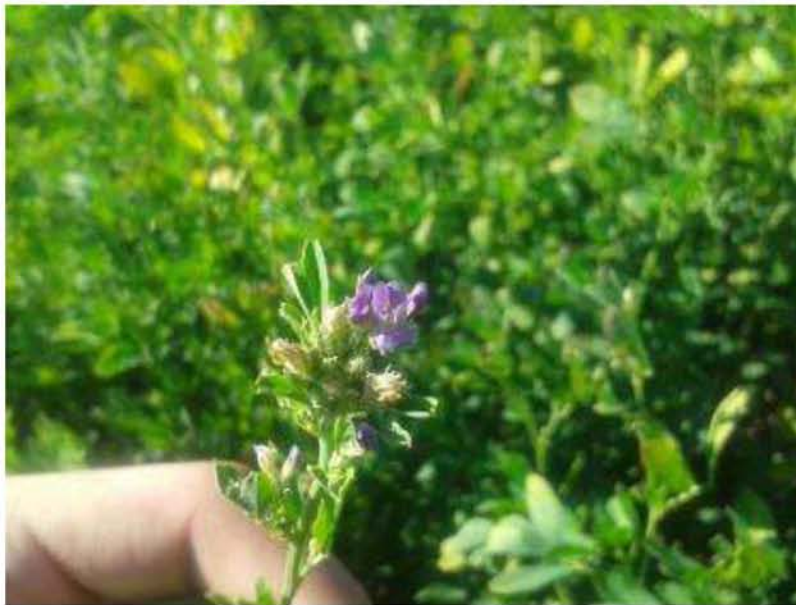
Εικόνα 3. Ανθοταξία Μηδικής

Τα άνθη της μηδικής εκφύονται σε επάκρειους πυκνούς βότρεις και έχουν χρώμα ανοιχτό έως σκούρο ιώδες με αποχρώσεις του κόκκινου ή προς το μπλε, ανάλογα με την ποικιλία (Εικ.3). Η μηδική είναι φυτό σταυρογονιμοποιούμενο και για την επικονίαση είναι απαραίτητη η παρουσία εντόμων.