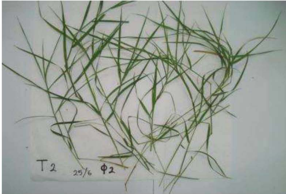
Εικόνα 18. Φωτογράφιση φυτών