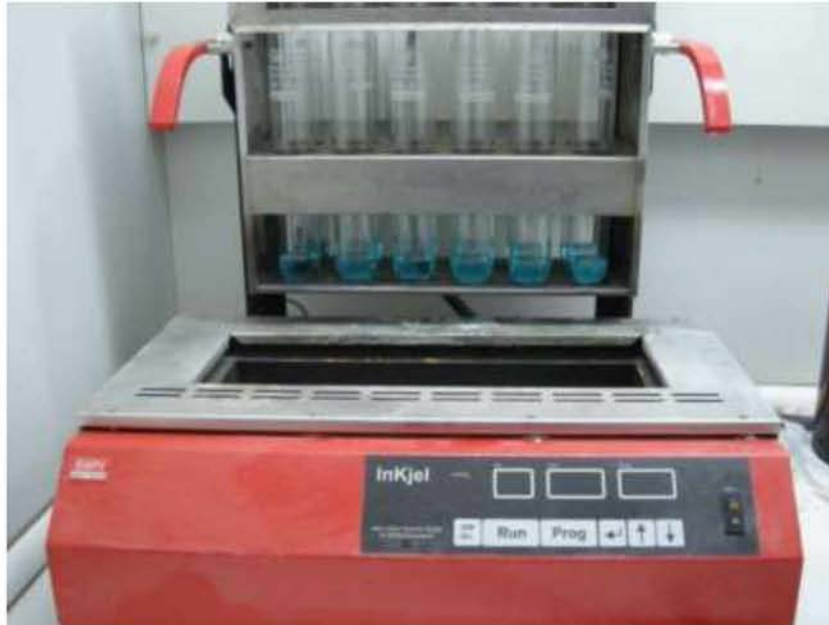
Εικόνα 25. Μετά το πέρας της συσκευής πέψης, τα δείγματα αφέθηκαν στη συσκευή δέσμευσης των καπνών

Κατόπιν, η αμμωνία, που αποδεσμεύτηκε σε αέρια μορφή αποστάχθηκε με υδρατμούς σε ειδική κωνική φιάλη απόσταξης που περιείχε 50 ml βορικού οξέος ( \text{H}_2\text{BO}_3 ). Στη φιάλη απόσταξης, η αμμωνία αντέδρασε με βορικό οξύ και τελικώς, το άζωτο του δείγματος δεσμεύτηκε σε μορφή βορικού αμμωνίου, σύμφωνα με τις παρακάτω χημικές αντιδράσεις: