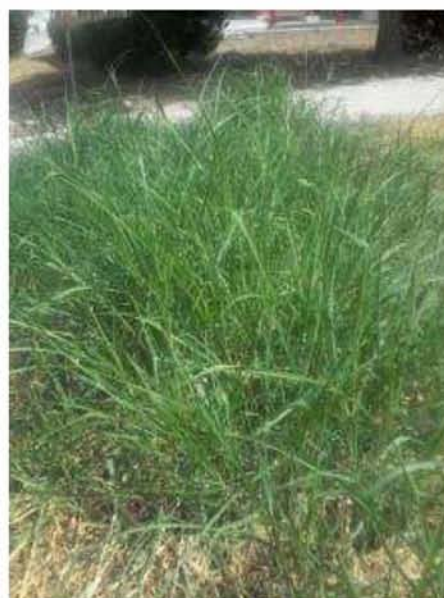
Εικόνα 12. Βέλιουρας ( Sorghum halepense )