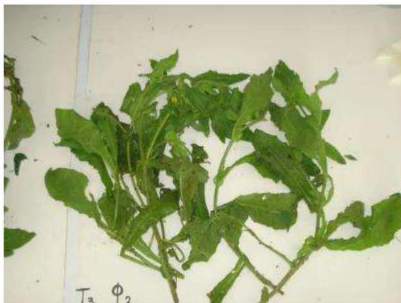
Εικόνα 9. Ραδίκι ( Cichorium intybus )

Το καλλιεργούμενο ραδίκι είναι φυτό πολυετές με πασσαλώδη παχιά ρίζα και φύλλα μακριά (Εικ. 9). Η ρίζα του είναι πασσαλώδης και αναπτύσσεται σε μεγάλο βάθος. Κατά το στάδιο της αναπαραγωγής, που αυτό είναι στο τέλος της άνοιξης, το φυτό σχηματίζει μακρύ ανθοφόρο βλαστό με διακλαδώσεις. Επάνω στις διακλαδώσεις σχηματίζονται ταξιανθίες (κεφαλές) με άνθη χρώματος λευκού ή γαλάζιου. Ο καρπός (σπόρος) είναι αχάινιο με πολλές λεπτές τρίχες που τον βοηθούν να μεταφέρεται με τον αέρα σε μακρινές αποστάσεις (Δημητράκης 1998).