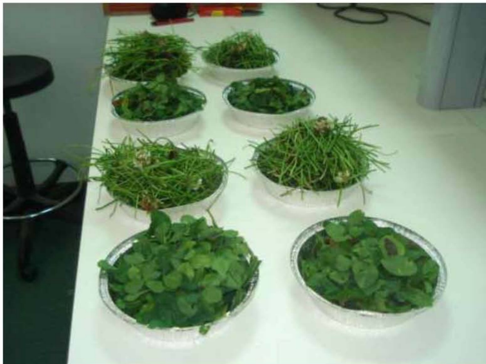
Εικόνα 19. Διαχωρισμός φύλλων-βλαστών