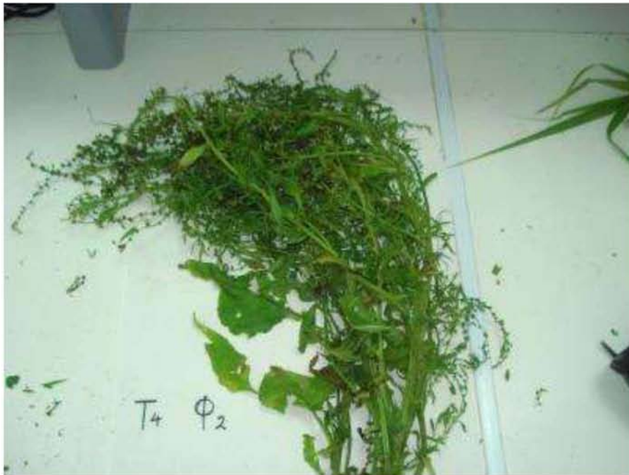
Εικόνα 8. Σέσκουλο διετές ( Beta vulgaris )