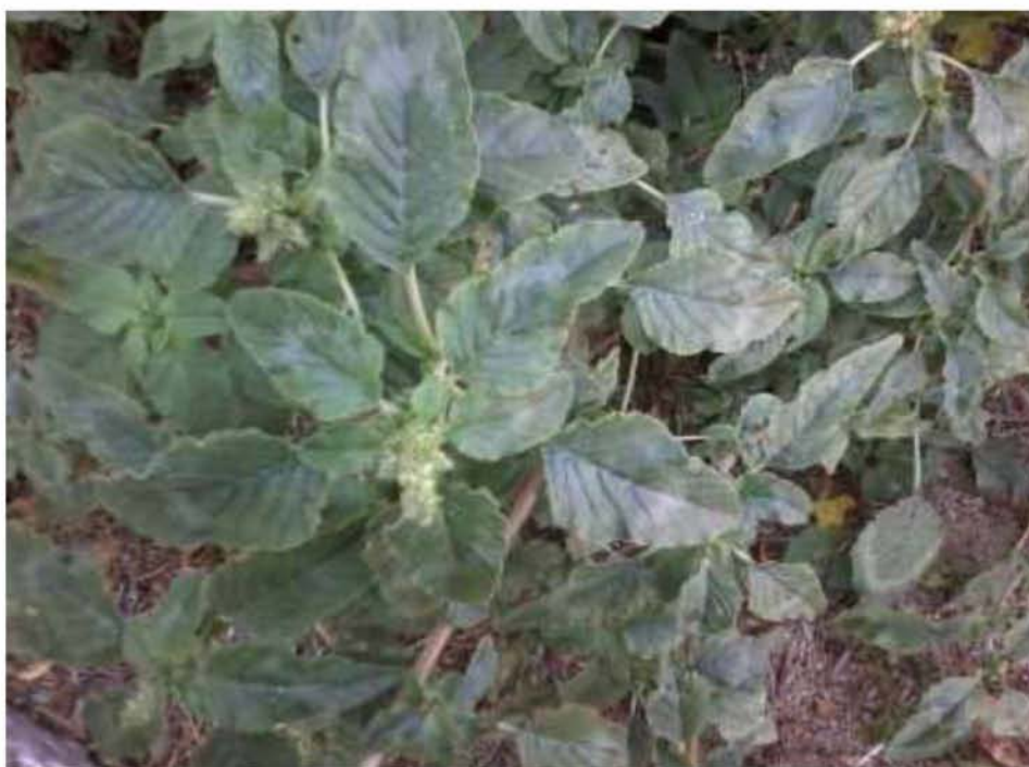
Εικόνα 13. Βλήτο άγριο ( Amaranthus albus )

Το φυτό βρέθηκε ως αυτοφυής βλάστηση, σε 3 μονάδες και αυτές είναι της Αμφιθέας, του Τυρνάβου και της Κοιλιάδας σε στάδιο προχωρημένης βλάστησης και ανθοφορίας (Εικ.13). Το άγριο Βλήτο (ή άσπρο) είναι ετήσιο, εαρινό, δικοτυλήδοно φυτό. Ο βλαστός έχει όρθια ανάπτυξη με σχήμα κυλινδρικό και χρώμα λευκό έως κίτρινο. Δεν έχει τρίχες στην επιφάνειά του και το ύψος του κυμαίνεται από 10 έως 50 cm. Τα φύλλα είναι ωσειδή ή λογχοειδή και χρώμα πράσινο με λευκές αποχρώσεις. Έχουν ευδιάκριτα νεύρα τα οποία τους δίνουν τραχιά υφή. Ακόμη, τα φύλλα δεν έχουν τρίχες στην επιφάνεια, είναι έμμισχα και με εναλλασσόμενη διάταξη. Η ταξιανθία είναι πράσινος στάχυς που σχηματίζεται στις μασχάλες των φύλλων. Ανθοφορεί από τον Ιούνιο ως τον Σεπτέμβριο. Οι σπόροι είναι μαύροι, φακοειδείς. Αναπαράγεται και φυτρώνει τους μήνες Απρίλιο και Μάιο. Η ρίζα είναι πασσαλώδης καλά ανεπτυγμένη.