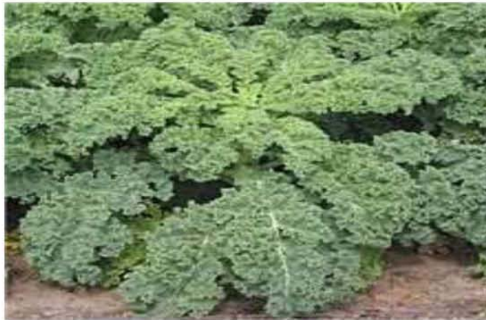
Εικόνα 10. Λαχανίδα, πηγή: en.wikipedia.org/wiki/kale

Η λαχανίδα είναι φυτό διετές μέχρι την παραγωγή του σπόρου. Έχει σγουρά γκριζοπράσινα φύλλα τα οποία στο κέντρο δεν σχηματίζουν κεφαλή και το μήκος τους φτάνει τα 30 cm, ενώ μπορεί να φτάσει έως και τα 90 cm (Εικ. 10). Η ρίζα είναι πασσαλώδης, τραχιά και αποξηλωμένη. Τα άνθη είναι χρώματος λευκού ή κιτρινωπού και βρίσκονται σε ταξιανθία στην κορφή του φυτού. Ο καρπός είναι κεράτιο και κατά την ωρίμανση φέρει πολυάριθμους σκούρου χρώματος σπόρους.