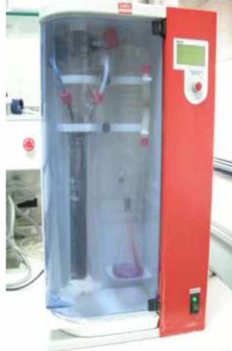
Εικόνα 27. Συσκευή Kjeldahl εν ώρα λειτουργίας, με εμφανή την αλλαγή χρώματος.

Τελικό στάδιο στη διαδικασία της μεθόδου Kjeldahl είναι εκείνο της τιτλοδότησης. Κατά την τιτλοδότηση, το βορικό αμμώνιο που προέκυψε από τις προαναφερόμενες αντιδράσεις, τιτλοδοτήθηκε με υδροχλωρικό οξύ, με τη βοήθεια του δείκτη pH.