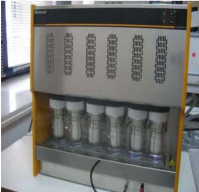
Εικόνα 21. Συσκευή Soxtec στην οποία είχαν τοποθετηθεί τα δείγματα με τα γυάλινα δοχεία εκχύλισης.

φλόγα), μέχρι το σημείο βρασμού του οργανικού διαλύτη. Με τη βοήθεια της εξάτμισης και της συμπύκνωσης στον ψυκτήρα, ο διαλύτης μεταφερόταν εντός του χάρτινου ηθμού, εκχυλίζοντας έτσι το λίπος.