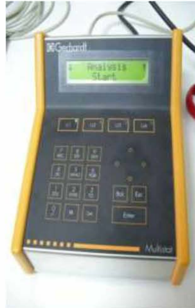
Εικόνα 22. Χειριστήριο της συσκευής Soxtec.

Στο δεύτερο στάδιο, το εκχύλισμα που προέκυψε συσσωρεύτηκε στον πυθμένα του δοχείου εκχύλισης, ενώ ο διαλύτης συμπυκνώθηκε στον ψυκτήρα και διαχύθηκε εκ νέου στο δείγμα με σκοπό την επαναλαμβανόμενη εκχύλιση. Συνολικά η διαδικασία της εκχύλισης διήρκησε περίπου 2 ώρες, ενώ μετά το τέλος της, ο οργανικός διαλύτης απορροφήθηκε πλήρως σε διάστημα 15 min και τα ολικά λιπίδια του δείγματος παρέμειναν στον πυθμένα του δοχείου εκχύλισης, όπως φαίνεται και στην (Εικ.23).