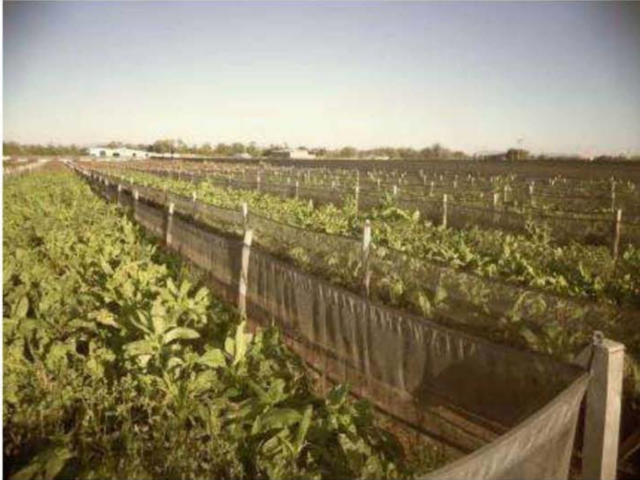
Εικόνα 15. Σαλλιγκαροτροφίο Τερψιθέας