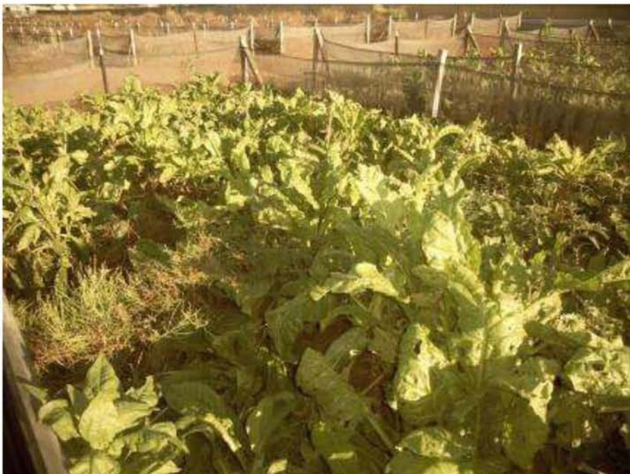
Εικόνα 16. Σαλλιγκαροτροφίο Αμφιθέας