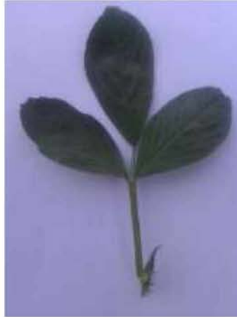
Εικόνα 2. Φύλλο Μηδικής