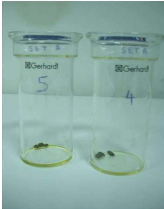
Εικόνα 23. Ολικά λιπίδια που παρέμειναν στον πυθμένα των φιαλών, μετά το πέρας της διαδικασίας της εκχύλισης.

Αφού απορροφήθηκε τελικά ο οργανικός διαλύτης, οι φιάλες που περιείχαν τα δείγματα τοποθετήθηκαν σε πυραντήριο στους 75°C για 15 min. Αυτό είχε ως αποτέλεσμα την ολική απομάκρυνση του διαλύτη (πετρελαϊκός αιθέρας), στην περίπτωση που δεν είχε εξατμιστεί κάποιο μέρος του. Ακολούθησε η μεταφορά των φιαλών εκχύλισης σε ξηραντήριο, όπου αφέθηκαν για τουλάχιστον 30 min, ούτως ώστε να κρυσώσουν τα δείγματα. Ο χάρτινος ηθμός, μέσα στον οποίο είχε τοποθετηθεί το δείγμα των φυτικών δειγμάτων αφαιρέθηκε και οι γυάλινες φιάλες εκχύλισης επαναζυγίστηκαν.