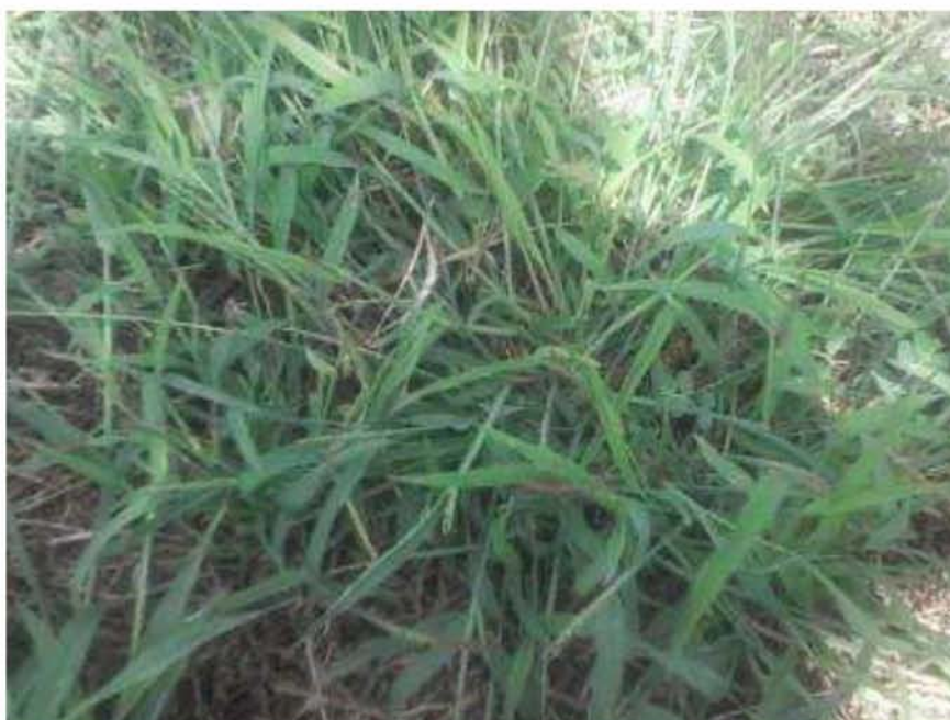
Εικόνα 11. Αγριάδα ( Cynodon dactylon )

εαρινό πολυετές που ανήκει στα μονοκοτυλήδονα. Αναπαράγεται με στόλωνες, ριζώματα και σπόρους. Εκφύεται την άνοιξη και το καλοκαίρι. Το χειμώνα το υπέργειο τμήμα καταστρέφεται, αλλά τα ριζώματα διατηρούνται στο έδαφος και την άνοιξη επαναβλαστάνουν. Ο βλαστός του φυτού είναι καλάμι κυλινδρικό με έρπουσα έκφυση και χρώμα πράσινο – γκριζο. Δεν έχει τρίχες και το μήκος του κυμαίνεται από 10 έως 20 cm. Ο κολεός των φύλλων έχει τρίχες και χρώμα ωχροκίτρινο. Αγκαλιάζει το καλάμι στα κατώτερα φύλλα και στη θέση των ωτιδίων έχει λευκές τρίχες. Το γλωσσίδιο απουσιάζει και στη θέση του υπάρχουν τρίχες οι οποίες είναι κοντύτερες από αυτές των ωτιδίων. Το έλασμα των φύλλων είναι επίπεδο, έχει τραχιά υφή με μη ευδιάκριτο κεντρικό νεύρο, έχει μήκος 5 – 10 cm και στην πάνω επιφάνεια φέρει τρίχες. Η ταξιανθία είναι στάχης και το μέγεθός της είναι από 3 έως 10 cm. Τα σταχύδια είναι μονανθή. Ανθοφορεί από τον Ιούνιο έως τον Οκτώβριο. Η ρίζα είναι θυσανωτή και έχει ριζώματα.