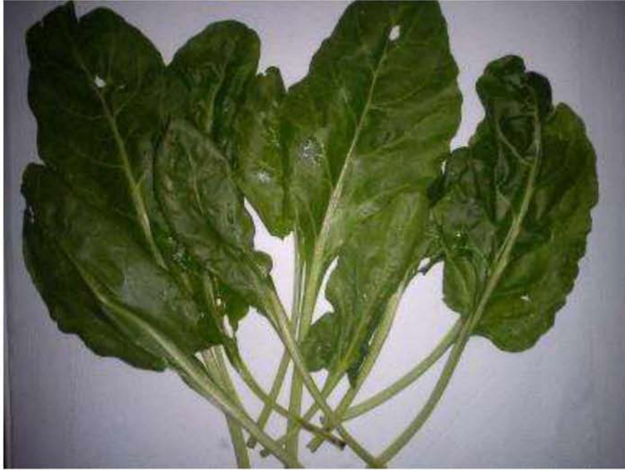
Εικόνα 7. Σέσκουλο έτους ( Beta vulgaris )