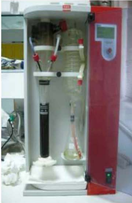
Εικόνα 26. Συσκευή Kjeldahl εκτός λειτουργίας.