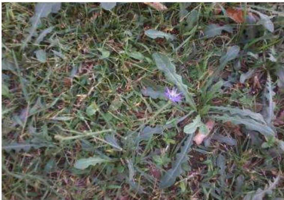
Εικόνα 14. Ραδίκι άγριο ( Taraxacum officinale )

Το άγριο Ραδίκι βρέθηκε στη μονάδα του Τυρνάβου ως αυτοφυής βλάστηση σε στάδιο βλάστησης και αρχικής ανθοφορίας. Είναι πολυετές, χειμερινό αλλά και εαρινό, δικοτυλήδονο φυτό. Φυτρώνει την άνοιξη. Ο βλαστός είναι πράσινος και κυλινδρικός, έχει όρθια ανάπτυξη, δεν έχει τρίχες στην επιφάνεια του και το ύψος του κυμαίνεται από 3 έως 30 cm. Τα φύλλα είναι πράσινα, έμμισχα και βρίσκονται σε διάταξη ροζέτας (Εικ. 14). Είναι λογχοειδή, οδοντωτά με ευδιάκριτα νεύρα, λεία υφή και τρίχες στην κάτω επιφάνεια. Το άνθος είναι κεφαλή με έντονο κίτρινο χρώμα. Ο ποδίσκος του άνθους είναι μακρύς και φέρει τρίχες. Ανθοφορεί από τον Απρίλιο έως τον Ιούνιο. Ο καρπός είναι αχάινιο και το κάθε φυτό αγριοράδικου μπορεί να παράγει από 200 έως 5000 σπόρους. Αναπαράγεται κυρίως με σπόρους και λιγότερο με τμήματα ριζών. Η ρίζα είναι πασσαλώδης και έχει τη δυνατότητα να δίνει νέα φυτά.