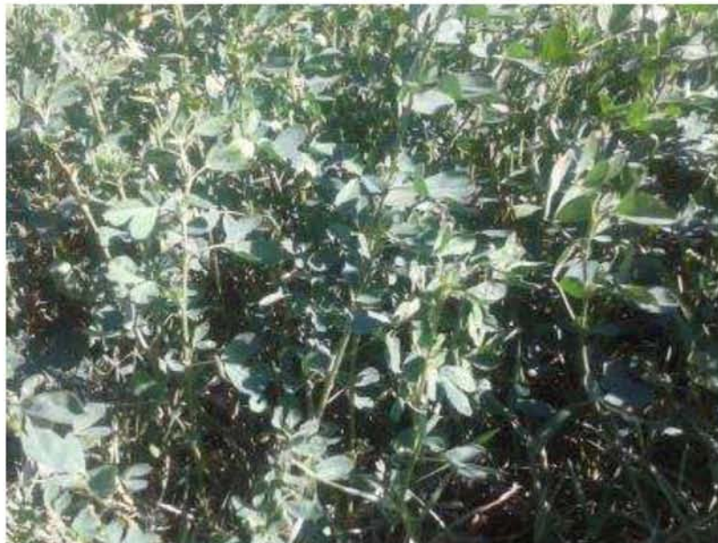
Εικόνα 1. Μηδική ( Medicago sativa )

Βασική διαφορά της μηδικής από άλλα κτηνοτροφικά ψυχανθή είναι ότι πρόκειται για φυτό πολυετές και πολλαπλών κοπών, με ικανότητα γρήγορης αναβλάστησης.