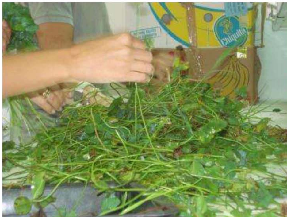
Εικόνα 17. Διαχωρισμός των φυτών