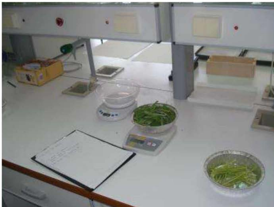
Εικόνα 20. Ζύγιση νοπού-ξηρού βάρους