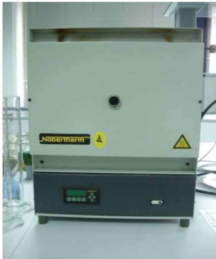
Εικόνα 28. Αποτεφρωτήρας για τον προσδιορισμό της τέφρας στα σιτηρέσια