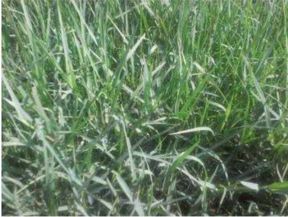
Εικόνα 6. Δακτυλίδα ( Dactylis glomerata )