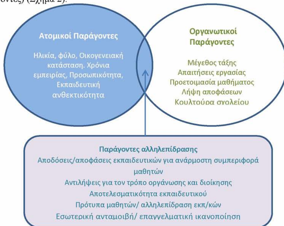
Σχήμα 2: Παράγοντες επαγγελματικής εξουθένωσης εκπαιδευτικών (Chang, 2009, σελ. 199).

Υποστηρίζεται ότι υπάρχουν διάφοροι παράγοντες που εντείνουν την εμφάνιση της επαγγελματικής εξουθένωσης στους εκπαιδευτικούς (Vachon, 1987. Maslach et al., 2001). Πιο συγκεκριμένα κατά την Vachon (1987), αυτοί οι παράγοντες έχουν ως πυρήνα κυρίως ατομικά κριτήρια. Αυτά τα ατομικά κριτήρια περιλαμβάνουν τα ατομικά χαρακτηριστικά (την ηλικία, το φύλο, την οικογενειακή κατάσταση κτλ.), τους ενδοατομικούς παράγοντες (κίνητρα, επιθυμίες κτλ.), τους διαπροσωπικούς παράγοντες (στήριξη του περιβάλλοντος) και τους κοινωνικο-πολιτισμικούς παράγοντες. Κατά τον Chang (2009), εκτός από τους ατομικούς παράγοντες που συμβάλλουν στην εμφάνιση της επαγγελματικής εξουθένωσης υπάρχουν οι οργανωτικοί παράγοντες και οι παράγοντες αλληλεπίδρασης. Οι οργανωτικοί παράγοντες περιλαμβάνουν το κοινωνικοοικονομικό επίπεδο του σχολείου και τις απαιτήσεις της εργασίας. Τέλος, οι παράγοντες αλληλεπίδρασης αναφέρονται στις αλληλεπιδράσεις των δύο παραπάνω παραγόντων (ατομικοί και οργανωτικοί παράγοντες) (Σχήμα 2).