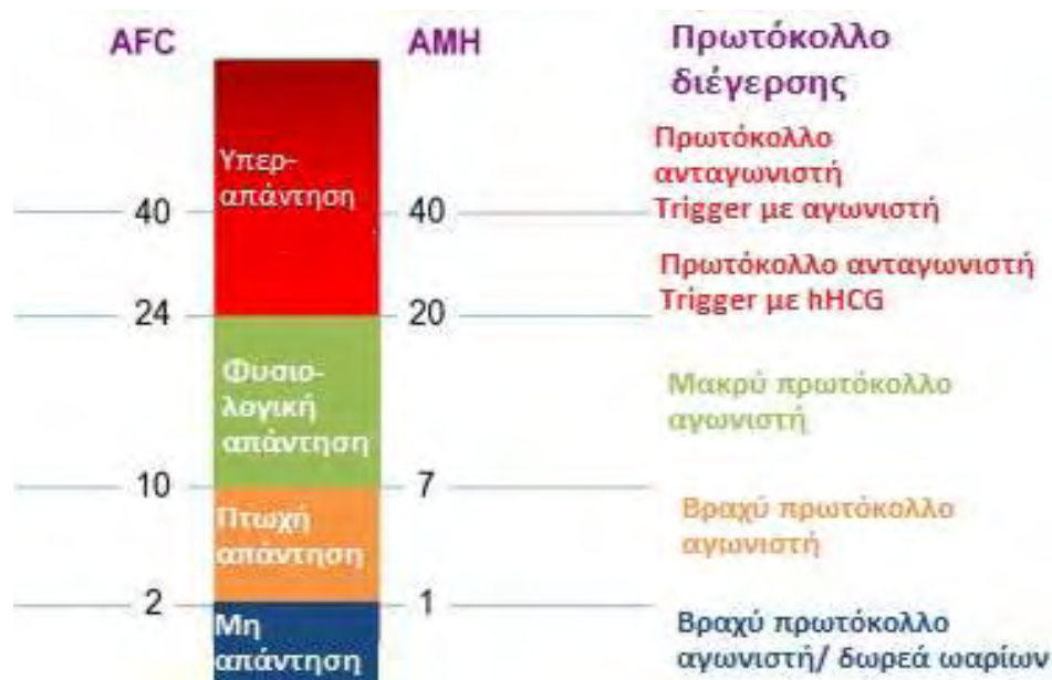
Τροποποίηση από Nelson S, 2013

ωθητικές εφεδρείες θα υπεραπαντήσουν, ενώ γυναίκες με χαμηλές εφεδρείες δεν θα ανταποκριθούν τόσο καλά ή θα απαιτήσουν μεγαλύτερες δόσεις. Βήματα έχουν γίνει προς την κατεύθυνση της εξατομίκευσης της δόσης των γοναδοτροφινών αλλά ακόμα φαίνεται ότι η έρευνα είναι σε πρώιμα στάδια. Τέλος ο Nelson προτείνει μια στρατηγική θεραπευτικής προσέγγισης ανάλογα με τα αποτελέσματα των τεστ αυτών. (Nelson S, 2013)