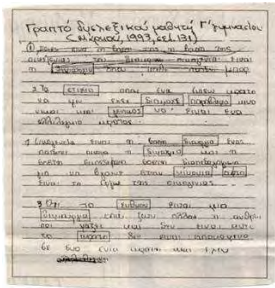
Εικόνα 2: Ενδεικτική γραφή μαθητή Γυμνασίου με Μαθησιακές δυσκολίες.

Τα γραπτά που παρατίθενται στις εικόνες 1 & 2, είναι τυπικά των δεξιοτήτων συγγραφής που έχουν πολλοί μαθητές με Μ.Δ.