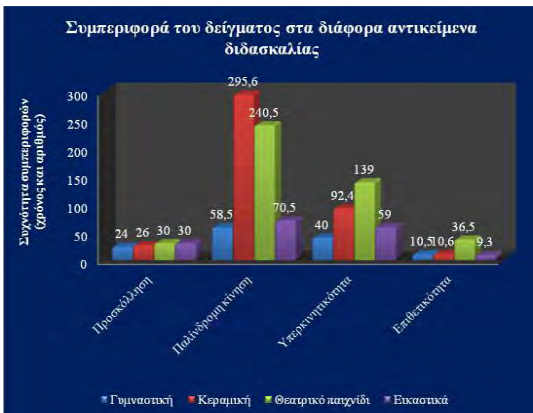
Σχήμα 6. Η συμπεριφορά του δείγματος στα διάφορα αντικείμενα διδασκαλίας.

Καταγράφοντας τη συμπεριφορά του δείγματος στα διάφορα αντικείμενα διδασκαλίας, παρατηρήθηκε ότι η μικρότερη εμφάνιση της προσκόλλησης σε αντικείμενο ήταν κατά τη διάρκεια του μαθήματος της φυσικής αγωγής και η υψηλότερη στο μάθημα των εικαστικών και του θεατρικού παιχνιδιού. Η μικρότερη εμφάνιση της παλίνδρομης κίνησης ήταν επίσης στη φυσική αγωγή και η υψηλότερη στην κεραμική. Η υπερκινητικότητα, η μικρότερη συχνότητα εμφάνισής της ήταν στη φυσική αγωγή και η υψηλότερη στο θεατρικό παιχνίδι ενώ η επιθετικότητα χαμηλότερη ήταν στα εικαστικά και η υψηλότερη στο θεατρικό παιχνίδι.