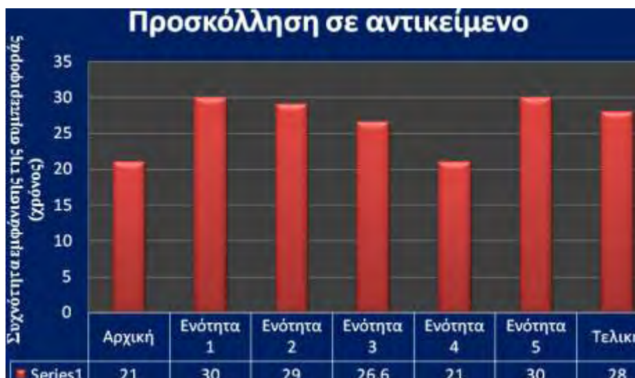
Σχήμα 4. Συχνότητα εμφάνισης της προσκόλλησης σε αντικείμενο (χρόνος σε λεπτά) στις 5 ενότητες άσκησης και στα μαθήματα φυσικής αγωγής.

Η παλίνδρομη κίνηση του σώματος και η υπερκινητικότητα, μεταξύ της αρχικής και της τελικής μέτρησης, στα μαθήματα φυσικής αγωγής έχουν μειωθεί σημαντικά, σε αντίθεση με την επιθετική συμπεριφορά και την προσκόλληση που αυξήθηκε.