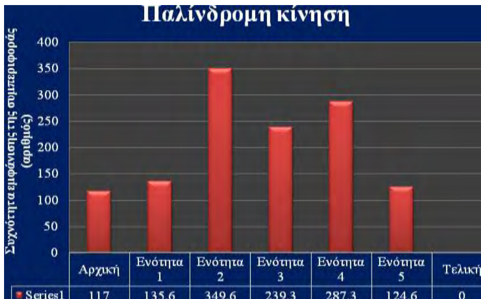
Σχήμα 1. Συχνότητα εμφάνισης της παλίνδρομης κίνησης (αριθμός) στις 5 ενότητες άσκησης και στα μαθήματα φυσικής αγωγής.

σετ των 6 επαναλήψεων). Όσον αφορά τη δεύτερη μέτρηση σημειώθηκε εξαφάνιση της παλίνδρομης κίνησης (Σχήμα 1).