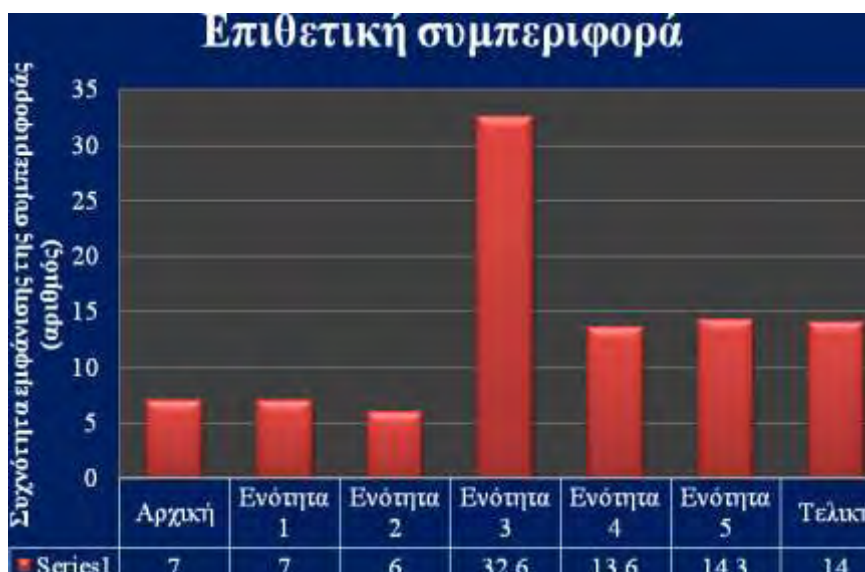
Σχήμα 3. Συχνότητα εμφάνισης της επιθετικής συμπεριφοράς (αριθμός) στις 5 ενότητες άσκησης και στα μαθήματα φυσικής αγωγής.

Η υψηλότερη συχνότητα εμφάνισης της προσκόλλησης σε αντικείμενο μεταξύ των πέντε ενοτήτων άσκησης, καταγράφηκε μετά την εφαρμογή των ενοτήτων 1 (έντονη αερόβια, οπτικοκινητικός συντονισμός και ισορροπία), δηλ. συγκεκριμένα εξάσκηση σε στατικό ποδήλατο υψηλής έντασης, διάρκειας 10 λεπτών, άσκηση σε τραμπολίνο (2 σετ των 6 επαναλήψεων), βολές σε καλάθι καλαθοσφαίρισης (2 σετ των 6 επαναλήψεων) και βάδιση σε χαμηλή δοκό ισορροπίας μήκους 2 μέτρων (2 φορές διένυε όλη τη δοκό) και 5 (αερόβια και οπτικοκινητικός συντονισμός), άσκηση σε στατικό ποδήλατο υψηλής έντασης, διάρκειας 10 λεπτών, άσκηση σε στατικό ποδήλατο μέτριας έντασης, διάρκειας 20 λεπτών και βολές σε καλάθι καλαθοσφαίρισης (2 σετ των 6 επαναλήψεων). Η χαμηλότερη συχνότητα εμφάνισης της προσκόλλησης σε αντικείμενο καταγράφηκε μετά από τη συμμετοχή του ατόμου στην ενότητα 4 (αερόβια) και συγκεκριμένα άσκηση σε στατικό ποδήλατο υψηλής έντασης, διάρκειας 10 λεπτών, άσκηση σε στατικό ποδήλατο μέτριας έντασης, διάρκειας 20 λεπτών και άσκηση σε τραμπολίνο (2 σετ των 6 επαναλήψεων). Όσον αφορά στα μαθήματα φυσικής αγωγής σημειώθηκε αύξηση της προσκόλλησης σε αντικείμενο (Σχήμα 4).