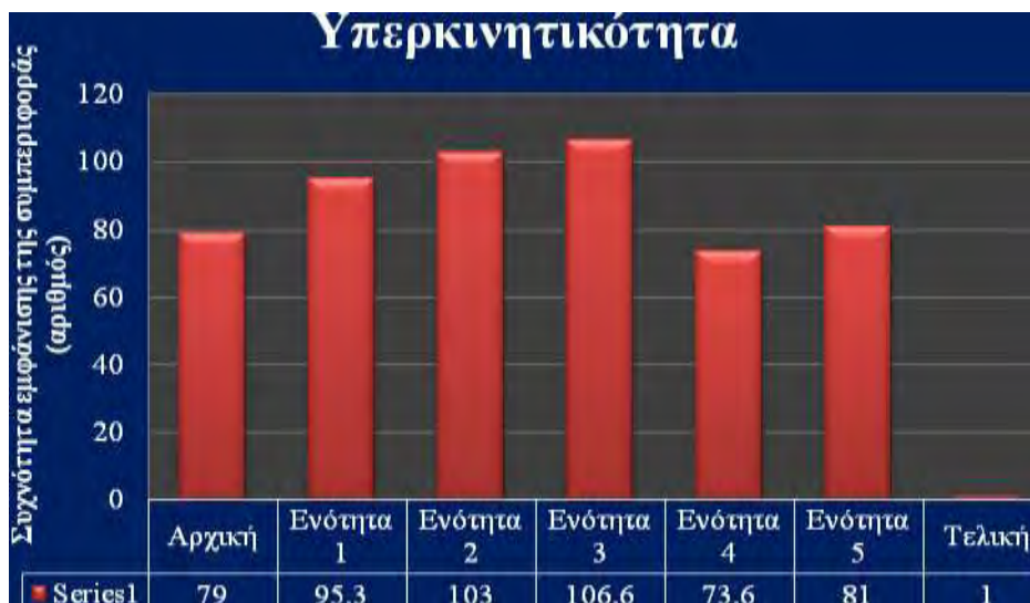
Σχήμα 2. Συχνότητα εμφάνισης της υπερκινητικότητας (αριθμός) στις 5 ενότητες άσκησης και στα μαθήματα φυσικής αγωγής.

Η υψηλότερη συχνότητα εμφάνισης της επιθετικότητας μεταξύ των πέντε ενοτήτων άσκησης, καταγράφηκε μετά την εφαρμογή της ενότητας 3 (αερόβια και ισορροπία) και συγκεκριμένα : άσκηση σε στατικό ποδήλατο υψηλής έντασης, διάρκειας 10 λεπτών, άσκηση σε στατικό ποδήλατο μέτριας έντασης, διάρκειας 20 λεπτών και βάδιση σε χαμηλή δοκό ισορροπίας μήκους 2 μέτρων (2 φορές διένυε όλη τη δοκό). Η χαμηλότερη συχνότητα εμφάνισης της επιθετικότητας καταγράφηκε μετά από τη συμμετοχή του ατόμου στην ενότητα 2 (μέτρια αερόβια, οπτικοκινητικός συντονισμός και ισορροπία), δηλαδή εξάσκηση σε στατικό ποδήλατο μέτριας έντασης, διάρκειας 20 λεπτών, άσκηση σε τραμπολίνο (2 σετ των 6 επαναλήψεων), βολές σε καλάθι καλαθοσφαίρισης (2 σετ των 6 επαναλήψεων) και βάδιση σε χαμηλή δοκό ισορροπίας μήκους 2 μέτρων (2 φορές διένυε όλη τη δοκό). Όσον αφορά στα μαθήματα φυσικής αγωγής σημειώθηκε αύξηση της επιθετικής συμπεριφοράς (Σχήμα 3).