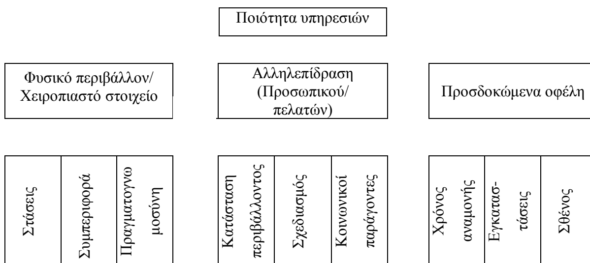
Σχήμα 2. Το ιεραρχικό μοντέλο της ποιότητας υπηρεσιών (Brady & Cronin, 2001)

Εν αντιθέση ο Carman (1990), στην έρευνα του για την αντίληψη της ποιότητας υπηρεσιών σε ξενοδοχεία, κατέληξε στο διαχωρισμό της ποιότητας παροχής υπηρεσιών σε εννέα κατηγορίες. Επιπλέον οι Brady και Cronin (2001) υποστήριξαν ότι η ποιότητα υπηρεσιών αποτελείται από τρεις διαστάσεις, προσθέτοντας στις ήδη δύο διαστάσεις του Gronroos («περιβάλλον υπηρεσιών» και «Αλληλεπίδραση Προσωπικού/ πελατών», το καινοτόμο στοιχείο των «προσδοκώμενων οφελών» από την συμμετοχή (outputs). Σχήμα 1.