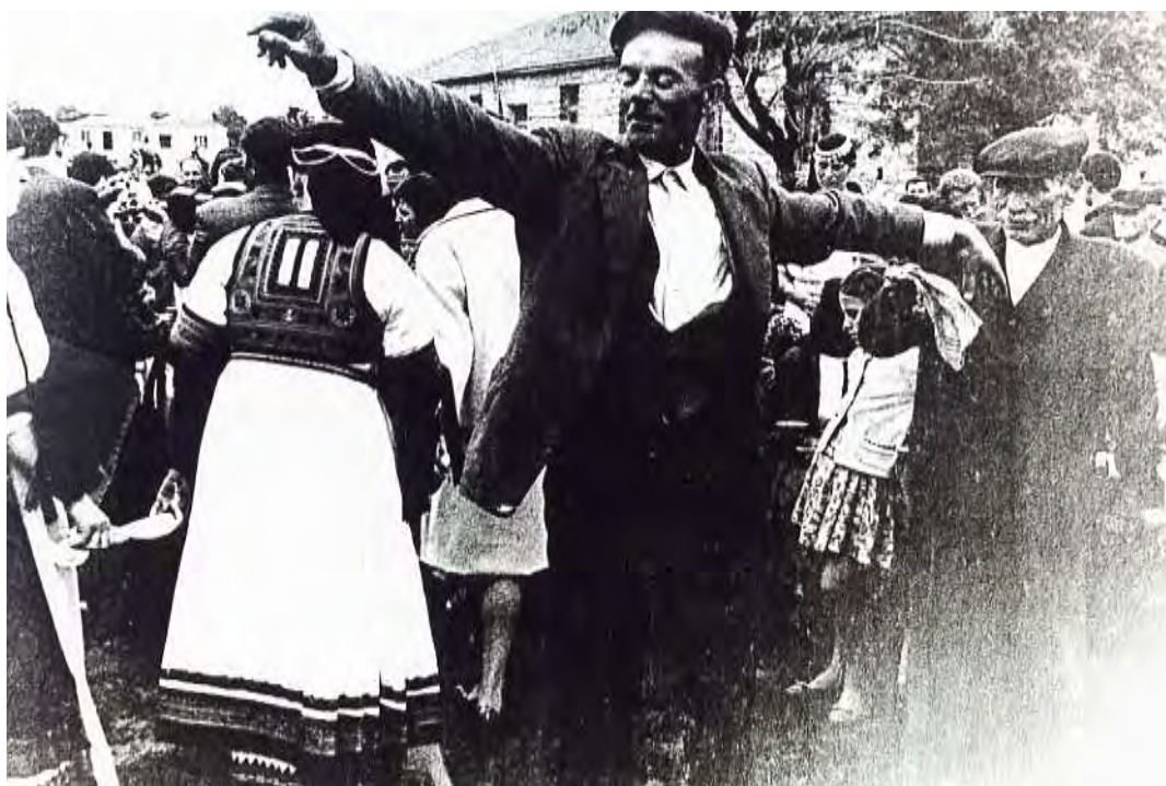
Ο πεθερός της νύφης χορεύει στην αυλή (Θεοχάρης Ν. 1950 )

Τρία γαρύφαλλα χρυσά Σε ένα ασημένιο τάσι Να ζήσουν σαν τον Όλυμπο Σαν τ' άσπρο περιστέρι Να ζήσουν χρόνους εκατό Και εξάμηνα διακόσια Να κάνουν γιους μαλάματα Και γιους μαργαριτάρια.