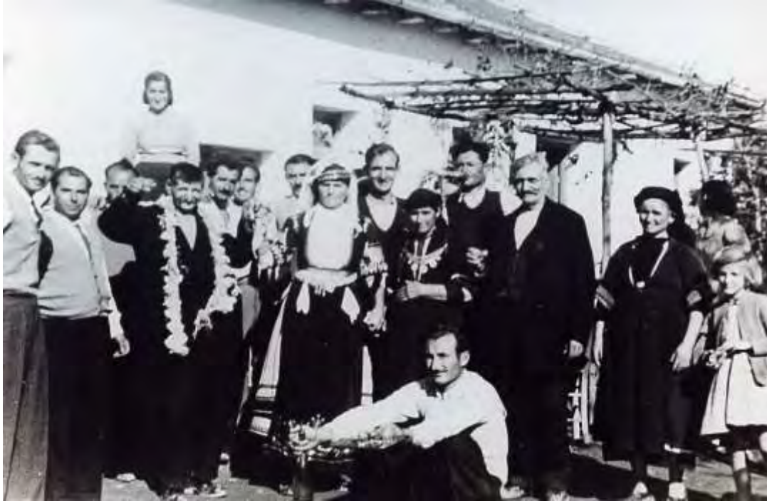
Στο δρόμο για τη βρύση (εποχής 1950 )