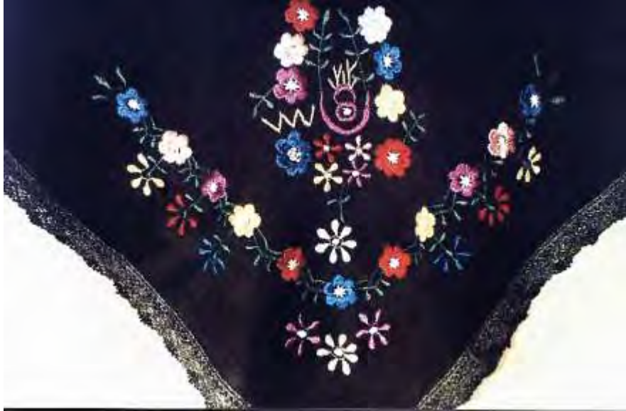
Κεφαλομάντηλο διπλωμένο οικογένειας Τρουβά - Μπακαβέλου