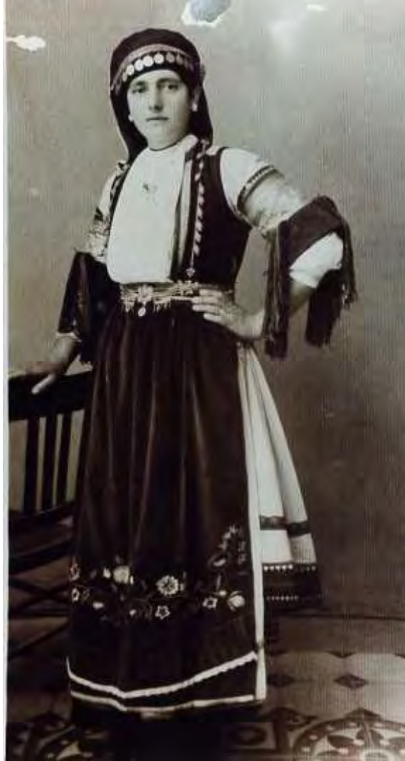
Αρραβωνιασμένη κοπέλα ( 1953 )