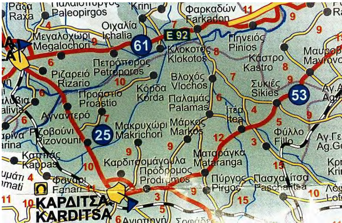
Πολιτικός χάρτης νομού Καρδίτσας ( περιοχή έρευνας Παλαμάς )

Η περιοχή συμμετέχει στη ζωή μιας πολιτισμένης κοινωνίας.