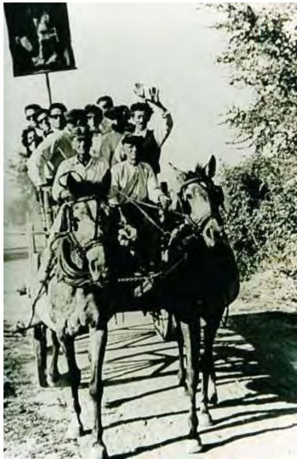
Το φλάμπουρο ( εποχής 1950 )

Εάν η νύφη ήταν από το ίδιο χωριό, πήγαιναν στο σπίτι με τα πόδια. Μπροστά ο πεθερός με τη στολισμένη κανάτα στο χέρι και η παραδοσιακή ορχήστρα. Παραπίσω ο γαμπρός ανάμεσα στους δύο αβλαμάδες και ακολουθούσαν όλοι οι υπόλοιποι. Στο δρόμο χόρευαν και τραγουδούσαν διάφορα δημοτικά τραγούδια.