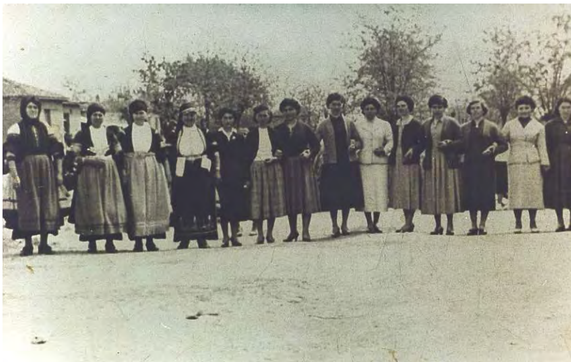
Κορίτσια στο σεργιάνι ( εποχής 1950 )

Παρακάτω αναφέρουμε μερικά ενδεικτικά τραγούδια, από το σεργιάνι :