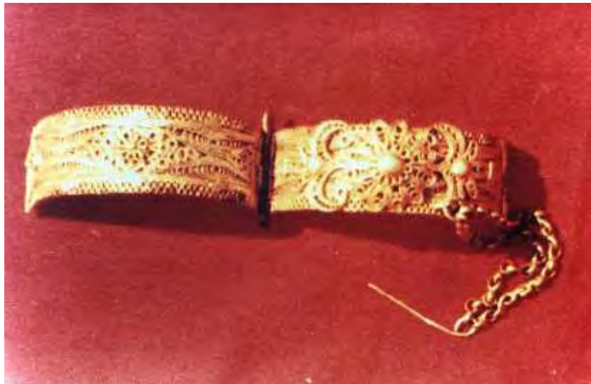
Μπιλιτζίκι συρματερό οικογένειας Αγγέλη

Μπιλιτζίκι: Ειδικό βραχιόλι για το χέρι της καραγκούνας.