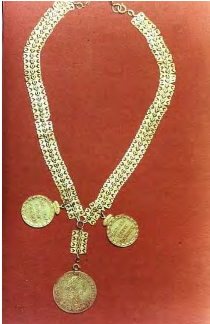
Ντουμπλόνι με προσθήκες ( δυο παράσημα ) Οικογένειας Τρουβά - Μπακαβέλου

Ντουμπλόνι: Είδος κοσμήματος που κρέμεται με χρυσή καδένα από το λαιμό.