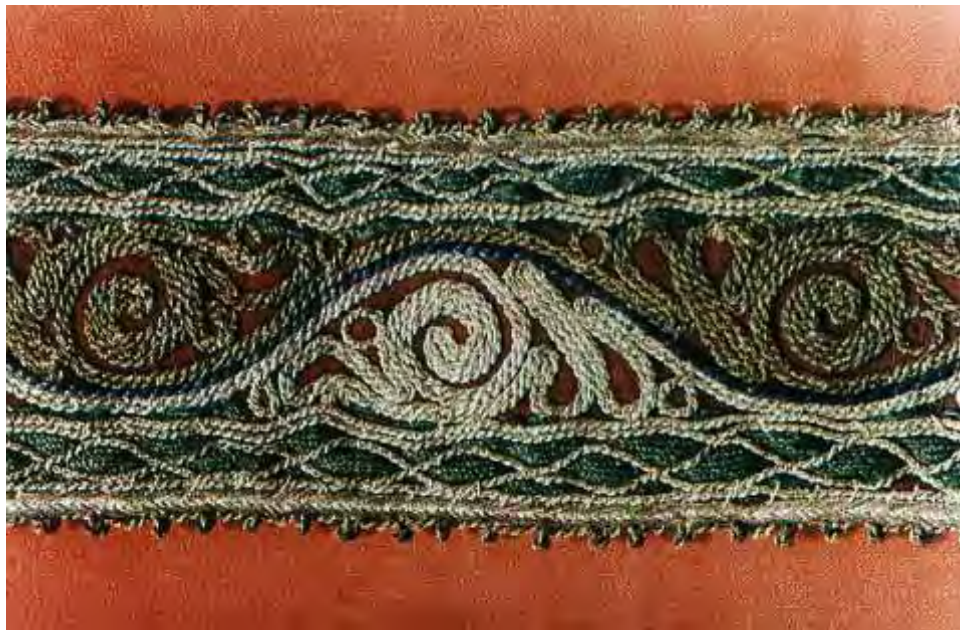
Ζωνάρι εποχής 1900 οικογένειας Παλούκη

Είναι χρωματιστό, κεντητό και πλάτους περίπου δέκα εκατοστών. Ζώνεται στη μέση και συγκρατεί από το κάτω μέρος την τραχηλιά.