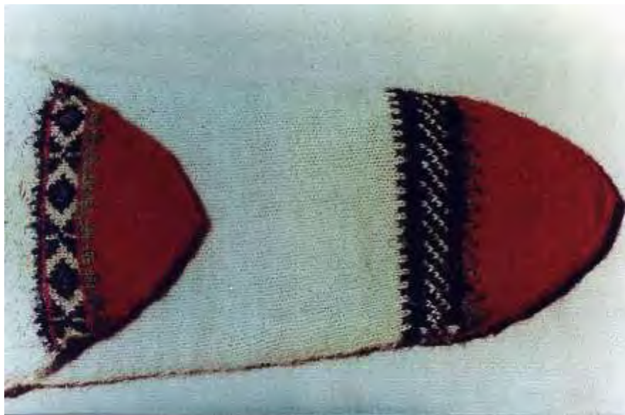
Τσερέπια προικιάρικα οικογένειας Βαΐτση

Τα τσερέπια είναι μάλλινα άσπρα, ψηλά μέχρι το γόνατο και με σχέδιο στη φτέρνα και τη μύτη. Δένονται λίγο κάτω από τα γόνατα με σχοιιά, τα λεγόμενα « τσιρπνόσκνα ».