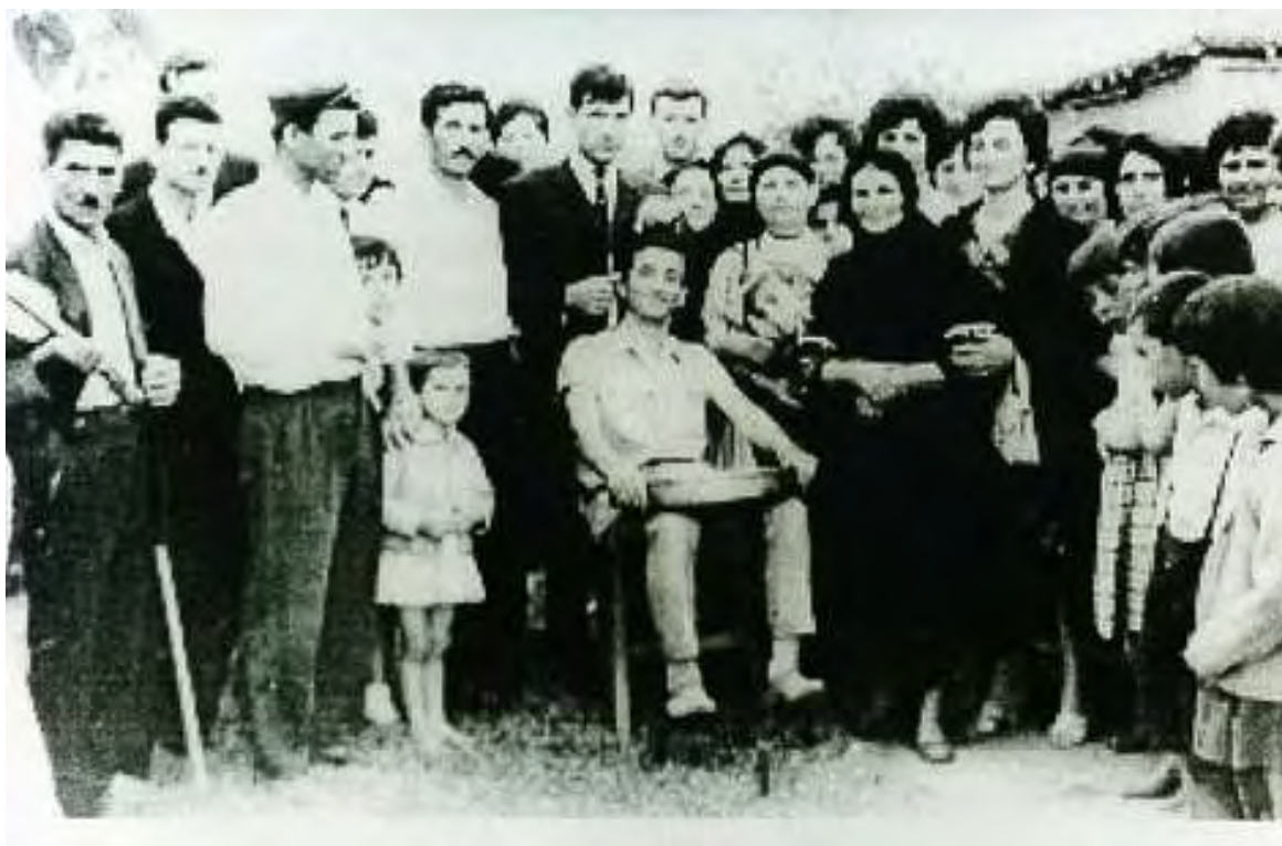
Ξύρισμα του γαμπρού (εποχής 1950 )

Ένας από τους αβλαμάδες ξύριζε τον γαμπρό. Όταν τελείωνε το ξύρισμα, οι συγγενείς ευχόταν στο γαμπρό «καλά στέφανα» και τον άσπριζαν, δηλαδή έριχναν νομίσματα στο ταψί. Τα νομίσματα αυτά τα έπαιρνε ο αβλάμης που τον ξύριζε. Ο άλλος αβλάμης τον έρανε με ένα κλωνάρι βασιλικό και η μάνα του έριχνε ρύζι στο ταψί.