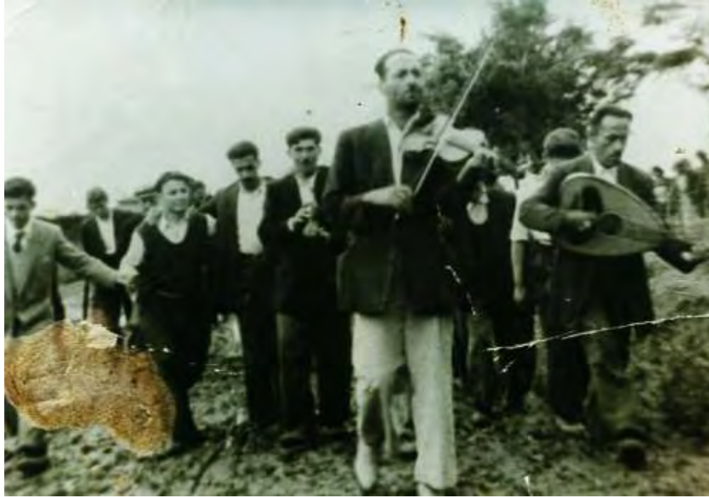
Παραδοσιακή ορχήστρα ( εποχής 1950 )

Στο σπίτι της νύφης γινόταν γλέντι από το πρωί. Η νύφη στεκόταν στον «αναγκώνα» (γωνία) του δωματίου της και δεχόταν τις ευχές. Όταν συγκεντρώνονταν αρκετοί καλεσμένοι έβγαζαν τη νύφη στη «ρούγα» (αυλή) και έμπαινε στο χορό. Η νύφη χόρευε το εξής δημοτικό τραγούδι: