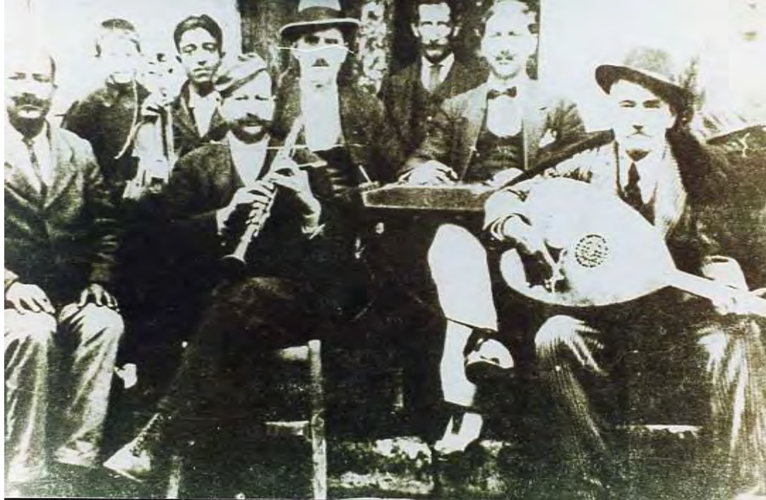
Παραδοσιακή ορχήστρα ( δεκαετίας '40 - '50 )

Μόλις σουρούπωνε άρχιζαν να έρχονται οι καλεσμένοι. Πρώτα οι στενοί συγγενείς και μετά οι υπόλοιποι. Οι καλεσμένοι δεν πήγαιναν δώρα στον γαμπρό, αλλά μόνο στη νύφη.