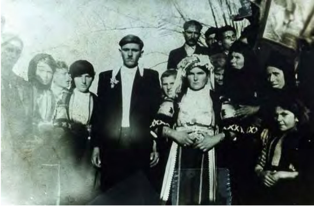
Ο γαμπρός με τη νύφη στο σπίτι του ( 1950 )