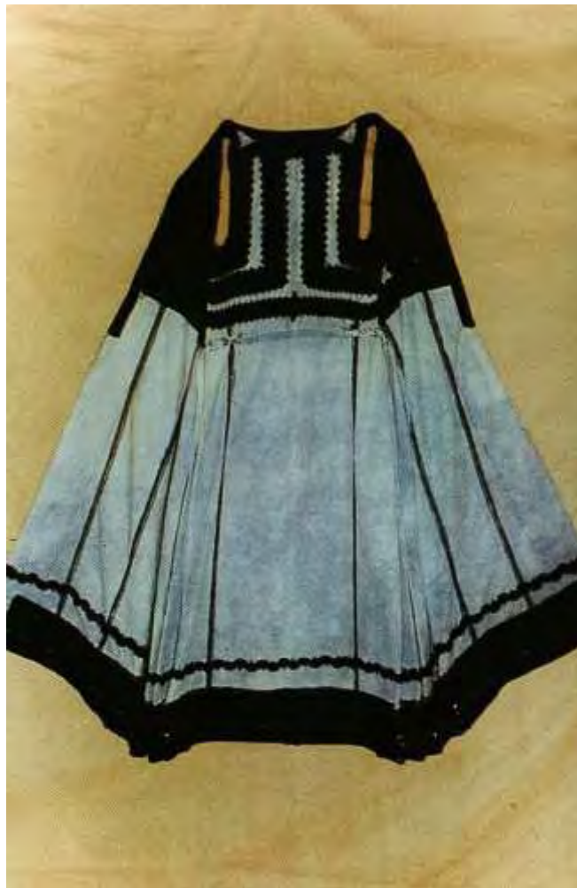
Νυφικός σαΐας οικογένειας Βαΐτση

Είναι λίγο πιο κοντός από το καβάδι, κεντημένος με μαύρα στολίδια στον ποδόγυρο και στην πλάτη. Είναι ανοικτός από το μπροστινό μέρος και χωρίς μανίκια. Φοριέται πάνω από το καβάδι και στις δύο άκρες σχηματίζει μεγάλες πιέτες (λαγκιόλια). Τον κεντούσαν οι γυναίκες μόνες τους με μαύρα στολίδια και στο τέλος τον περνούσαν από τη γαλαζούρα και την κόλα και έπαιρνε ένα θαλασσί χρώμα.