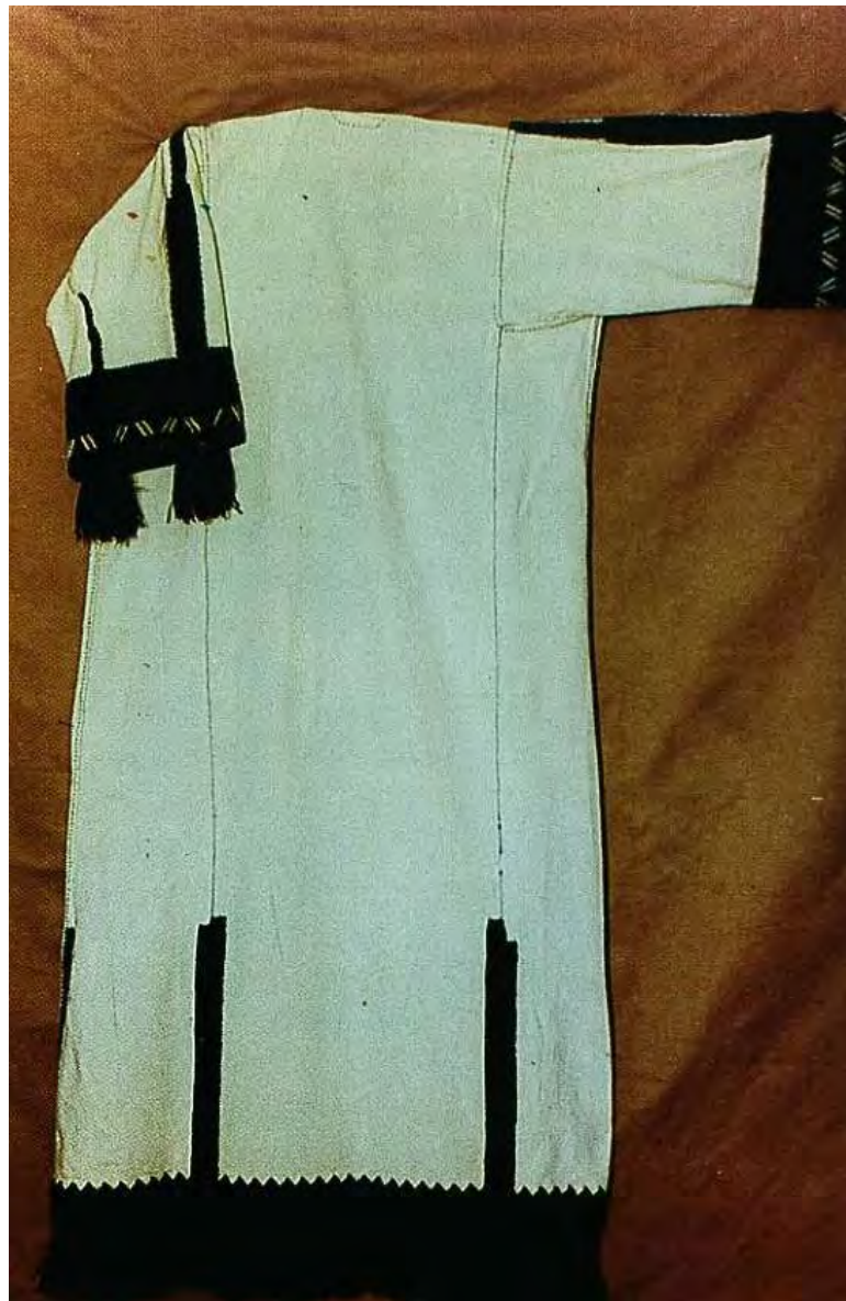
Κάμσο οικογένειας Παπακώστα

Κάμσο (πουκάμισο): Είναι μακρύ ένδυμα, λευκό με μανίκια. Φτάνει μέχρι τα κότσια των ποδιών. Είναι κεντημένο στον ποδόγυρο και στο κάτω μέρος των μανικιών. Τα κεντίδια είναι συνήθως μαύρα. Στον ποδόγυρο και στο κάτω μέρος των μανικιών έχει μακριά και πυκνά κρόσια. Το κάμσο το κεντούσαν μόνες τους οι γυναίκες με μάλλινες κλωστές.