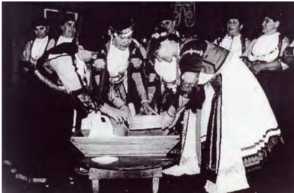
Προζύμια (νεότερη αναπαράσταση από συλλογή Ζ. Τζιαμούρτα )

Στα δύο σπίτια επικρατούσε μια χαρούμενη ατμόσφαιρα με γέλια και τραγούδια.