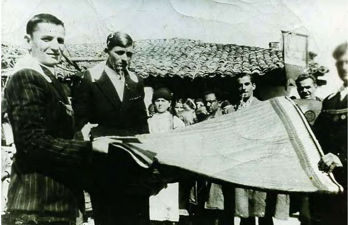
Οι αβλαμάδες χορεύουν το καβάδι (εποχής 1950 )

Μετά το χόρεμα της στολής τα ρούχα συγκεντρώνονταν πάλι στην κανίστρα. Το γλέντι τελείωνε και το συμπεθεριό ετοιμαζόταν να ξεκινήσει για το σπίτι της νύφης.