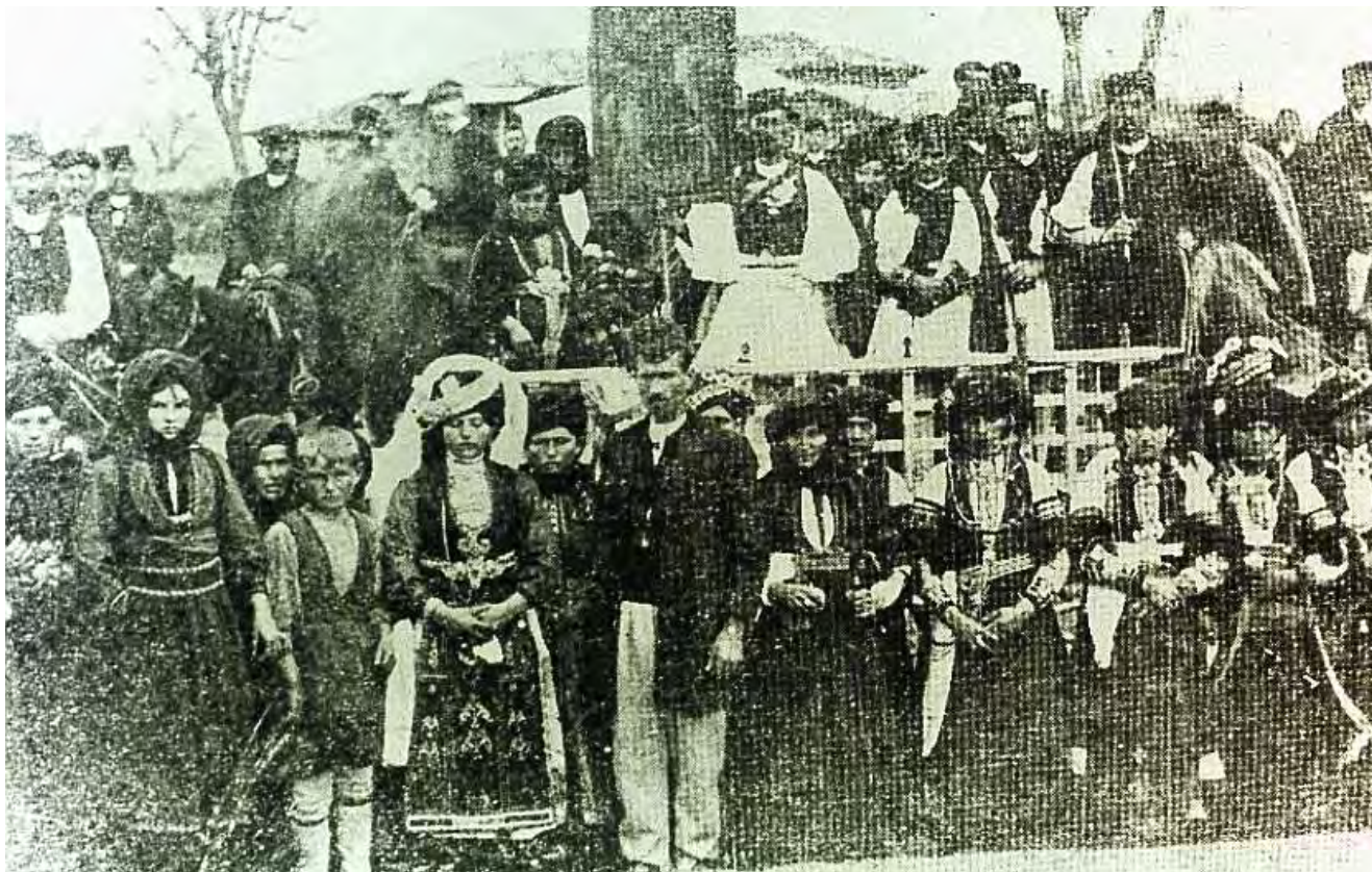
Γάμος στον Παλαμά (1920)

νιόπαντροι δεν έπρεπε για ένα χρόνο να πάνε σε κηδεία, ακόμη και πολύ-πολύ στενού συγγενή και δεν έπρεπε να σταυρωθούν τα συμπεθεριά. Δηλαδή εάν ένα σόι έπαιρνε από το άλλο νύφη, έπρεπε να παίρνει συνεχώς νύφες. Αν έπαιρνε γαμπρό τα συμπεθεριά σταυρώνονταν. Αυτό το θεωρούσαν κακό σημάδι.