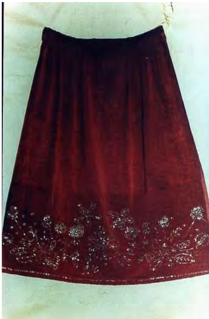
Πεστιμάλι βελούδινο κεντημένο με χάντρες οικογένειας Βαΐτση

γυναίκας, κρέμεται μπροστά και καλύπτει το άνοιγμα του σαϊά και έχει το μήκος που έχει και το κάμσο. Οι γυναίκες αγόραζαν το πανί, το έκοβαν στα μέτρα τους και το κεντούσαν μόνες τους.