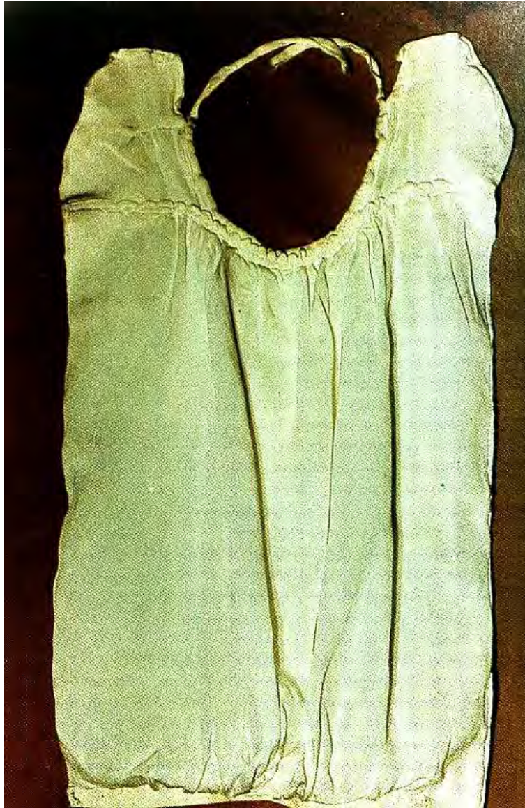
Τραχηλιά με «φασουλάκια» οικογένειας Βαΐτση

Είναι χρώματος συνήθως λευκού, ροζ, κόκκινου και έχει κεντημένη κάθετη ή οριζόντια γιρλάντα. Την ετοίμαζαν μόνες τους οι γυναίκες συνήθως από μεταξωτό ύφασμα. Δένεται από το λαιμό, φτάνει μέχρι τη μέση και καλύπτει το μπροστινό άνοιγμα του καβαδιού.