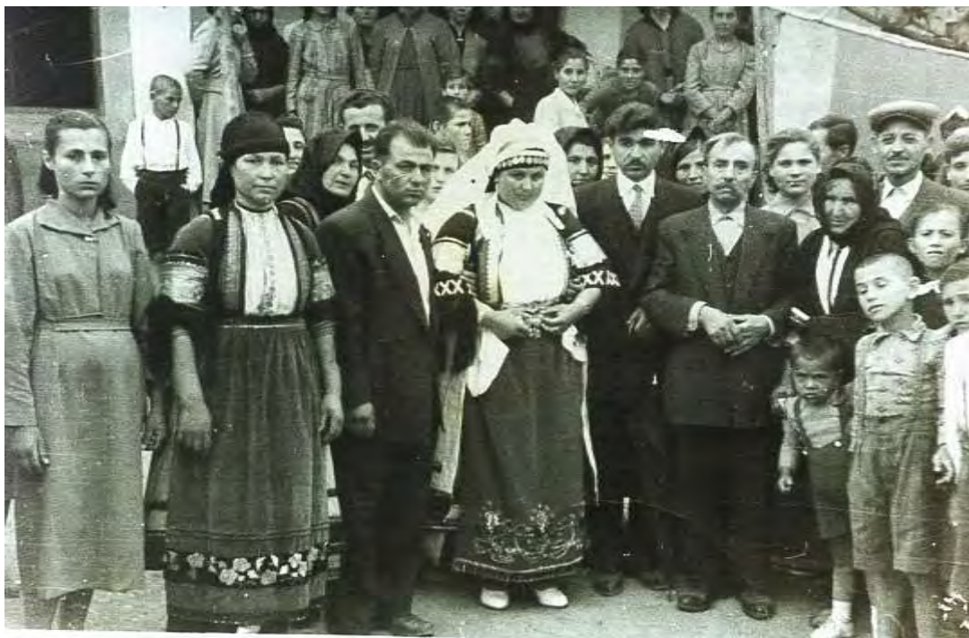
Η νύφη στην αυλή του σπιτιού της ( Παλιούρα – Κατή Δέσποινα 1952 )

Μετά έπαιρναν το δρόμο για την εκκλησία. Μπροστά πήγαιναν τα όργανα, πίσω οι νέοι χορεύοντας, παραπίσω η νύφη και όλοι οι συγγενείς. Φτάνοντας στην εκκλησία η νύφη προσκυνούσε τρεις φορές τον πεθερό της.