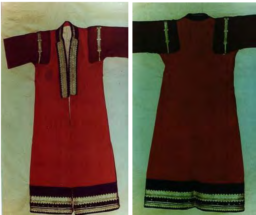
Καβάδι οικογένειας Βαΐτση

Είναι κόκκινο ένδυμα, λίγο πιο κοντό από το κάμσο με μανίκια μέχρι τον αγκώνα. Είναι χρυσοκεντημένο στον ποδόγυρο και την τραχηλιά. Φοριέται πάνω από το κάμσο. Το καβάδι το κεντούσε ειδικός τεχνίτης.