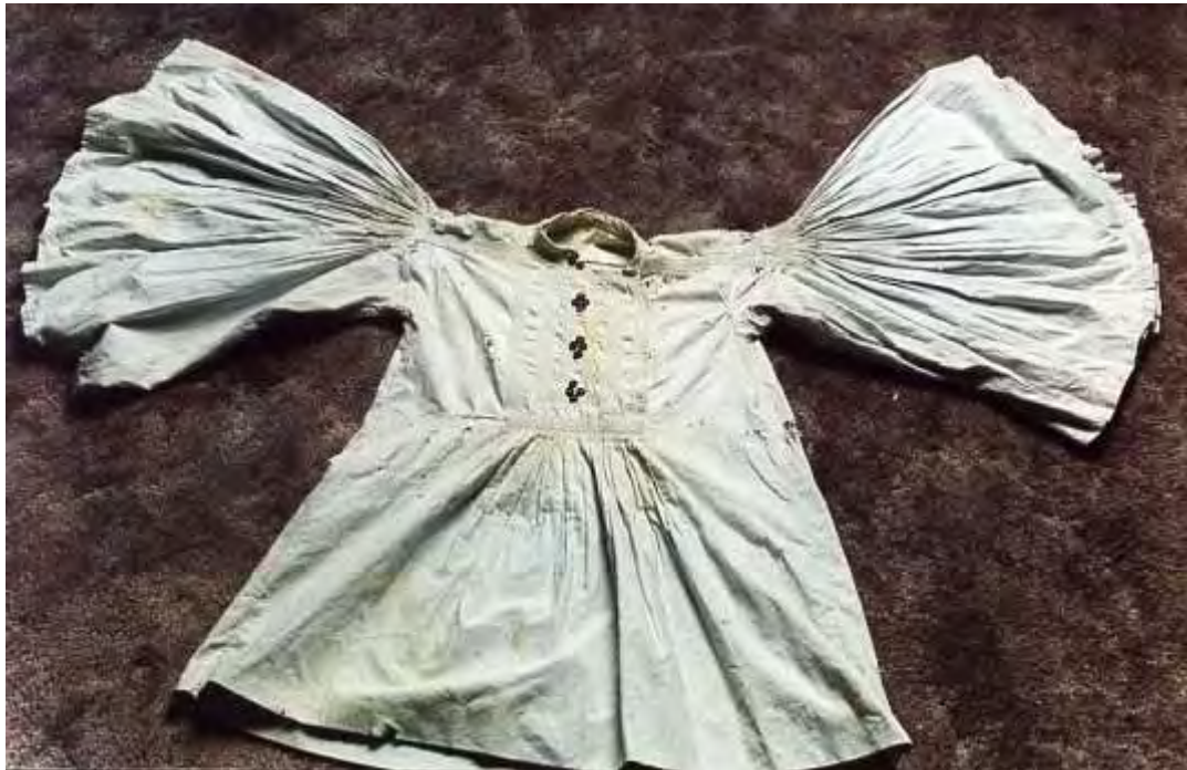
Πουκάμισο φουστανέλας κεντημένο εποχής 1900 (ανήκει στην ιδιωτική συλλογή του Απ. Φιρφιρή )

Κατασάρ (Πουκάμισο): Το πουκάμισο είχε φαρδιά μανίκια και είχε το χρώμα της φουστανέλας.