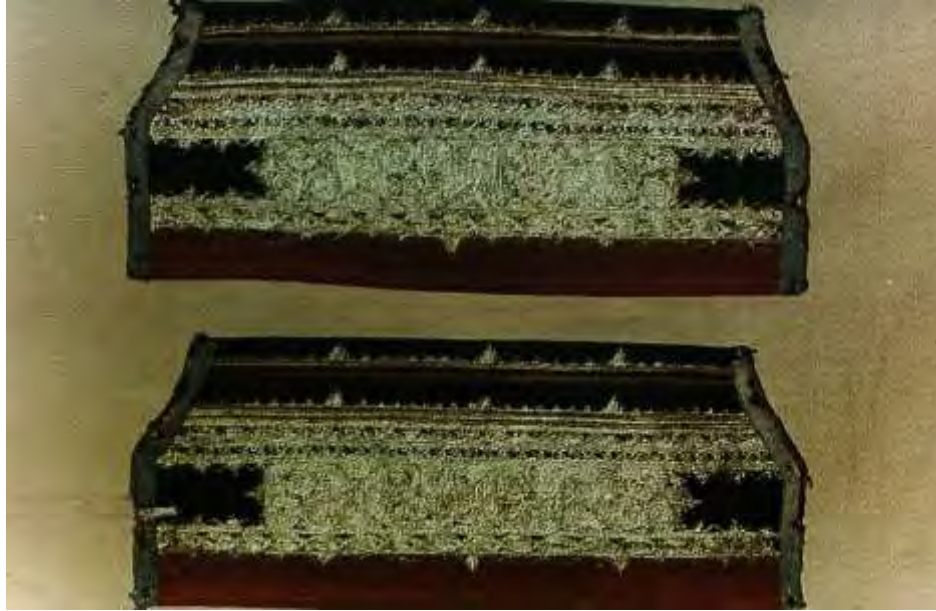
Μανικούλια χρυσά με κύριο κέντημα τα «τριφύλλια» Οικογένειας Τρουβά - Μπακαβέλου