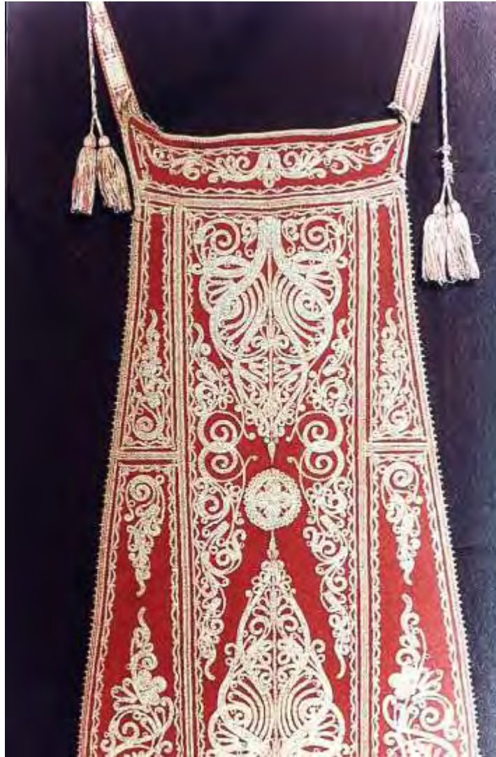
Χρυσή ποδιά της εποχής 1900 οικογένειας Παλούκη