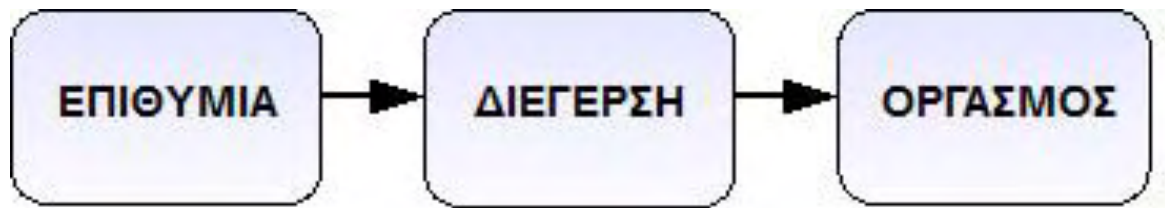
Σχήμα 2. Μοντέλο τριών φάσεων κατά Kaplan.

Τα μοντέλα γραμμικού χαρακτήρα έφεραν τις σοβαρές διαφωνίες μερικών μελετητών της γυναικείας σεξουαλικής λειτουργίας, οι οποίοι τόνιζαν την πολυπλοκότητα της γυναικείας σεξουαλικότητας, αμφισβητούσαν τον ανεξάρτητο χαρακτήρα των φάσεων που περιγράφηκαν και υποστήριζαν ότι, η παρουσία αμιγούς σεξουαλικής επιθυμίας δεν είναι ο κανόνας στη σεξουαλική απόκριση όλων των γυναικών, ενώ το ίδιο συμβαίνει και με την παρουσία ή μη οργασμικής απάντησης.(1,5,13,14) Το ζήτημα της σεξουαλικής επιθυμίας κατέστη το σημαντικότερο σημείο προβληματισμού των μελετητών καθώς ήταν ήδη γνωστό, και θεωρούνταν πλέον δεδομένο, ότι οι γυναίκες δε βίωναν οργασμό σε κάθε σεξουαλική τους επαφή. Το σκεπτικό των μελετητών ήταν ότι η παρουσία ή μη επιθυμίας δεν είναι αυτόνομο γεγονός αλλά μπορεί να συνδέεται και με τις προηγούμενες σεξουαλικές εμπειρίες της γυναίκας. Εάν η γυναίκα δεν έχει θετικά βιώματα από τις σεξουαλικές εμπειρίες της, δεν καθίσταται δυνατή η δημιουργία ισχυρού συναισθηματικού δεσμού που θα γεννήσει την επιθυμία για επόμενες επαφές.(13) Ένα παράδοξο που αδυνατούσαν να εξηγήσουν τα γραμμικά μοντέλα σεξουαλικής απόκρισης ήταν το πώς ήταν δυνατή η ύπαρξη σεξουαλικής επιθυμίας